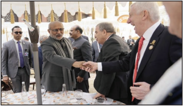
ਆਵਾਜ਼ ਦੇ ਅੰਤਰ ਰੱਖਿਅਕ ਵਜੋਂ ਕੰਮ ਕਰਦੇ ਹਨ, ਜਿਨ੍ਹਾਂ ਨੂੰ ਪਵਿੱਤਰ ਚੈਂਬਰ ਵਿੱਚ ਪ੍ਰਗਟਾਵੇ ਦੀ ਆਜ਼ਾਦੀ ਅਤੇ ਵਿਵਸਥਿਤ ਆਚਰਣ ਵਿਚਕਾਰ ਸਾਵਧਾਨੀਪੂਰਵਕ ਸੰਤੁਲਨ ਬਣਾਈ ਰੱਖਣ ਦਾ ਕੰਮ ਸੌਂਪਿਆ ਜਾਂਦਾ ਹੈ।

ਨਵੀਂ ਦਿੱਲੀ, 16 ਜਨਵਰੀ, (ਅੰਮ੍ਰਿਤਸਰ ਸਿੱਖ): ਰਾਜ ਸਭਾ ਦੇ ਮਾਣਯੋਗ ਚੇਅਰਮੈਨ ਅਤੇ ਭਾਰਤ ਦੇ ਉਪ-ਰਾਸ਼ਟਰਪਤੀ ਨੇ ਅੱਜ ਨਵੀਂ ਦਿੱਲੀ ਦੇ ਸੰਵਿਧਾਨ ਸਦਨ ਵਿਖੇ ਰਾਸ਼ਟਰਮੰਡਲ ਸੰਸਦਾਂ ਦੇ ਸਪੀਕਰਾਂ ਅਤੇ ਪ੍ਰਧਾਨ ਅਧਿਕਾਰੀਆਂ ਦੇ ਸਨਮਾਨ ਵਿੱਚ ਦੁਪਹਿਰ ਦਾ ਖਾਣਾ ਦਿੱਤਾ। ਇਹ ਦੁਪਹਿਰ ਦਾ ਖਾਣਾ 14 ਤੋਂ 16 ਜਨਵਰੀ, 2026 ਤੱਕ ਭਾਰਤ ਸੰਵਿਧਾਨ ਤੋਂ ਰਹੀ ਰਾਸ਼ਟਰਮੰਡਲ ਦੇ ਸਪੀਕਰਾਂ ਅਤੇ ਪ੍ਰੀਜ਼ਾਈਡਿੰਗ ਅਫ਼ਸਰਾਂ ਦੀ 28ਵੀਂ ਕਾਨਫਰੰਸ (CSPOC) ਦੇ ਮੌਕੇ ਤੇ ਆਯੋਜਿਤ ਕੀਤਾ ਗਿਆ ਸੀ। ਆਉਣ ਵਾਲੇ ਪਵਨੰਤਿਆਂ ਦਾ ਸਵਾਗਤ ਕਰਦੇ ਹੋਏ, ਮਾਣਯੋਗ ਚੇਅਰਮੈਨ ਨੇ ਭਾਰਤ ਦੀ