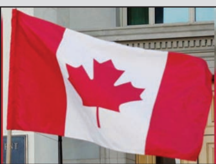
ਕੈਨੇਡੀਅਨ ਅਧਿਕਾਰੀਆਂ ਨੇ ਜੰਮੂ ਅਤੇ ਕਸ਼ਮੀਰ ਦੇ ਨਾਲ-ਨਾਲ ਗੁਜਰਾਤ, ਪੰਜਾਬ ਅਤੇ ਰਾਜਸਥਾਨ ਦੇ ਸਮੇਂ ਸਾਵਧਾਨ ਰਹਿਣ, ਸੈਰ-ਸਪਾਟੇ ਅਤੇ ਯਾਤਰਾ ਨੂੰ ਵਰਤਣ ਵਾਸਤੇ ਅਤੇ

ਵਿਨੀਪੈਗ, 16 ਜਨਵਰੀ, (ਚ.ਨ.ਸ.): ਕੈਨੇਡਾ ਨੇ ਆਪਣੀ ਔਰਗਨਾਈਜ਼ਡ ਟਰਾਵਲ ਐਂਡ ਵਾਈਜ਼ਰੀ ਨੂੰ ਅੱਪਡੇਟ ਕੀਤਾ ਹੈ, ਜਿਸ ਵਿੱਚ ਕੁਝ ਦੇਸ਼ਾਂ ਨੂੰ ਬਹੁਤ ਖ਼ਤਰਨਾਕ ਦੇਸ਼ਿਆਂ ਗਿਆ ਹੈ ਅਤੇ ਕੈਨੇਡੀਅਨ ਨਾਗਰਿਕਾਂ ਨੂੰ ਉਨ੍ਹਾਂ ਦੀ ਯਾਤਰਾ ਕਰਨ ਤੋਂ ਬਚਣ ਦੀ ਸਲਾਹ ਦਿੱਤੀ ਗਈ ਹੈ। ਨਵੀਂ ਐਡਵਾਈਜ਼ਰੀ ਵਿੱਚ ਕੈਨੇਡੀਅਨ ਨਾਗਰਿਕਾਂ ਨੂੰ ਇਰਾਨ ਅਤੇ ਵੈਨੇਜ਼ੁਏਲਾ ਸਮੇਤ ਕਈ ਦੇਸ਼ਾਂ ਦੀ ਯਾਤਰਾ ਤੋਂ ਬਚਣ ਦੀ ਅਪੀਲ ਕੀਤੀ ਗਈ ਹੈ। ਇਸ ਸੂਚੀ ਵਿੱਚ ਇਰਾਨ ਵੈਨੇਜ਼ੁਏਲਾ ਰੂਸ ਉੱਤਰੀ ਕੋਰੀਆ ਇਰਾਕ ਲਿਬੀਆ ਅਫ਼ਗਾਨਿਸਤਾਨ ਬੇਲਾ ਰੂਸ ਬੁਰਕੀਨਾ ਫਾਸੋ ਮੱਧ ਅਫ਼ਰੀਕੀ ਗਣਰਾਜ ਹੈ ਤੀ ਮਾਲੀ ਦੱਖਣੀ ਸੁਡਾਨ ਮਿਆਂਮਾਰ ਨਾਈਜਰ ਸੋਮਾਲੀਆ ਸੁਡਾਨ ਸੀਰੀਆ ਯੁਕਰੇਨ ਯਮਨ ਦੇਸ਼ ਸ਼ਾਮਲ ਹਨ। ਇਸ ਤੋਂ ਇਲਾਵਾ ਭਾਰਤ ਲਈ ਐਡਵਾਈਜ਼ਰੀ ਵਿੱਚ ਵੀ ਕੈਨੇਡਾ ਨੇ ਆਪਣੀ ਯਾਤਰਾ ਦੌਰਾਨ ਬਹੁਤ ਜ਼ਿਆਦਾ ਸਾਵਧਾਨੀ ਦੀ ਲੋੜ ਵਾਲੀਆਂ ਥਾਵਾਂ ਨੂੰ ਵੀ ਸ਼ਾਮਲ ਕੀਤਾ ਹੈ। ਭਾਰਤ ਬਾਰੇ ਦੱਸਿਆ ਗਿਆ ਹੈ ਕਿ ਭਾਰਤ ਵਿੱਚ ਜਾਰੀ ਕੀਤੀ ਗਈ ਇੱਕ ਯਾਤਰਾ ਐਡਵਾਈਜ਼ਰੀ ਵਿੱਚ, ਕੈਨੇਡਾ ਨੇ ਪੂਰੇ ਦੇਸ਼ ਵਿੱਚ ਅਤਿਵਾਦੀ ਹਮਲਿਆਂ ਦੇ ਜੋਖਮ ਦਾ ਹਵਾਲਾ ਦਿੰਦੇ ਹੋਏ, ਭਾਰਤ ਨੂੰ ਸਭ ਤੋਂ ਵੱਧ ਸਾਵਧਾਨੀ ਸ਼੍ਰੇਣੀ ਵਿੱਚ