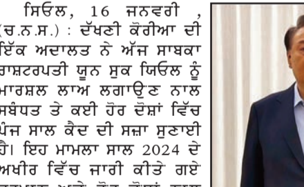
ਸਿਓਲ, 16 ਜਨਵਰੀ, (ਚ.ਨ.ਸ.): ਦੱਖਣੀ ਕੋਰੀਆ ਦੀ ਇੱਕ ਅਦਾਲਤ ਨੇ ਅੱਜ ਸਾਬਕਾ ਰਾਸ਼ਟਰਪਤੀ ਯੂਨ ਸੁਕ ਯਿਲ ਨੂੰ ਸਾਬਕਲ ਲਾਅ ਲਗਾਉਣ ਨਾਲ ਸਬੰਧਤ ਤੇ ਕਈ ਹੋਰ ਦੋਸ਼ਾਂ ਵਿੱਚ ਪੰਜ ਸਾਲ ਕੈਦ ਦੀ ਸਜ਼ਾ ਸੁਣਾਈ ਹੈ। ਇਹ ਮਾਮਲਾ ਸਾਲ 2024 ਦੇ ਅਖੀਰ ਵਿੱਚ ਜਾਰੀ ਕੀਤੇ ਗਏ ਡਰਮਾਨ ਅਤੇ ਹੋਰ ਦੋਸ਼ਾਂ ਨਾਲ ਸਬੰਧਤ ਹੈ ਜਿਸ ਨੂੰ ਲੈ ਕੇ ਯੂਨ ਮਿਲਾਫ਼ ਅੰਨ ਅਪਰਾਧਿਕ ਮੁਕੱਦਮੇ ਚਲ ਰਹੇ ਹਨ ਤੇ ਇਹ ਯੂਨ ਮਿਲਾਫ਼ ਪਹਿਲਾ ਵੇਸਲਾ ਹੈ। ਉਸ ਮਿਲਾਫ਼ ਸਭ ਤੋਂ ਅਹਿਮ ਦੋਸ਼ ਇਹ ਹੈ ਕਿ ਉਸ ਨੇ

ਮਾਮਲੇ ਵਿੱਚ ਉਸ ਨੂੰ ਹੋਰ ਦੋਸ਼ ਲਈ ਸਜ਼ਾ ਸੁਣਾਈ। ਯੂਨ ਨੇ ਤੁਰੰਤ ਇਸ ਵੇਸਲੇ 'ਤੇ ਕੋਈ ਟਿੱਪਣੀ ਨਹੀਂ ਕੀਤੀ ਪਰ ਜਦੋਂ ਪਹਿਲਾਂ ਇੱਕ ਵਕੀਲੀ ਨੇ ਯੂਨ ਲਈ 10 ਸਾਲ ਦੀ ਕੈਦ ਦੀ ਮੰਗ ਕੀਤੀ ਸੀ ਤਾਂ ਯੂਨ ਦੀ ਬਚਾਅ ਟੀਮ ਨੇ ਇਹ ਦੋਸ਼ ਰਾਜਨੀਤੀ ਤੋਂ ਪ੍ਰੇਰਿਤ ਹੋਣ ਦੇ ਲਾਏ ਸਨ। ਦਸੰਬਰ 2024 ਵਿੱਚ ਥੋੜ੍ਹੇ ਸਮੇਂ ਲਈ ਮਾਰਸ਼ਲ ਲਾਅ ਲਾਗੂ ਕਰਨ ਤੋਂ ਬਾਅਦ ਯੂਨ ਨੂੰ ਰਾਸ਼ਟਰਪਤੀ ਦੇ ਅਹੁਦੇ ਤੋਂ ਹਟਾ ਦਿੱਤਾ ਗਿਆ। ਇਸ ਤੋਂ ਬਾਅਦ ਉਨ੍ਹਾਂ ਨੂੰ ਗ੍ਰਿਫ਼ਤਾਰ ਕੀਤਾ ਗਿਆ ਅਤੇ ਬਰਖਾਸਤ ਕਰ ਦਿੱਤਾ ਗਿਆ।