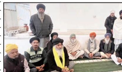
ਫਰਵਰੀ ਨੂੰ ਸ਼੍ਰੀ ਅਖੰਡ ਪਾਠ ਸਾਹਿਬ ਜੀ ਦੇ ਭੰਗ ਉਪਰੰਤ ਪਾਰਮਿਕ ਸਮਾਗਮ ਕਰਵਾਇਆ ਜਾਵੇਗਾ। ਉਨ੍ਹਾਂ ਜਾਣਕਾਰੀ ਦਿੱਤੀ ਕਿ ਇਸ ਸਮੇਂ ਸਮਾਗਮ ਵਿੱਚ ਕਲੱਬ ਵੱਲੋਂ 42 ਵਿਦਿਆਰਥੀਆਂ ਨੂੰ ਇਨਾਮ ਵਜੋਂ ਜਗਸੀਆਂ ਵੰਡਦਾ ਆ ਰਿਹਾ ਹੈ। ਤਾਂ ਜੋ ਵਿਦਿਆਰਥੀਆਂ ਨੂੰ ਪੜ੍ਹਾਈ ਦੇ ਲਈ ਆਉਣ ਵਾਲੀਆਂ ਮੁਸ਼ਕਲਾਂ ਨੂੰ ਦੂਰ ਕੀਤਾ ਜਾਵੇ ਅਤੇ ਇਨਾਮ ਦੇ ਕੇ ਉਹਨਾਂ ਦਾ ਉਤਸ਼ਾਹ ਵਧਾਇਆ ਜਾਵੇ।