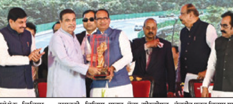
ਰਾਏ ਸੋਨ-ਵਿਦਿਸ਼ਾ ਰਾਸ਼ਟਰੀ ਰਾਜਮਾਰਗ, ਵਿਦਿਸ਼ਾ-ਗਿਆਸਪੁਰ, ਗਿਆਸਪੁਰ-ਰਾਹਤਗੜ੍ਹ ਅਤੇ ਰਿਹਤਗੜ੍ਹ ਤੋਂ ਸਾਗਰ ਰਾਸ਼ਟਰੀ ਰਾਜਮਾਰਗ ਦੇ ਨਿਰਮਾਣ ਅਤੇ ਚੌਝਾਈ ਲਈ ਨੀਂਹ ਪੱਥਰ ਰੱਖਿਆ ਗਿਆ। ਰਾਹਤਗੜ੍ਹ ਵਿੱਚੋਂ ਲੰਘਦੀ ਇੱਕ ਸ਼ਾਨਦਾਰ ਰਾਸ਼ਟਰੀ ਰਾਜਮਾਰਗ, ਇਟਾਰਸੀ-ਬੁੱਧਨੀ-ਬਰਖੋੜਾ-ਓਥੇਦੁਲਗੰਜ ਸੜਕ ਦਾ ਵੀ ਉਦਘਾਟਨ ਕੀਤਾ ਗਿਆ, ਜਿਸ ਨਾਲ ਪੂਰੇ ਖੇਤਰ ਵਿੱਚ ਸੰਪਰਕ ਨੂੰ ਇੱਕ ਨਵੀਂ ਗਤੀ ਮਿਲੀ। ਸ਼੍ਰੀ ਨਿਤਿਨ ਗਡਕਰੀ ਨੇ ਸਟੇਜ ਤੋਂ ਐਲਾਨ ਕੀਤਾ ਕਿ

ਵਿਦਿਸ਼ਾ/ਭੋਪਾਲ/ਨਵੀਂ ਦਿੱਲੀ, 17 ਜਨਵਰੀ (ਚ.ਨ.ਸ.) : ਵਿਦਿਸ਼ਾ ਸੇਂਟਰੀ ਖੇਤਰ ਅਤੇ ਆਸ ਪਾਸ ਦੇ ਜ਼ਿਲ੍ਹਿਆਂ ਨੂੰ ਅੱਜ ਸੜਕ ਵਿਕਾਸ ਦਾ ਇਤਿਹਾਸਕ ਤੋਹਫ਼ਾ ਮਿਲਿਆ, 'ਕੇਂਦਰੀ ਖੇਤੀਬਾੜੀ ਅਤੇ ਕਿਸਾਨ ਭਲਾਈ ਅਤੇ ਪੇਂਡੂ ਵਿਕਾਸ ਮੰਤਰੀ ਸ਼੍ਰੀ ਸ਼ਿਵਰਾਜ ਸਿੰਘ ਚੌਹਾਨ ਦੇ ਵਿਸ਼ੇਸ਼ ਯਤਨਾਂ ਸਦਕਾ। ਕੇਂਦਰੀ ਸੜਕ ਆਵਾਜਾਈ ਅਤੇ ਰਾਜਮਾਰਗ ਮੰਤਰੀ ਸ਼੍ਰੀ ਨਿਤਿਨ ਗਡਕਰੀ ਨੇ ਵਿਦਿਸ਼ਾ ਵਿੱਚ ਲੱਗਭੱਗ 4,400 ਕਰੋੜ ਦੇ ਅੱਠ ਰਾਸ਼ਟਰੀ ਰਾਜਮਾਰਗ ਪ੍ਰੋਜੈਕਟਾਂ ਦਾ ਨੀਂਹ ਪੱਥਰ ਅਤੇ ਉਦਘਾਟਨ ਕੀਤਾ। ਉਨ੍ਹਾਂ ਨੇ ਲੱਗਭੱਗ 450 ਕਰੋੜ ਦੇ ਵਿਕਾਸ ਪ੍ਰੋਜੈਕਟਾਂ ਦਾ ਉਦਘਾਟਨ ਵੀ ਕੀਤਾ। ਮੁੱਖ ਮੰਤਰੀ ਡਾ. ਮੋਹਨ ਯਾਦਵ ਨੇ ਆਪਣੀ ਮੌਜੂਦਗੀ ਨਾਲ ਇਸ ਸਮਾਗਮ ਦੀ ਸ਼ੁੱਠ ਵਧਾਈ।