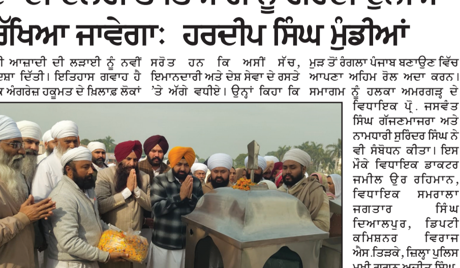
ਸੰਪ੍ਰਦਾ ਵੱਲੋਂ ਪੰਜਾਬ ਸਰਕਾਰ ਨੂੰ ਜੋ ਸੇਵਾ ਲਗਾਈ ਜਾਵੇਗੀ, ਉਹ ਸਿਰ ਨਿਵਾ ਕੇ ਪੂਰੀ ਕੀਤੀ ਜਾਵੇਗੀ। ਕੈਬਨਿਟ ਮੰਤਰੀ ਨੇ ਸੰਗਤ ਨੂੰ ਅਪੀਲ ਕੀਤੀ ਕਿ ਉਹ ਗੁਰੂਆਂ ਅਤੇ ਨਾਮਧਾਰੀ ਸੰਪ੍ਰਦਾ ਵੱਲੋਂ ਦਰਸਾਏ ਮਾਰਗ 'ਤੇ ਚੱਲਦਿਆਂ ਆਪਣੀ ਜ਼ਿੰਦਗੀ ਨੂੰ ਉੱਚੇ ਪੱਧਰ 'ਤੇ ਲੈ ਜਾਣ ਅਤੇ ਸੂਬੇ ਨੂੰ ਸੰਪੂਰਨਤਾ ਦਿਵਾਣ ਦੀ ਸੋਚ ਲਗਾਈ ਜਾਵੇਗੀ। ਉਹ ਸਿਰ ਨਿਵਾ ਕੇ ਪੂਰੀ ਕੀਤੀ ਜਾਵੇਗੀ। ਕੈਬਨਿਟ ਮੰਤਰੀ ਨੇ ਸੰਗਤ ਨੂੰ ਅਪੀਲ ਕੀਤੀ ਕਿ ਉਹ ਗੁਰੂਆਂ ਅਤੇ ਨਾਮਧਾਰੀ ਸੰਪ੍ਰਦਾ ਵੱਲੋਂ ਦਰਸਾਏ ਮਾਰਗ 'ਤੇ ਚੱਲਦਿਆਂ ਆਪਣੀ ਜ਼ਿੰਦਗੀ ਨੂੰ ਉੱਚੇ ਪੱਧਰ 'ਤੇ ਲੈ ਜਾਣ ਅਤੇ ਸੂਬੇ ਨੂੰ ਸੰਪੂਰਨਤਾ ਦਿਵਾਣ ਦੀ ਸੋਚ ਲਗਾਈ ਜਾਵੇਗੀ।