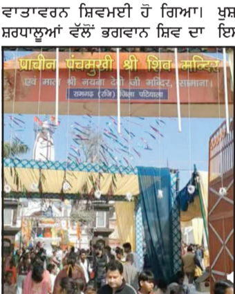
ਸਮਾਣਾ ਵਿਖੇ ਸ਼ਿਵਰਾਤਰੀ ਦੇ ਪਾਵਨ ਅਤੇ ਧਾਰਮਿਕ ਮਹੱਤਵ ਵਾਲੇ ਤਿਉਹਾਰ ਮੌਕੇ ਅੱਜ ਸਮਾਣਾ ਸ਼ਹਿਰ ਦੇ ਪ੍ਰਸਿੱਧ ਪੰਚ ਮੁਖੀ ਮੰਦਰ ਵਿਖੇ ਵੱਡੇ ਭਗਵਾਨ ਭੋਲੇ ਨਾਥ ਦੇ ਦਰਸ਼ਨਾਂ ਲਈ ਵਿਸ਼ਾਲ ਭੀੜ ਉਮਝ ਪਈ।

ਸਮਾਣਾ, 15 ਫਰਵਰੀ (ਅਮਿਤ ਸ਼ਰਮਾ) : ਸ਼ਿਵਰਾਤਰੀ ਦੇ ਪਾਵਨ ਅਤੇ ਧਾਰਮਿਕ ਮਹੱਤਵ ਵਾਲੇ ਤਿਉਹਾਰ ਮੌਕੇ ਅੱਜ ਸਮਾਣਾ ਸ਼ਹਿਰ ਦੇ ਪ੍ਰਸਿੱਧ ਪੰਚ ਮੁਖੀ ਮੰਦਰ ਵਿਖੇ ਵੱਡੇ ਭਗਵਾਨ ਭੋਲੇ ਨਾਥ ਦੇ ਦਰਸ਼ਨਾਂ ਲਈ ਵਿਸ਼ਾਲ ਭੀੜ ਉਮਝ ਪਈ। ਸਵੇਰੇ ਤੜਕੇ ਤੋਂ ਹੀ ਸ਼ਰਧਾਲੂਆਂ ਦੀ ਆਮਦ ਸ਼ੁਰੂ ਹੋ ਗਈ ਸੀ ਅਤੇ ਦਿਨ ਚੜ੍ਹਦੇ-ਚੜ੍ਹਦੇ ਮੰਦਰ ਪ੍ਰਗਨ ਅਤੇ ਆਲੇ-ਦੁਆਲੇ ਦੀਆਂ ਗਲੀਆਂ ਭਗਤਾਂ ਨਾਲ ਭਰ ਗਈਆਂ। ਲੋਕ ਲੰਮੀਆਂ-ਲੰਮੀਆਂ ਕਤਾਰਾਂ ਵਿੱਚ ਖੜ੍ਹ ਕੇ ਬੜੀ ਸ਼ਰਧਾ, ਭਾਵਨਾ ਅਤੇ ਉਤਸ਼ਾਹ ਨਾਲ ਭਗਵਾਨ ਭੋਲੇ ਨਾਥ ਦੇ ਦਰਸ਼ਨ ਕਰਦੇ ਨਜ਼ਰ ਆਏ। ਮੰਦਰ ਅੰਦਰ ਭਗਤਾਂ ਦਾ ਮਾਹੌਲ ਬਣਿਆ ਰਿਹਾ ਅਤੇ ਹਰ ਹਰ ਮਹਾਦੇਵ ਦੇ ਗੁੰਜੇ ਦੇ ਜੈਕਾਰਿਆਂ ਨਾਲ ਸਾਰਾ