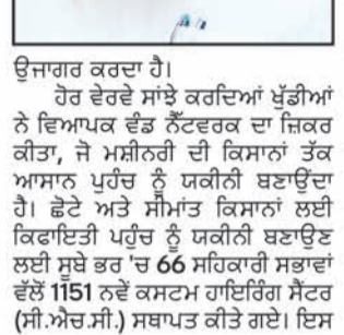
ਉਜਾਗਰ ਕਰਦਾ ਹੈ।

ਖੇਤੀਬਾੜੀ ਮੰਤਰੀ ਨੇ ਕਿਸਾਨ ਭਾਈਚਾਰੇ ਨੂੰ ਅਪੀਲ ਕੀਤੀ ਕਿ ਉਹ ਇਨ੍ਹਾਂ ਉਪਕਰਣਾਂ ਦੀ ਵੱਧ ਤੋਂ ਵੱਧ ਵਰਤੋਂ ਕਰਨ ਤੇ ਪਹਾਲੀ ਦੇ ਸੁਚੱਜੇ ਪ੍ਰਬੰਧਨ ਨੂੰ ਯਕੀਨੀ ਬਣਾਉਣ ਲਈ ਸਬਸਿਡੀ ਵੱਲੋਂ ਪਹਾਲੀ ਲਈ ਮਜ਼ਬੂਤ ਮਾਰਕੀਟ ਯਕੀਨੀ ਬਣਾਉਣ ਵੱਲ ਸਾਰੇ ਹੱਲ ਪ੍ਰਦਾਨ ਕੀਤੇ ਜਾ ਰਹੇ ਹਨ।