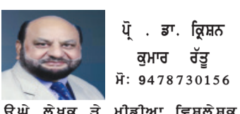
ਉਘੈ ਲੇਖਕ ਤੇ ਮੀਡੀਆ ਵਿਸ਼ਲੇਸ਼ਕ

ਪੰਜਾਬ ਅੱਜ ਭਾਵੇਂ ਸੰਕਟਾਂ ਦੇ ਘੇਰੇ ਵਿੱਚ ਘਿਰਿਆ ਹੋਇਆ ਹੈ, ਪਰ ਇਸ ਧਰਤੀ ਦੀ ਰੂਹ ਅਜੇ ਵੀ ਜਿਉਂਦੀ ਹੈ। ਇਹ ਰੂਹ ਗੁਰੂ ਸਾਹਿਬਾਨਾਂ ਦੇ ਸੰਦੇਸ਼ ਵਿੱਚ ਸੂਰੀਆਂ ਦੀ ਬਾਣੀ ਵਿੱਚ, ਲੋਕ ਗੀਤਾਂ ਦੀ ਨੂੰ ਕਿਸ ਦੀ ਨਜ਼ਰ ਲੱਗੀ ਹੈ। ਆਓ, ਪੰਜਾਬ ਦੇ ਚੰਗੇ ਭਵਿੱਖ ਲਈ ਗੁਰੂ ਦੀ ਸ਼ਰਨ ਵਿੱਚ ਜਾਈਏ ਤੇ ਰਹਿਮਤਾਂ ਬਖਸ਼ਿਸ਼ਾਂ ਨਾਲ ਆਪਣੇ ਆਪ ਨੂੰ ਭਰ ਲਈਏ। ਪੰਜਾਬ ਅੱਜ ਇੱਕ ਅਜਿਹੇ ਸੰਕਟ ਵਿੱਚੋਂ ਗੁਜ਼ਰ ਰਿਹਾ ਹੈ, ਜਿਸ ਨੇ ਨਾ ਸਿਰਫ਼ ਆਰਥਿਕ ਤੇ ਸਮਾਜਿਕ ਢਾਂਚੇ ਨੂੰ ਹਿਲਾ ਦਿੱਤਾ ਹੈ, ਸਗੋਂ ਸਾਡੀ ਪਹਿਚਾਣ, ਸਭਿਆਚਾਰ ਅਤੇ ਅਸਲੀਅਤ ਨੂੰ ਵੀ ਡੁੱਬਾ ਜ਼ਖ਼ਮ ਪਹੁੰਚਾਇਆ ਹੈ। ਇਹ ਸੰਕਟ ਕੋਈ ਵੀ ਇੱਕ ਰੋਗ ਨਹੀਂ, ਸਗੋਂ ਬਹੁਤ ਸਾਰੇ ਜ਼ਹਿਰੀਲੇ ਤੌਰਾਂ ਦਾ ਸੰਯੋਜਨ ਹੈ ਜੋ ਸਾਡੇ ਸਮਾਜ ਦੀਆਂ ਨਾੜੀਆਂ ਵਿੱਚ ਵਹਿ ਰਿਹਾ ਹੈ। ਅੱਜ ਬੇਰੁਜ਼ਗਾਰੀ ਦੀ ਅੱਗ, ਕਿਸਾਨਾਂ ਦੀ ਬੇਬੱਸੀ, ਨੌਜਵਾਨਾਂ ਦਾ ਭਟਕਾਅ, ਨਸ਼ਿਆਂ ਦਾ ਸਾਇਆ, ਗੈਂਗਸਟਰੀ ਦੀ ਤਾਕਤ, ਸ਼ੜਕਾਂ 'ਤੇ ਰੋਜ਼ਾਨਾ ਹੋਣ ਵਾਲੀਆਂ ਮੌਤਾਂ, ਦਫ਼ਤਰੀ ਭ੍ਰਿਸ਼ਟਾਚਾਰ, ਰਾਜਨੀਤਿਕ ਪਾਰਟੀਆਂ ਦਾ ਘਟੀਆਪਣਾ ਅਤੇ ਬਿਨਾਂ ਏਜੰਡੇ ਦੀਆਂ ਟੂਣੇ-ਡੋਰਿਆਂ ਵਾਲੀ ਰਾਜਨੀਤੀ-ਇਹ ਸਭ ਮਿਲ ਕੇ ਪੰਜਾਬ ਨੂੰ ਇੱਕ ਅਜਿਹੇ ਅੰਧੇਰੇ ਵੱਲ ਖੱਕ ਰਹੇ ਹਨ, ਜਿੱਥੇ ਆਸ ਦੀ ਕਿਰਨ ਵੀ ਮੱਧਮ ਪੈ ਰਹੀ ਹੈ ਪਰ ਅਸੀਂ ਸਿੱਖਾਂ ਦੀ ਧਰਤੀ 'ਤੇ ਵੱਸਦੇ ਹਾਂ। ਅਸੀਂ ਉਸ ਪੰਜਾਬ ਦੇ ਵਾਸੀ ਹਾਂ ਜਿੱਥੇ ਗੁਰੂ ਨਾਨਕ ਪਾਤਸ਼ਾਹ ਨੇ ਮਾਨਵਤਾ ਦਾ ਪਾਠ ਪੜ੍ਹਾਇਆ, ਗੁਰੂ ਅਰਜਨ ਦੇਵ ਜੀ ਨੇ ਸਹਿਣਸ਼ੀਲਤਾ ਦੀ ਮਿਸਾਲ ਕਾਇਮ ਕੀਤੀ, ਗੁਰੂ ਹਰਗੋਬਿੰਦ ਸਾਹਿਬ ਨੇ ਮੀਰ-ਪੀਰੀ ਦਾ ਸੰਦੇਸ਼ ਦਿੱਤਾ ਅਤੇ ਗੁਰੂ ਰਾਮਦਾਸ ਜੀ ਨੇ ਅੰਮ੍ਰਿਤਸਰ ਸਾਹਿਬ ਵਰਗਾ ਸਰੋਵਰ ਖੋਦ ਕੇ ਸਰੋਤ ਦਾ ਭਲਾ ਸਿੱਖਾਇਆ। ਅੱਜ ਜਦੋਂ ਪੰਜਾਬ ਬਲ ਰਿਹਾ ਹੈ, ਤਾਂ ਸਾਨੂੰ ਉਸੇ ਗੁਰੂ ਰਾਮਦਾਸ ਦੀ ਸ਼ਰਨ ਵਿੱਚ ਜਾ ਕੇ ਅਰਦਾਸ ਕਰਨੀ ਚਾਹੀਦੀ ਹੈ-ਗੁਰ ਰਾਮਦਾਸ ਰਾਖਰੁ ਸਰਣਾਈ ॥ ਇਹ ਸ਼ਬਦ ਸੀ ਸਿਰਫ਼ ਇੱਕ ਅਰਦਾਸ ਹੈ, ਸਗੋਂ ਇੱਕ ਡੂੰਘੀ ਆਤਮਿਕ ਪੁਕਾਰ ਹੈ ਜੋ ਸਾਨੂੰ ਆਪਣੀਆਂ ਕਮਜ਼ੋਰੀਆਂ ਨੂੰ ਮੰਨਣ ਅਤੇ ਉੱਚੇ ਆਦਰਸ਼ਾਂ ਵੱਲ ਵਾਪਸ ਮੁੜਨ ਲਈ ਉੱਚੇ ਸੀ। ਭੱਟ ਕੀਤੀ ਜੀ ਨੇ ਇਸ ਸ਼ਬਦ ਵਿੱਚ ਆਪਣੀ ਨਿਮਾਣਤਾ