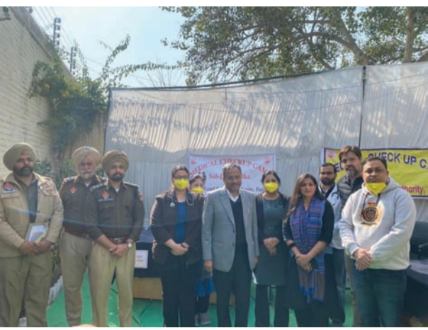
ਚੈਕਅਪ ਕੀਤਾ ਗਿਆ, ਜਿਸ ਵਿੱਚ ਬਲੱਡ ਪ੍ਰੈਸ਼ਰ, ਬੁਰਗ, ਤਾਪਮਾਨ, ਵਜ਼ਨ, ਟੀ.ਬੀ., ਦੰਦਾਂ, ਚਮੜੀ ਅਤੇ ਕੰਧੀ ਨਾਲ ਸੰਬੰਧਤ ਰੋਗਾਂ ਦੀ ਜਾਂਚ ਕੀਤੀ ਗਈ। ਮੈਡੀਕਲ ਅਫਸਰ ਮੁਫਤ ਦਵਾਈਆਂ ਵੀ ਮੁਹੱਈਆ ਕਰਵਾਈਆਂ ਗਈਆਂ ਅਤੇ ਗੰਭੀਰ