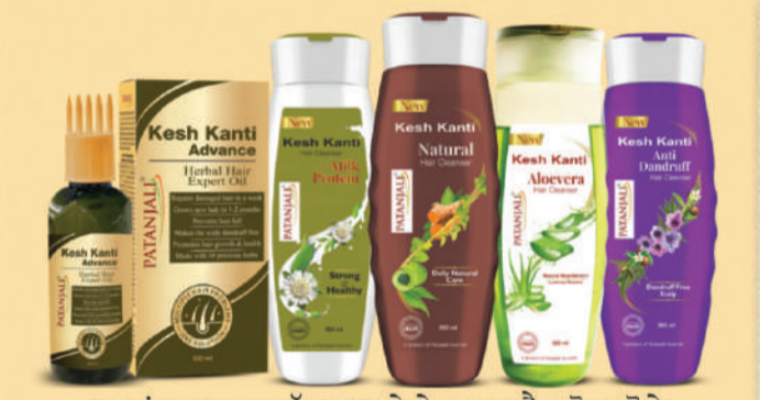
ਵਾਲਾਂ ਦਾ ਝੜਨਾ, ਟੁੱਟਣਾ ਅਤੇ ਬੇਵਕਤ ਸਫੈਦ ਹੋਣਾ ਰੋਕੋ ਪਤੰਜਲੀ ਕੇਸ਼ ਕਾਂਠੀ ਐਡਵਾਂਸ ਹੋਅਰ ਆਇਲ ਅਤੇ ਸ਼ੈਊ ਦੀ ਰੋਜ਼