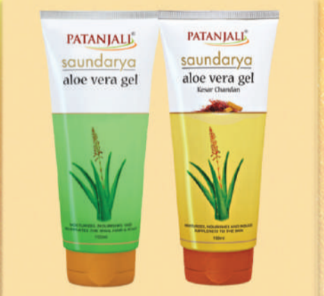
ਪਿੱਪਲ-ਰਿਕਲ ਮਿਟਾਓ, ਕੁਦਰਤੀ ਸੁੰਦਰਤਾ ਪਾਓ, ਪਤੰਜਲੀ ਐਲੋਵੇਰਾ ਜੈਲ ਅਪਣਾਓ