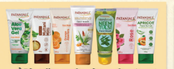
ਐਲੋਵੇਰਾ, ਨਿੱਮ, ਤੁਲਸੀ ਵਰਗੇ ਕੁਦਰਤੀ ਗੁਣਾਂ ਵਾਲਾ ਪਤੰਜਲੀ ਫੇਸਵਾਸ਼