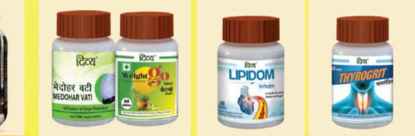
ਓਬੋਜਿਟੀ ਦੇ ਲਈ ਅਚੂਕ ਦਵਾਈ, ਕੋਲੋਸਟ੍ਰੋਲ ਦੇ ਲਈ, ਥਾਇਰਾਈਡ ਦੇ ਲਈ

ਡਾਕਟਰੀ ਸਲਾਹ ਦੇ ਲਈ ਆਪਣੇ ਨਜ਼ਦੀਕੀ ਪਤੰਜਲੀ ਹਸਪਤਾਲ 'ਤੇ ਜ਼ਰੂਰ ਵਿਜ਼ਟ ਕਰੋ। 5000 ਪਤੰਜਲੀ ਦੇ ਵਿਸ਼ੇਸ਼ ਸਟੋਰਾਂ ਦੇ ਸਥਾਨ ਦਾ ਪਤਾ ਜਾਣਨ ਲਈ ਗੂਗਲ 'ਤੇ ਸਰਚ ਕਰੋ। ਇੱਕ ਕਾਲ ਨਾਲ ਸਾਰੀਆਂ ਸਮੱਸਿਆਵਾਂ ਨੂੰ ਘਰ ਬੈਠੇ ਮੁਫਤ ਹਲ ਕਰਨ ਦੇ ਲਈ ਕਾਲ ਕਰੋ -1800 296 1111 ਅਤੇ ਪਤੰਜਲੀ ਦੀਆਂ ਸਮੂਹ ਸੇਵਾਵਾਂ ਦੀ ਜਾਣਕਾਰੀ ਦੇ ਲਈ 8954 555 999 'ਤੇ ਕਾਲ ਕਰੋ ਘਰ ਬੈਠੇ ਪਤੰਜਲੀ ਪ੍ਰੋਡਕਟਸ ਆਨਲਾਈਨ ਆਰਡਰ ਕਰਨ ਦੇ ਲਈ ਆਰਡਰ ਮੀ ਐਪ ਡਾਊਨਲੋਡ ਕਰੋ।