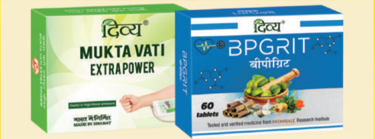
ਹਾਈ ਬੀ. ਪੀ. ਨੂੰ ਕੁਦਰਤੀ ਰੂਪ ਤੋਂ ਨਿਰਮੂਲ ਕਰਨ ਦੇ ਲਈ।

ਅਰਥ ਤੋਂ ਪਰਮਾਰਥ ਅਤੇ ਰਾਸ਼ਟਰ ਸੇਵਾ (Prosperity for Charity): PFL ਨੂੰ ਪ੍ਰਾਪਤ ਹੋਣ ਵਾਲਾ ਪੂਰਾ ਲਾਭ ਪਤੰਜਲੀ ਗੁਰੂਕੁਲਮ, ਭਾਰਤੀ ਸਿੱਖਿਆ ਬੋਰਡ ਆਚਾਰੀਆਕੁਲਮ, ਪਤੰਜਲੀ ਯੂਨੀਵਰਸਿਟੀ, ਖੋਜ ਫਾਊਂਡੇਸ਼ਨ, ਇਲਾਜ, ਸਿੱਖਿਆ, ਰੁੱਖ ਲਗਾਉਣ, ਸਨਾਤਨ ਧਰਮ ਅਤੇ ਭਾਰਤ ਮਾਤਾ ਦੀ ਸੇਵਾ ਨੂੰ ਪੂਰੀ ਤਰ੍ਹਾਂ ਸਮਰਪਿਤ ਕੀਤਾ ਜਾਂਦਾ ਹੈ। ਇਸ ਤਰ੍ਹਾਂ, ਲਾਭ ਦਾ 100% ਭਾਗ ਨਿਰਸਵਾਰਥ ਦਾਨ ਅਤੇ ਰਾਸ਼ਟਰ ਸੇਵਾ ਦੇ ਕੰਮਾਂ ਵਿੱਚ ਲਗਾਇਆ ਜਾਂਦਾ ਹੈ। ਪੂਜਨੀਕ ਸਵਾਮੀ ਰਾਮਦੇਵ ਜੀ ਦਾ ਸੈਕਲਪ ਹੈ ਕਿ ਆਪਣੇ ਆਖਰੀ ਸਾਹ ਤੱਕ, ਅਸੀਂ ਸ਼ੁੱਧਤਾ ਅਤੇ ਪ੍ਰਮਾਣਿਕਤਾ ਨਾਲ ਭਾਰਤ ਮਾਤਾ ਦੀ ਸੇਵਾ ਕਰਦੇ ਰਹਾਂਗੇ ਅਤੇ ਇੱਕ ਸਿਹਤਮੰਦ, ਖੁਸ਼ਹਾਲ ਅਤੇ ਸ਼ਾਨਦਾਰ ਭਾਰਤ ਦੀ ਸਿਰਜਣਾ ਵਿੱਚ ਯੋਗਦਾਨ ਪਾਵਾਂਗੇ। ਪੂਜਨੀਕ ਆਰੀਆ ਬਾਲਕ੍ਰਿਸ਼ਨ ਜੀ ਨੂੰ ਕਈ ਸਾਲਾਂ ਤੋਂ ਦੁਨੀਆ ਭਰ ਦੇ ਚੋਟੀ ਦੇ 2% ਵਿਗਿਆਨੀਆਂ ਅਤੇ ਖੋਜਕਾਰੀਆਂ ਦੀ ਸ਼੍ਰੇਣੀ ਵਿੱਚ ਸ਼ਾਮਲ ਹਨ। ਉਨ੍ਹਾਂ ਦੇ ਦ੍ਰਿੜਟੀਕੋਣ ਨਾਲ ਪਤੰਜਲੀ ਵਿਗਿਆਨ, ਖੋਜ ਅਤੇ ਸਵਦੇਸ਼ੀ ਨਵੀਨਤਾ ਦੇ ਮਾਧਿਅਮ ਨਾਲ ਆਲਮੀ ਨਕਸ਼ੇ 'ਤੇ ਮੋਹਰੀ ਬ੍ਰਾਂਡ ਬਣ ਰਿਹਾ ਹੈ। ਯੋਗ, ਆਯੁਰਵੇਦ, ਸਵਦੇਸ਼ੀ, ਸਨਾਤਨ ਧਰਮ ਦੀ ਸੇਵਾ ਵਿੱਚ ਅੱਜ ਪਤੰਜਲੀ ਭਾਰਤ ਦੀ ਸਰਵੋਤਮ ਸੰਸਥਾ ਦੇ ਰੂਪ ਵਿੱਚ ਕਾਰਜਸ਼ੀਲ ਹੈ।