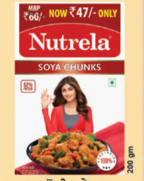
52% ਪ੍ਰੋਟੀਨ ਦੇ ਨਾਲ ਨਿਊਟ੍ਰੇਲਾ ਸੋਇਆ ਚੰਕਸ