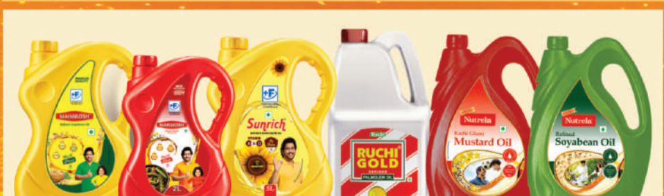
ਮਹਾਕੋਸ਼, ਸਨਰਿਚ, ਤੁਚੀ ਗੋਲਡ, ਦੇਸ਼ ਦਾ ਨੰਬਰ 1 ਪਾਮ ਆਇਲ ਬ੍ਰਾਂਡ ਅਤੇ ਨਿਊਟ੍ਰੀਲਾ ਆਇਲ ਰੋਜ਼