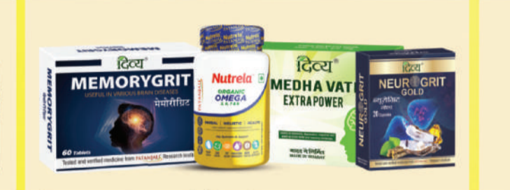
ਬ੍ਰੇਨ, ਨਰਵਸ ਸਿਸਟਮ ਅਤੇ ਮੈਮੋਰੀ ਦੇ ਲਈ ਸਰਵੋਤਮ ਦਵਾਈਆਂ