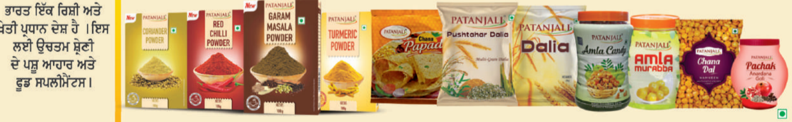
ਪਤੰਜਲੀ ਮਸਾਲੇ, ਪਾਪੜ, ਦਲੀਆ, ਕੈਂਡੀ, ਮੁੱਠਾ, ਨਮਕੀਨ ਅਤੇ ਪਾਚਕ