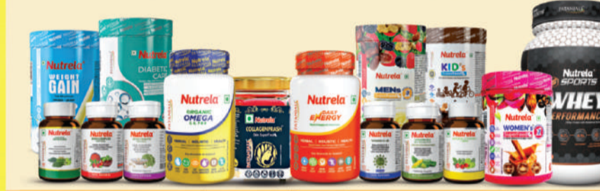
ਬਾਈਕਾਟ ਕਰੋ - ਕੋਮੀਕਲ ਅਤੇ ਐਨੀਮਲ ਬੇਸਡ ਪ੍ਰੋਡਕਟਸ ਦਾ ਅਤੇ ਨਿਊਟ੍ਰੀਲਾ ਨੈਚੁਰਲ ਆਰਗੈਨੋਟਿਕ ਪ੍ਰੋਟੀਨ, ਵਿਟਾਮਿਨਜ਼, ਓਮੀਗਾ ਆਦਿ ਅਪਣਾਓ।