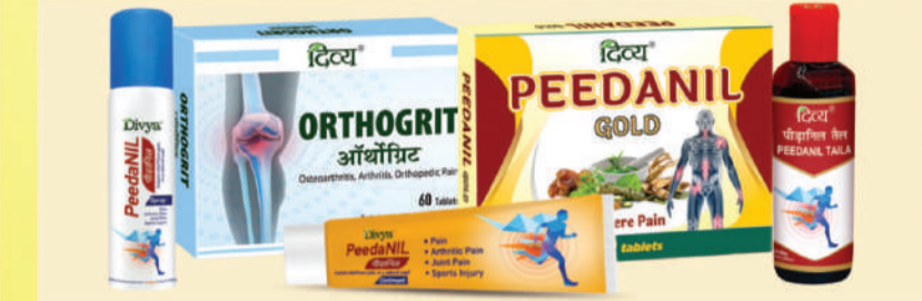
ਵਾਤ ਰੋਗ, ਆਰਥਰਾਈਟਿਸ, RA, CRP, AVN, ANA, HLA-B27 ਆਦਿ ਦੇ ਲਈ