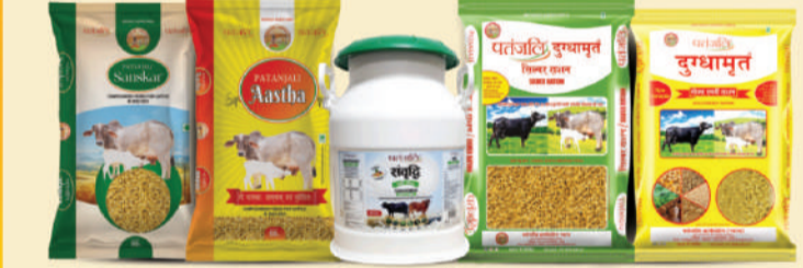
ਪਤੰਜਲੀ ਪਸ਼ੂ ਆਹਾਰ

ਲਗਭਗ 1 ਕਰੋੜ ਸਟੋਰਜ਼ 'ਤੇ ਪਤੰਜਲੀ ਦੇ ਪ੍ਰੋਡਕਟਸ ਉਪਲਬਧ ਹਨ। ਫਿਰ ਵੀ ਕੋਈ ਪ੍ਰੋਡਕਟਸ ਸਟੋਰ 'ਤੇ ਉਪਲਬਧ ਨਹੀਂ ਹੈ ਤਾਂ ਤੁਸੀਂ ਦੁਕਾਨਦਾਰਾਂ ਤੋਂ ਇਸਦੀ ਡਿਮਾਂਡ ਕਰੋ, ਉਹ ਇਸ ਨੂੰ ਉਪਲਬਧ ਕਰਵਾਉਣਗੇ।