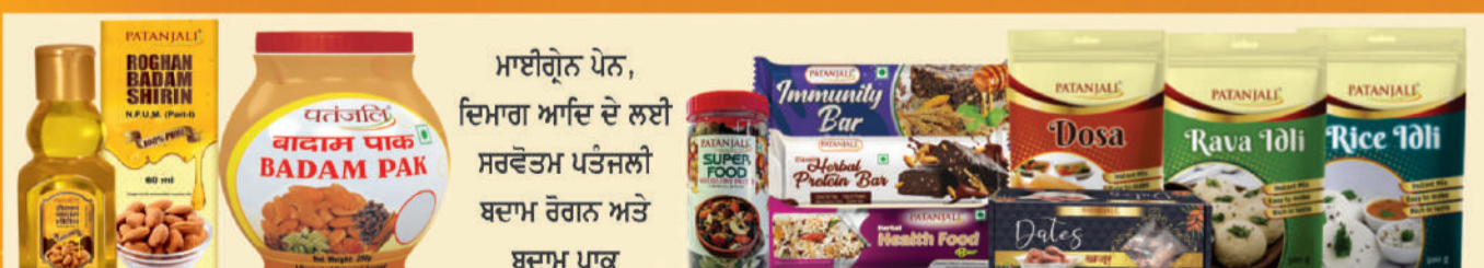
ਮਾਈਗ੍ਰੇਨ ਪੇਨ, ਦਿਮਾਗ ਆਦਿ ਦੇ ਲਈ ਸਰਵੋਤਮ ਪਤੰਜਲੀ ਬਦਾਮ ਰੋਗਨ ਅਤੇ ਬਦਾਮ ਪਾਕ, ਐਨਰਜੀ ਬਾਰ ਅਤੇ ਇਸਟੈਟ ਮਿਕਸ