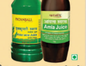
ਗੈਸ, ਕਬਜ਼, ਪਾਚਨ, ਚਮੜੀ ਅਤੇ ਵਾਲਾਂ ਦੇ ਲਈ ਨਾਭਕਾਰੀ