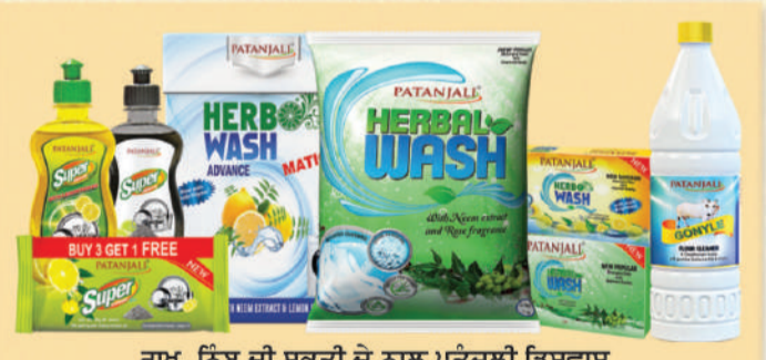
ਰਾਖ, ਨਿੱਬੂ ਦੀ ਸ਼ਕਤੀ ਦੇ ਨਾਲ ਪਤੰਜਲੀ ਡਿਸ਼ਵਾਸ਼ ਨਿੱਮ ਦੇ ਗੁਣ ਦੇ ਨਾਲ ਪਤੰਜਲੀ ਡਿਟਰਜੈਂਟ ਅਤੇ ਪਵਿੱਤਰ ਗੋਮੂਤਰ ਤੋਂ ਬਣਿਆ ਗੌਨਾਇਲ