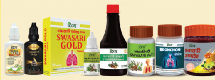
ਬੁੱਕਾਈਟਿਸ, ਅਸਥਮਾ, ਕਫ਼, ਕੋਲਡ ਦੇ ਲਈ ਰਿਸਰਚ ਅਤੇ ਐਵੀਡੈਂਸ ਬੇਸਡ ਮੈਡੀਸਨ