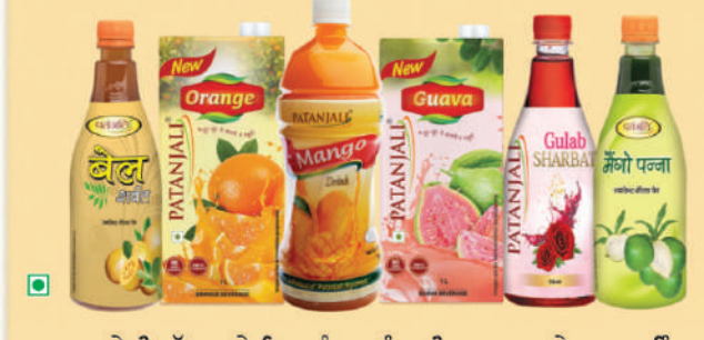
100% ਸਵਦੇਸ਼ੀ, ਚੁੱਧ ਅਤੇ ਸਿਹਤਮੰਦ ਪਤੰਜਲੀ ਸ਼ਰਬਤ ਅਤੇ ਫਰੂਟ ਡਰਿੰਕਸ