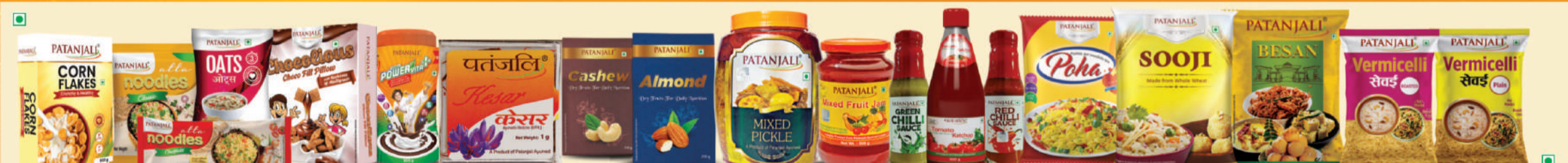
ਪਤੰਜਲੀ ਹੈਲਦੀ ਅਤੇ ਨਿਊਟ੍ਰੀਸ਼ੀਅਸ ਫੂਡ ਪ੍ਰੋਡਕਟਸ, ਪਾਵਰ ਵੀਟਾ, ਕੇਸਰ ਅਤੇ ਡਰਾਈਫਰੂਟਸ, ਅਚਾਰ, ਜੈਮ ਅਤੇ ਸੌਸ, ਪੌਰਾ, ਸੂਜੀ, ਵੇਸਣ, ਸੇਵੀਆਂ,