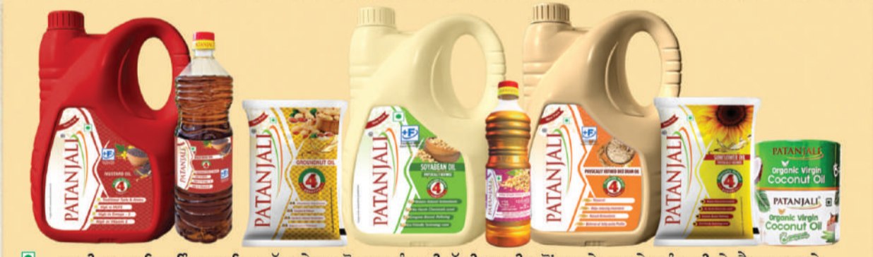
ਹਾਨੀਕਾਰਕ ਰਿਵਾਇਤ ਆਇਲ ਛੱਡ ਕੇ ਸਰਵੋਤਮ ਪਤੰਜਲੀ ਕੱਚੀ ਘਾਣੀ ਸਰ੍ਹੋਂ ਦਾ ਤੇਲ ਅਤੇ ਪਤੰਜਲੀ ਦੇ ਨੈਚੁਰਲ ਅਤੇ ਵਿਜ਼ੀਕਲੀ ਰਿਵਾਇਤ ਆਇਲ ਹੀ ਘਰ ਲਿਆਓ। ਆਪਣੇ ਪਰਿਵਾਰ ਨੂੰ ਮਿਲਾਵਟ ਦੇ ਜ਼ਹਿਰ ਤੋਂ ਬਚਾਓ।