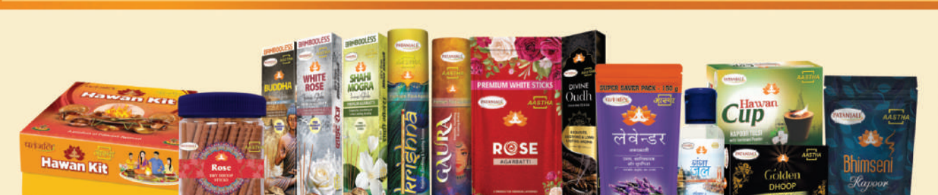
ਫੂਡ-ਅਗਰਬੱਤੀ ਦੇ ਨਾਮ 'ਤੇ ਬਹੁਤ ਡਿਮਾਂਡ ਮਿਲਾਵਟ ਹੈ ਅਤੇ 100% ਪਵਿੱਤਰ ਬਾਂਸ ਰਹਿਤ ਅਗਰਬੱਤੀ, ਭੀਮਸੇਨੀ ਕਪੂਰ, ਸ਼ੁੱਧ ਤਿਲਾਂ ਦਾ ਤੇਲ, ਹਵਨ ਸਮੱਗਰੀ ਆਦਿ ਨਾਲ ਆਪਣੇ ਇਸ਼ਟ ਦੀ ਪੂਜਾ ਕਰੋ।