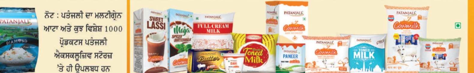
ਦਿੱਲੀ ਐਨਸੀਐਚ, ਉਤਰਾਖੰਡ, ਰਾਜਸਥਾਨ ਅਤੇ ਮਹਾਰਾਸ਼ਟਰ ਵਿਚ ਪਤੰਜਲੀ ਦੇ ਡੇਅਰੀ ਪ੍ਰੋਡਕਟਸ ਉਪਲਬਧ ਹਨ