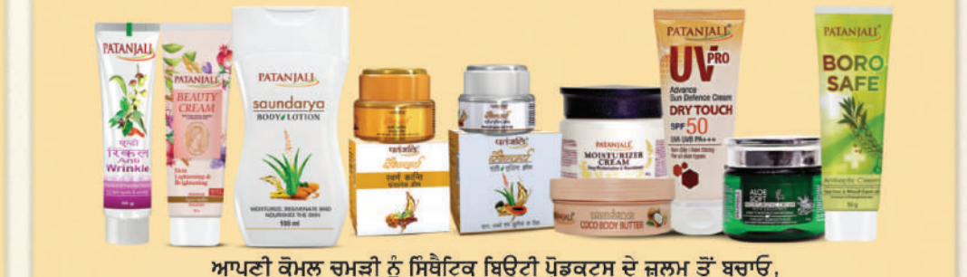
ਆਪਣੀ ਕੌਮਲ ਚਮੜੀ ਨੂੰ ਸਿਥੈਟਿਕ ਬਿਊਟੀ ਪ੍ਰੋਡਕਟਸ ਦੇ ਜ਼ੁਲਮ ਤੋਂ ਬਚਾਓ, ਪਤੰਜਲੀ ਨਾਲ ਨੈਚੁਰਲ ਬਿਊਟੀ ਪਾਓ