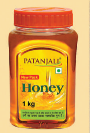
100 ਤੋਂ ਜ਼ਿਆਦਾ ਪੈਰਾਮੀਟਰਜ਼ 'ਤੇ ਖਰਾ ਸਰਵੋਤਮ ਪਤੰਜਲੀ ਹਨੀ