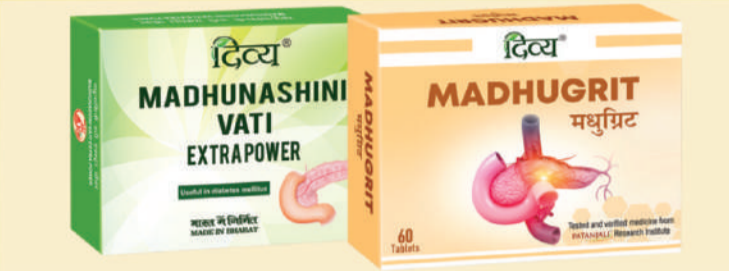
ਡਾਇਬਟੀਜ਼ ਨੂੰ ਰਿਵਰਸ ਕਰਨ ਵਿੱਚ ਲਾਭਕਾਰੀ