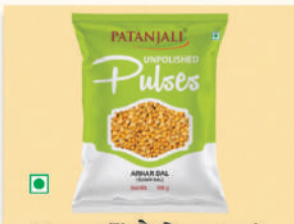
ਅਰਧਰ ਤੋਂ ਲੈ ਕੇ ਹਰ ਤਰ੍ਹਾਂ ਦੀਆਂ ਨੈਚੁਰਲ ਦਾਲਾਂ