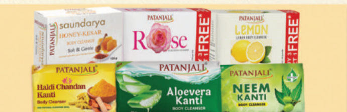
ਹਲਦੀ, ਚੰਦਨ, ਐਲੋਵੇਰਾ, ਨਿੱਮ, ਕੇਸਰ ਵਰਗੇ ਕੁਦਰਤੀ ਗੁਣਾਂ ਦੇ ਨਾਲ