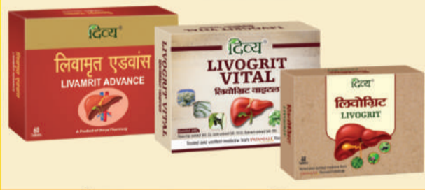
ਫੈਟੀ ਲਿਵਰ, ਲਿਵਰ ਸਿਰੋਸਿਸ, ਹੋਪੈਟਾਈਟਿਸ ਆਦਿ ਨੂੰ ਰਿਵਰਸ ਕਰਨ ਦੇ ਲਈ