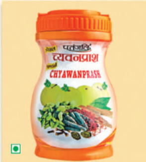
500 ਤੋਂ ਵੱਧ ਦਵਾ ਤੱਤਾਂ ਦੇ ਨਾਲ ਪਤੰਜਲੀ ਚਯਵਨਪ੍ਰਾਸ਼