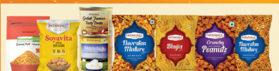
ਮਠਿਆਈਆਂ ਅਤੇ ਸਨੈਕਸ