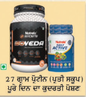
27 ਗ੍ਰਾਮ ਪ੍ਰੋਟੀਨ (ਪ੍ਰਤੀ ਸਰੂਪ) ਪੂਰੇ ਦਿਨ ਦਾ ਕੁਦਰਤੀ ਪੌਸ਼ਟ