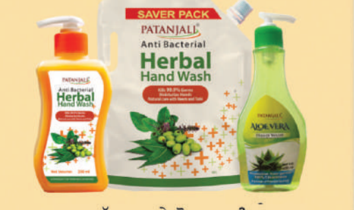
ਸਵੱਛਤਾ ਅਤੇ ਕੌਮਲਤਾ ਵੀ