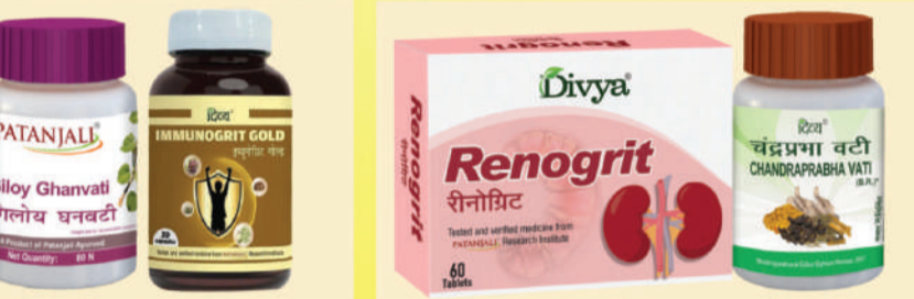
ਇਮਿਊਨਿਟੀ ਦੇ ਲਈ ਸਰਵੋਤਮ ਦਵਾਈਆਂ ਕਿਡਨੀ ਪ੍ਰਾਬਲਮਜ਼ ਨੂੰ ਰਿਵਰਸ ਕਰਨ ਦੇ ਲਈ