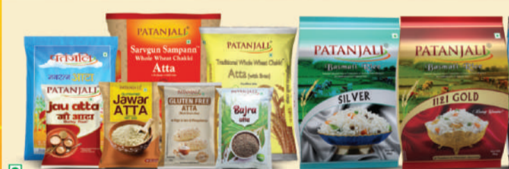
ਪਤੰਜਲੀ ਦੇ ਆਟਾ ਰੋਜ਼ ਅਤੇ ਪਤੰਜਲੀ ਚਾਵਲ ਰੋਜ਼