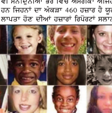
ਇਹ ਚਿੱਤਰਾਂ ਵਿੱਚ ਇਟਲੀ ਵਿੱਚ ਗੁਆਚੇ ਬੱਚਿਆਂ ਦੇ ਚਿੱਤਰਾਂ ਦਾ ਸਮੂਹ ਦਿਖਾਇਆ ਗਿਆ ਹੈ, ਜਿਨ੍ਹਾਂ ਵਿੱਚੋਂ ਬਹੁਤੇ ਵਿਦੇਸ਼ੀ ਅਤੇ ਅੰਧਰੇ ਰੰਗ ਦੀਆਂ ਬੱਚੀਆਂ ਸ਼ਾਮਲ ਹਨ।

ਵੀ ਸਨ। ਦੁਨੀਆਂ ਭਰ ਵਿੱਚ ਅਮਰੀਕਾ ਅਜਿਹਾ ਦੇਸ਼ ਹੈ ਜਿੱਥੇ ਸਭ ਤੋਂ ਵੱਧ ਬੱਚੇ ਲਾਪਤਾ ਹੁੰਦੇ ਹਨ ਜਿਹਨਾਂ ਦਾ ਅੰਕੜਾ 460 ਹਜ਼ਾਰ ਹੈ ਯੂਰਪ ਵਿੱਚੋਂ ਜਰਮਨ ਵਿੱਚ ਵੀ ਮਾਮੂਮ ਬੱਚਿਆਂ ਦੇ ਲਾਪਤਾ ਹੋਣ ਦੀਆਂ ਹਜ਼ਾਰਾਂ ਹਿੱਸਰਾਂ ਸਲਾਨਾ ਦਰਜ ਹੁੰਦੀਆਂ ਹਨ। ਸਪੇਨ ਵਿੱਚ ਹਰ ਸਾਲ ਲਗਭਗ 20 ਹਜ਼ਾਰ ਬੱਚੇ ਲਾਪਤਾ ਹੁੰਦੇ ਹਨ ਜਦੋਂ ਕਿ ਕੇਨੇਡਾ ਵਿੱਚ ਹਰ ਸਾਲ 45,288 ਬੱਚੇ ਲਾਪਤਾ ਹੁੰਦੇ ਹਨ। ਇਟਲੀ ਵਿੱਚ ਇਹਨਾਂ ਦਿਨਾਂ ਵਿੱਚ ਬੱਚਿਆਂ ਨੂੰ ਅਗਵਾ ਕਰਨ ਦੀਆਂ ਵਰਦਾਤਾਂ ਵਿੱਚ ਵੀ ਵੱਧ ਰਹੀਆਂ ਹਨ ਜਿਹਨਾਂ ਵਿੱਚ ਲੰਬਾਰਦੀਆਂ ਅਤੇ ਕੰਪਾਨੀਆਂ ਸੂਬੇ ਵਿੱਚ ਬੱਚਿਆਂ ਨੂੰ ਅਗਵਾ ਕਰਨ ਦੀਆਂ 2 ਘਟਨਾਵਾਂ ਵਿੱਚ ਅਗਵਾਕਰਨਾਂ ਨੂੰ ਪੁਲਸ ਨੇ ਗ੍ਰਿਫਤਾਰ ਕਰ ਲਿਆ ਜਦੋਂ ਕਿ ਲਾਸੀਓ ਸੂਬੇ ਦੇ ਜਿਲ੍ਹਾ ਲਾਤੀਨਾ ਵਿੱਚ ਅਜਿਹੀਆਂ ਖਬਰਾਂ ਨਾਲ ਪੂਰੇ ਇਟਲਾਕੇ ਵਿੱਚ ਮਾਧਿਅਮ ਵਿੱਚ ਚਰਚਾ ਦਰ ਮਾਮਲੇ ਦੇਖਿਆ ਜਾ ਰਿਹਾ ਹੈ। ਇਸ ਖ਼ਬਰ ਦੇ ਮਾਧਿਅਮ ਨਾਲ ਅਸੀਂ ਇਟਲੀ ਦੇ ਸਮੁੱਚੇ ਭਾਰਤੀ ਭਾਈਚਾਰੇ ਨੂੰ ਸੁਚੇਤ ਕਰਦੇ ਹਾਂ ਕਿ ਉਹ ਆਪਣੇ ਬੱਚਿਆਂ ਦਾ ਪੂਰਾ ਧਿਆਨ ਕੇਂਦਰ ਤੋਂ ਜਾਂ ਕੋਈ ਅਣਸੁਖਾਵੇਂ ਘਟਨਾ ਤੋਂ ਬਚਿਆ ਜਾ ਸਕੇ।