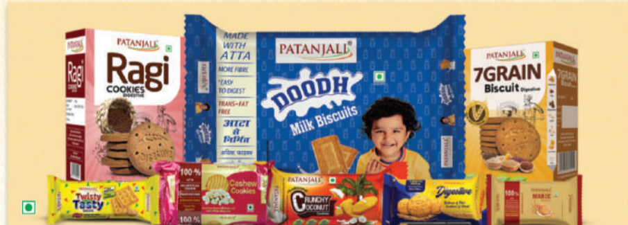
0% ਮੈਦਾ, 0% ਕੋਲੈਸਟ੍ਰੋਲ, ਪੌਸ਼ਟਿਕ ਤੰਤਾਂ ਨਾਲ ਭਰਪੂਰ ਪਤੰਜਲੀ ਬਿਸਕਿਟਸ