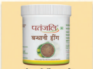
ਬੰਧਾਨੀ ਹਿਗ ਅਤੇ 100% ਚੁੱਧ ਪਤੰਜਲੀ ਮਸਾਲੇ