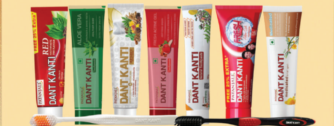
ਝੂਠਪੇਸਟ ਤੋਂ ਬਚੋ, ਮੁੱਚਾ ਟੂਥਪੇਸਟ ਦੰਤ ਕਾਂਠੀ ਹੀ ਅਪਣਾਓ। ਪਾਇਰੀਆ, ਦੰਦਾਂ ਦਾ ਪੀਲਾਪਣ, ਬਦਬੂ ਦਰਦ ਆਦਿ ਤੋਂ ਮੁਕਤੀ ਪਾਓ