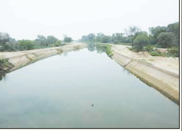
ਇੱਕ ਹੋਰ ਰਾਜਸਥਾਨ ਦੇ 29 ਲੱਖ ਏਕੜ ਤੋਂ ਵੱਧ ਦੇ ਫਲਦੀਲੇ ਸਿੱਚਾਈ ਦਾ ਸਾਧਨ ਹੈ ਅਤੇ ਦੋ ਕਰੋੜ ਤੋਂ ਵੱਧ ਲੋਕ ਇਸ ਦਾ ਪਾਣੀ ਪੀਂਦੇ ਹਨ।

ਚੰਡੀਗੜ੍ਹ, 31 ਮਾਰਚ (ਚ.ਨ.ਸ.): ਦੇਸ਼ ਦੇ ਤਿੰਨ ਸੂਬਿਆਂ ਵਿੱਚੋਂ ਗੁਜਰਾਤੀ ਰਾਜਸਥਾਨ ਫੀਡਰ ਨੂੰ ਭਾਰਤ ਸਰਕਾਰ ਵੱਲੋਂ 65 ਸਾਲਾਂ ਬਾਅਦ ਨਵਾਂ ਸਰੂਪ ਦੇਣ ਦਾ ਪ੍ਰਾਜੈਕਟ ਫਰੀਦਕੋਟ ਵਿੱਚ ਸ਼ੁਰੂ ਕਰ ਦਿੱਤਾ ਗਿਆ ਹੈ। ਇਹ ਪ੍ਰਾਜੈਕਟ ਨਹਿਰੀ ਵਿਭਾਗ ਨੇ 45 ਦਿਨਾਂ ਵਿੱਚ ਮੁਕੰਮਲ ਕਰਨਾ ਹੈ ਜਿਸ ਉੱਪਰ 300 ਕਰੋੜ ਰੁਪਏ ਖਰਚੇ ਜਾਣੇ ਹਨ ਬਾਕੀ ਜ਼ਿਲ੍ਹਿਆਂ ਵਿੱਚ ਇਹ ਪ੍ਰਾਜੈਕਟ ਪਹਿਲਾਂ ਮੁਕੰਮਲ ਹੋ ਚੁੱਕਾ ਹੈ ਅਤੇ ਇਕੱਲੇ ਫਰੀਦਕੋਟ ਜ਼ਿਲ੍ਹੇ ਵਿੱਚ ਇਹ ਪ੍ਰਾਜੈਕਟ ਅਧੂਰਾ ਪਿਆ ਸੀ। ਹਰੀਕੇ ਪੱਤਣ ਤੋਂ ਲੈ ਕੇ ਜੈਸਲਮੇਰ ਤੱਕ ਰਾਜਸਥਾਨ ਫੀਡਰ ਕੁੱਲ 837 ਕਿਲੋਮੀਟਰ ਦਾ ਲੰਬਾ ਸਫਰ ਤੈਅ ਕਰਦੀ ਹੈ। ਰਾਜਸਥਾਨ ਫੀਡਰ ਦੀ 18 ਹਜ਼ਾਰ ਕਿਊਮੀਟਰ ਤੋਂ ਵੱਧ ਪਾਣੀ ਦੀ ਸਮਰੱਥਾ ਹੈ। ਇਲਾਕੇ ਵਿੱਚ ਖਾਣੇ ਪਾਣੀ ਦੀ ਸਮੱਸਿਆ ਨੂੰ ਦੇਖਦਿਆਂ ਭਾਰਤ ਸਰਕਾਰ ਨੇ ਰਾਜਸਥਾਨ ਫੀਡਰ ਦੇ ਤਲ ਦਿੱਟਾਂ ਨਾਲ ਬਣਾਉਣ ਦਾ ਫੈਸਲਾ ਕੀਤਾ ਹੈ ਤਾਂ ਕਿ ਇੱਥੋਂ ਨਹਿਰੀ ਪਾਣੀ ਰਿਸਦਾ ਰਹੇ ਅਤੇ ਆਸ ਪਾਸ ਦਾ ਪਾਣੀ ਮਿੱਠਾ ਜਾਵੇ। ਜਦੋਂ ਕਿ ਨਹਿਰ ਦੇ ਕਿਨਾਰੇ ਮੁਕੰਮਲ ਤੌਰ 'ਤੇ ਕੰਕਰੀਟ ਦੇ ਬਣਾਏ ਜਾਣੇ ਹਨ। ਇਸ ਤੋਂ ਪਹਿਲਾਂ ਕੇਂਦਰ ਸਰਕਾਰ ਰਾਜਸਥਾਨ ਫੀਡਰ ਨਾਲ ਲੱਗਦੀ ਸਰਹੱਦ ਫੀਡਰ ਨੂੰ ਕੰਕਰੀਟ ਦਾ ਬਣਾ ਚੁੱਕੀ ਹੈ। ਰਾਜਸਥਾਨ ਫੀਡਰ ਨੂੰ 1984 ਵਿੱਚ ਦਿੱਤਾ ਗਿਆ ਸੀ ਕਿਨਾਲ ਦਾ ਨਾਮ ਦਿੱਤਾ ਗਿਆ ਸੀ। ਇਹ ਦੁਨੀਆਂ ਦੀਆਂ ਸਭ ਤੋਂ ਵੱਡੀਆਂ ਤੇ ਲੰਮੀਆਂ ਨਹਿਰਾਂ ਵਿੱਚੋਂ