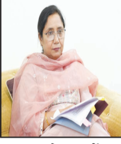
ਮੰਤਰੀ ਡਾ. ਬਲਜੀਤ ਕੌਰ