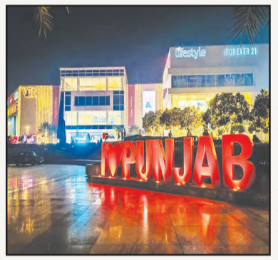
ਮੋਹਾਲੀ ਦਾ ਦਿਲ ਬਣੇਗਾ ਸੈਕਟਰ-87