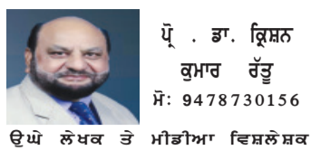
ਉੱਘੇ ਲੇਖਕ ਤੇ ਮੀਡੀਆ ਵਿਸ਼ਲੇਸ਼ਕ

ਅੱਜ ਰਾਸ਼ਟਰਵਾਦ ਅਤੇ ਨਵੇਂ ਚੈਂਜਿੰਗ ਸਟਾਈਲ ਸ਼ੁਰੂ ਹੋ ਗਿਆ ਹੈ, ਜਿਸ ਨੂੰ ਭਾਰਤੀ ਯੁਵਕ ਅਤੇ ਵਿਦੇਸ਼ੀ ਡਾਇਸਪੋਰਾ ਵੀ ਬਹੁਤ ਪਸੰਦ ਕਰ ਰਿਹਾ ਹੈ ਅਤੇ ਇਹ ਫਿਲਮ ਜਗਤ ਦੇ ਹੁਣ ਸਾਰੇ ਰਿਕਾਰਡ ਤੋੜ ਰਿਹਾ ਹੈ। ਆਇੰਤਿਆ ਧਰ ਦੀ ਨਿਰਦੇਸ਼ਨ ਵਾਲੀ ਫਿਲਮ ਪੁਰੰਧਰ 2 (ਪੁਰੰਧਰ 2) ਨੇ ਮਾਰਚ 2026 ਵਿੱਚ ਰਿਲੀਜ਼ ਹੋ ਕੇ ਬਾਲੀਵੁੱਡ ਦੇ ਇਤਿਹਾਸ ਵਿੱਚ ਇੱਕ ਨਵੀਂ ਮਿਸਾਲ ਕਾਇਮ ਕੀਤੀ ਹੈ।