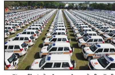
ਪੰਜਾਬ ਪੁਲਿਸ ਨੂੰ ਦਿੱਤੇ 508 ਕੁਇੱਕ ਰਿਸਪਾਂਸ ਵਾਹਨ