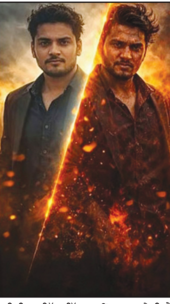
ਮੀਡੀਆ ਵਿੱਚ ਇੱਕ ਨਵੀਂ ਚਰਚਾ ਛੇੜੀ ਹੈ ਕਿ ਕੀ ਵੱਡੀਆਂ ਫਿਲਮਾਂ ਨੂੰ ਰਾਜਨੀਤਿਕ ਲੈਂਸ ਨਾਲ ਵੇਖਣਾ ਠੀਕ ਹੈ ਜਾਂ ਉਨ੍ਹਾਂ ਨੂੰ ਆਪਣੀ ਕਲਾਤਮਕਤਾ ਅਤੇ ਵਪਾਰੀ ਸਫਲਤਾ 'ਤੇ ਪੇਸ਼ ਕਰ ਰਿਹਾ ਹੈ, ਦੂਜੇ ਪਾਸੇ ਅੰਤਰਰਾਸ਼ਟਰੀ ਅਤੇ ਕੁਝ ਭਾਰਤੀ ਆਲੋਚਕ ਇਸਨੂੰ ਪ੍ਰਚਾਰ ਵਜੋਂ ਟੀਕਾ ਕਰ ਰਹੇ ਹਨ।

ਹੁਣ ਇਸ ਨੈਰੇਟਿਵ ਨੂੰ ਯੁਵਕ ਪਸੰਦ ਕਰ ਰਹੇ ਹਨ ਕਿਉਂਕਿ ਇਹ ਉਨ੍ਹਾਂ ਨੂੰ ਇੱਕ ਮਜ਼ਬੂਤ ਭਾਰਤ ਦੀ ਤਸਵੀਰ ਦਿਖਾਉਂਦਾ ਹੈ। ਇਸ ਨਾਲ ਫਿਲਮ ਮੀਡੀਆ ਵਿੱਚ ਵੀ ਬਦਲਾਅ ਆ ਰਿਹਾ ਹੈ - ਟ੍ਰੈਡੀਸ਼ਨਲ ਰਿਵਿਊਜ਼ ਤੋਂ ਇਲਾਵਾ ਰਾਜਨੀਤਿਕ ਅਤੇ ਸੋਸ਼ਲ ਡਿਸਕੋਰਸ ਵੀ ਮਹੱਤਵਪੂਰਨ ਹੋ ਗਏ ਹਨ। ਇਸ ਬਦਲਦੇ ਨੈਰੇਟਿਵ ਦੇ ਪੱਖ ਵੀ ਹਨ। ਇੱਕ ਪਾਸੇ ਇਹ ਭਾਰਤੀ ਯੁਵਕਾਂ ਵਿੱਚ ਰਾਸ਼ਟਰੀ ਏਕਤਾ ਅਤੇ ਗਰਵ ਵਧਾਉਂਦਾ ਹੈ, ਦੂਜੇ ਪਾਸੇ ਇਸਨੂੰ ਇੱਕ ਤਰਫ਼ ਤੋਂ ਪ੍ਰਚਾਰ ਵਧਾਉਣ ਵਾਲਾ ਵੇਖਿਆ ਜਾ ਰਿਹਾ ਹੈ।