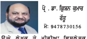
ਉੱਪ ਲੇਖਕ ਤੇ ਮੀਡੀਆ ਵਿਸ਼ਲੇਸ਼ਕ

ਪੁਰੰਧਰ 2: ਭਾਰਤੀ ਸਿਨੇਮਾ ਵਿੱਚ ਬਦਲਦਾ ਨੈਰੇਟਿਵ ਅਤੇ ਫਿਲਮ ਮੀਡੀਆ ਦੀ ਨਵੀਂ ਲਹਿਰ