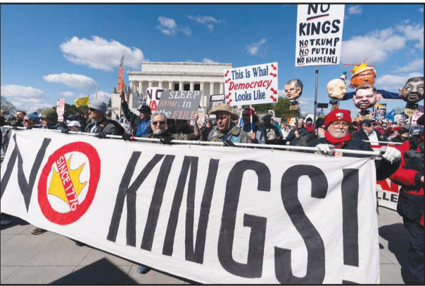
ਵਿਰੋਧ ਪੂਰੇ ਦੇਸ਼ ਲਈ ਉਮੀਦ ਦੀ ਕਿਰਨ ਹੈ।