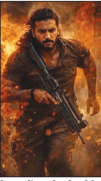
ਫਿਕਸ਼ਨਲ ਲਿੰਕ ਬਣਾਇਆ ਗਿਆ ਹੈ। ਇਸ ਵਿਵਾਦ ਨੇ ਫਿਲਮ ਮੀਡੀਆ ਵਿੱਚ ਨਵੀਆਂ ਬਹਿਸਾਂ ਛੇੜੀਆਂ ਹਨ। ਇੱਕ ਪਾਸੇ ਭਾਰਤੀ ਮੀਡੀਆ ਇਸਨੂੰ ਇੱਕ ਬਲਾਕਬਸਟਰ ਅਤੇ ਰਾਸ਼ਟਰੀ ਗਰਵ ਵਜੋਂ ਪੇਸ਼ ਕਰ ਰਿਹਾ ਹੈ, ਦੂਜੇ ਪਾਸੇ ਅੰਤਰਰਾਸ਼ਟਰੀ ਅਤੇ ਕੁਝ ਭਾਰਤੀ ਆਲੋਚਕ ਇਸਨੂੰ ਪ੍ਰਚਾਰ ਵਜੋਂ ਟੀਕਾ ਕਰ ਰਹੇ ਹਨ।