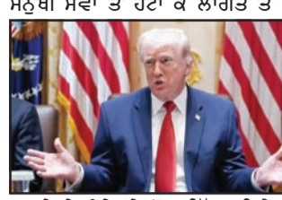
ਮੁਨਾਫ਼ੇ ਦੇ ਕੇਂਦਰ 'ਤੇ ਤਲ ਦਿੱਤਾ, ਜਿਥੇ ਮਰੀਜ਼ ਦੀ ਤਕਲੀਫ਼ ਨਹੀਂ, ਬਲਕਿ ਬਿਲਿੰਗ ਤੇ ਆਰਥਿਕ ਪਹਿਲ ਹੀ ਸਿਸਟਮ ਨਹੀਂ, ਮੁਨਾਫ਼ੇ ਦਾ ਸਿੱਧੀਕੋਟ ਖਰ੍ਹਾ ਕੀਤਾ: ਟਰੰਪ ਜਿਸ ਤਰ੍ਹਾਂ ਨਿੱਜੀਕਰਨ ਨੂੰ ਹੱਲਸ਼ੇਰੀ ਦਿੰਦਾ ਗਿਆ, ਉਸਨੇ ਮਾਨਸਿਕ ਸਿਹਤ ਸੈਂਕੜੇ ਨੂੰ ਕਾਰਪੋਰੇਟ ਲਾਲਚ ਦੇ ਹਵਾਲੇ ਕਰ ਦਿੱਤਾ। ਨਤੀਜਾ, ਫ਼ਰਫੀ ਬਿਲਿੰਗ, ਰਿਕਾਰਡ 'ਚ ਹਰੇਰੇ ਤੇ ਬਿਨਾਂ

ਲੋੜ ਦੇ ਇਲਾਜ ਦਾ ਜਾਲਾ ਮਾਰਿਹ ਸਾਰ ਕਰ ਰਿਹਾ ਹੈ। ਇਹ ਸਿਸਟਮ ਹੁਣ ਇਲਾਜ ਦਾ ਨਹੀਂ, ਕਮਾਈ ਦੀ ਖੋਜ ਬਣ ਚੁੱਕਾ ਹੈ। ਮਰੀਜ਼ਾਂ ਨੂੰ ਠੀਕ ਕਰਨ ਦੀ ਬਜਾਏ ਉਨ੍ਹਾਂ ਨੂੰ ਲੋਭੇ ਇਲਾਜ ਦੇ ਚੱਕਰ 'ਚ ਫਸਾਈ ਰੱਖਣ ਦੀ ਇਸ ਮਾਡਲ ਦੀ ਅਸਲ ਸੱਚਾਈ ਹੈ।