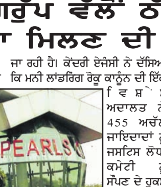
ਜਾ ਰਹੀ ਹੈ। ਕੇਂਦਰੀ ਏਜੰਸੀ ਨੇ ਦੱਸਿਆ ਕਿ ਮਨੀ ਲਾਂਡਰਿੰਗ ਰੋਕੂ ਕਾਨੂੰਨ ਦੀ ਇੱਕ ਵਿਸ਼ੇਸ਼ ਕਮੇਟੀ ਨੂੰ 15,000 ਕਰੋੜ ਰੁਪਏ ਤੋਂ ਵੱਧ ਦੀਆਂ ਜਾਇਦਾਦਾਂ ਸੁਪਰੀਮ ਕੋਰਟ ਵੱਲੋਂ ਬਣਾਈ ਗਈ ਇੱਕ ਵਿਸ਼ੇਸ਼ ਕਮੇਟੀ ਨੂੰ ਸੌਂਪ ਦਿੱਤੀਆਂ ਹਨ। ਇਹ ਕਦਮ ਇਸ ਲਈ ਚੁੱਕਿਆ ਗਿਆ ਹੈ ਤਾਂ ਕਿ ਚੰਡੀਗੜ੍ਹ ਸਥਿਤ ਪੀ.ਏ.ਸੀ.ਐਲ. (ਪਰਲਜ਼ ਗਰੁਪ) ਵੱਲੋਂ ਪੰਜ ਸਾਲੀ ਰਾਹੀਂ ਕਬਜ਼ਾ ਤੋਂ ਤੋਹੇ ਗਏ ਨਿਵੇਸ਼ਕਾਂ ਨੂੰ ਉਨ੍ਹਾਂ ਦਾ ਬਣਦਾ ਬਕਾਇਆ ਵਾਪਸ ਮਿਲ ਸਕੇ। ਇਸ ਵੱਡੇ ਵਿੱਤੀ ਘੁਟਾਲੇ ਦੀ ਅੰਦਾਜ਼ਨ ਕੀਮਤ ਲਗਭਗ 48,000 ਕਰੋੜ ਰੁਪਏ ਦੱਸੀ

ਨਵੀਂ ਦਿੱਲੀ, 31 ਮਾਰਚ (ਚ.ਨ.ਸ.): ਇਨਫੋਰਮੇਟ ਡਾਇਰੈਕਟੋਰੇਟ ਨੇ ਅੱਜ ਜਾਣਕਾਰੀ ਦਿੱਤੀ ਹੈ ਕਿ ਉਨ੍ਹਾਂ ਨੇ 15,000 ਕਰੋੜ ਰੁਪਏ ਤੋਂ ਵੱਧ ਦੀਆਂ ਜਾਇਦਾਦਾਂ ਸੁਪਰੀਮ ਕੋਰਟ ਵੱਲੋਂ ਬਣਾਈ ਗਈ ਇੱਕ ਵਿਸ਼ੇਸ਼ ਕਮੇਟੀ ਨੂੰ ਸੌਂਪ ਦਿੱਤੀਆਂ ਹਨ। ਇਹ ਕਦਮ ਇਸ ਲਈ ਚੁੱਕਿਆ ਗਿਆ ਹੈ ਤਾਂ ਕਿ ਚੰਡੀਗੜ੍ਹ ਸਥਿਤ ਪੀ.ਏ.ਸੀ.ਐਲ. (ਪਰਲਜ਼ ਗਰੁਪ) ਵੱਲੋਂ ਪੰਜ ਸਾਲੀ ਰਾਹੀਂ ਕਬਜ਼ਾ ਤੋਂ ਤੋਹੇ ਗਏ ਨਿਵੇਸ਼ਕਾਂ ਨੂੰ ਉਨ੍ਹਾਂ ਦਾ ਬਣਦਾ ਬਕਾਇਆ ਵਾਪਸ ਮਿਲ ਸਕੇ। ਇਸ ਵੱਡੇ ਵਿੱਤੀ ਘੁਟਾਲੇ ਦੀ ਅੰਦਾਜ਼ਨ ਕੀਮਤ ਲਗਭਗ 48,000 ਕਰੋੜ ਰੁਪਏ ਦੱਸੀ