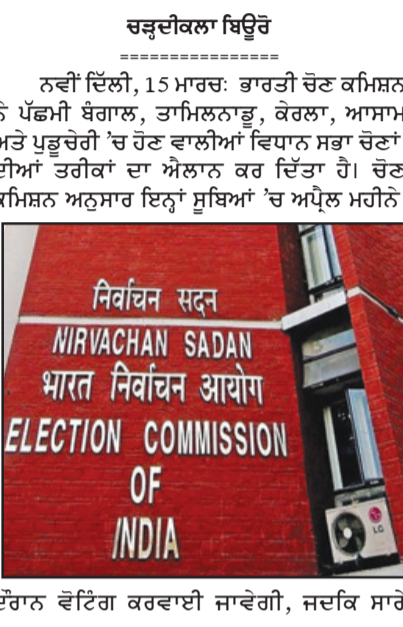
ਦੇਰਾਨ ਵੋਟਿੰਗ ਕਰਵਾਈ ਜਾਵੇਗੀ, ਜਦਕਿ ਸਾਰੇ

ਬੰਗਲਾ 'ਚ 23 ਤੇ 29 ਅਪ੍ਰੈਲ, ਕੇਰਲਾ, ਆਸਾਮ ਤੇ ਪੁਡੁਚੇਰੀ 'ਚ 9 ਅਪ੍ਰੈਲ ਤੇ ਤਾਮਿਲਨਾਡੂ 'ਚ 23 ਅਪ੍ਰੈਲ ਨੂੰ ਹੋਵੇਗੀ ਵੋਟਿੰਗ, ਨਤੀਜੇ 4 ਮਈ ਨੂੰ