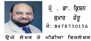
ਉੱਘੇ ਲੋਕ ਤੋਂ ਮੀਡੀਆ ਵਿਸ਼ਲੇਸ਼ਕ

2026 ਦੇ ਇਹਨਾਂ ਮਹੀਨਿਆਂ ਵਿੱਚ ਵਿਧਾਨ ਸਭਾ ਚੋਣਾਂ - ਪੰਜ ਰਾਜਾਂ ਅਤੇ ਕੇਂਦਰ ਸ਼ਾਸਤ ਪ੍ਰਦੇਸ਼ ਵਿੱਚ ਰਾਜਨੀਤਿਕ ਪਲੜਾਅ ਅਤੇ ਸੰਭਾਵਨਾਵਾਂ ਭਾਰਤੀ ਲੋਕਤੰਤਰ ਦਾ ਉਤਸਵ ਦਿਖਾਉਂਦੀਆਂ ਹਨ। ਕੁੱਲ 15 ਮਾਰਚ 2026 ਭਾਰਤੀ ਚੋਣ ਕਮਿਸ਼ਨ ਨੇ ਪੰਜ ਮਹੱਤਵਪੂਰਨ ਰਾਜਾਂ - ਅਸਾਮ, ਕੇਰਲ, ਤਾਮਿਲਨਾਡੂ, ਪੱਛਮੀ ਬੰਗਾਲ ਅਤੇ ਕੇਂਦਰ ਸ਼ਾਸਤ ਪ੍ਰਦੇਸ਼ ਪ੍ਰਭੂਚੇਰੀ - ਵਿੱਚ ਵਿਧਾਨ ਸਭਾ ਚੋਣਾਂ ਦੀਆਂ ਤਰੀਕਾਂ ਦਾ ਐਲਾਨ ਕਰ ਦਿੱਤਾ ਹੈ। ਇਹ ਚੋਣਾਂ ਕੁੱਲ 824 ਵਿਧਾਨ ਸਭਾ ਸੀਟਾਂ ਲਈ ਹੋਣਗੀਆਂ, ਜਿੱਥੇ ਲਗਭਗ 17.4 ਕਰੋੜ (174 ਮਿਲੀਅਨ) ਵੋਟ ਆਪਣੀ ਕਿਸਮਤ ਤੈਅ ਕਰਨਗੇ। ਵੋਟਾਂ ਦੀ ਗਿਣਤੀ 4 ਮਈ 2026 ਨੂੰ ਇੱਕ ਸਮੇਂ ਹੋਵੇਗੀ। ਇਹ ਮੈਗਾ ਈਵੈਂਟ ਭਾਰਤੀ ਰਾਜਨੀਤੀ ਲਈ ਇੱਕ ਵੱਡਾ ਟੈਸਟ ਹੈ, ਜਿੱਥੇ ਵੱਖ-ਵੱਖ ਰਾਜਨੀਤਿਕ ਸੱਭਿਆਚਾਰ, ਗਠਜੋੜ ਅਤੇ ਮੁੱਦੇ ਆਪਣੀ ਪ੍ਰਭਾਵਸ਼ੀਲਤਾ ਸਾਬਤ ਕਰਨਗੇ। ਚੋਣ ਕਮਿਸ਼ਨ ਗਿਆਨੇਸ਼ ਕੁਮਾਰ ਨੇ ਪੰਜ ਕਾਨਫਰੰਸ ਵਿੱਚ ਕਿਹਾ ਕਿ ਚੋਣਾਂ ਨੂੰ ਪੂਰੀ ਤਰ੍ਹਾਂ ਆਜ਼ਾਦ, ਨਿਰਪੱਖ ਅਤੇ ਸ਼ਾਂਤੀਪੂਰਨ ਬਣਾਉਣ ਲਈ ਕੇਂਦਰੀ ਆਥਜ਼ਰਵਰ ਨਿਯੁਕਤ ਕੀਤੇ ਗਏ ਹਨ। ਭਾਰਤੀ ਚੋਣ ਕਮਿਸ਼ਨ ਨੇ ਹਾਲ ਹੀ ਵਿੱਚ ਦਿੱਤੇ ਗਏ ਦੋ ਚੋਣਾਂ ਅਤੇ ਵੋਟ ਦਿੱਤਾ ਗਿਆ ਅਤੇ ਵੋਟ ਦਿੱਤਾ ਗਿਆ ਨੂੰ ਐਂਤਿਮ ਰੂਪ ਦਿੱਤਾ ਹੈ। ਇਸ ਐਲਾਨ ਨਾਲ ਸਾਰੀਆਂ ਰਾਜਨੀਤਿਕ ਪਾਰਟੀਆਂ ਨੇ ਆਪਣੀਆਂ ਤਿਆਰੀਆਂ ਤੇਜ਼ ਕਰ ਦਿੱਤੀਆਂ ਹਨ। ਚੋਣਾਂ ਦੀ ਵੇਰਵਾ ਸੂਚੀ ਅਤੇ ਪ੍ਰਭਾਅ ਚੋਣ ਕਮਿਸ਼ਨ ਨੇ ਚੋਣਾਂ ਨੂੰ ਵੱਖ-ਵੱਖ ਪ੍ਰਭਾਵਾਂ ਵਿੱਚ ਵੰਡਿਆ ਹੈ ਤਾਂ ਜੋ ਪ੍ਰਸ਼ਾਸਨਿਕ ਅਤੇ ਸੁਰੱਖਿਆ ਪੱਖ ਤੋਂ ਬਿਹਤਰ ਪ੍ਰਬੰਧ ਕੀਤੇ ਜਾ ਸਕਣ।