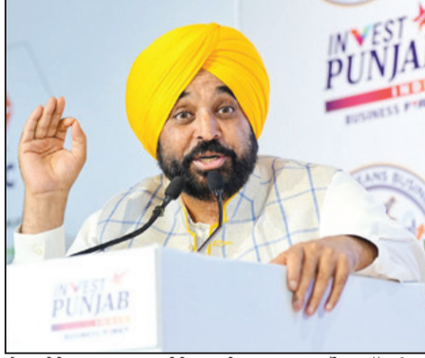
ਮਾਣਯੋਗ ਸ਼ਖ਼ਸੀਅਤਾਂ ਦੇ ਸਮਰਪਣ ਨੂੰ ਬਿਆਨ ਕਰਨ ਲਈ ਮੰਗ ਕਰਦੇ ਹੋਏ ਮੁੱਖ ਮੰਤਰੀ ਭਗਵੰਤ ਸਿੰਘ ਮਾਨ ਨੇ ਕਿਹਾ ਕਿ ਪੰਜਾਬੀ ਹਮੇਸ਼ਾ ਸੂਬਾਵਾਂ ਆਗੂ ਵਜੋਂ ਵਿਚਰਦੇ ਹਨ ਅਤੇ ਅਸੀਂ ਦੇਸ਼ ਅਤੇ ਇਸ ਦੇ ਲੋਕਾਂ ਲਈ ਕੁਝ ਵੀ ਕਰ ਸਕਦੇ ਹਾਂ ਕਿਉਂਕਿ ਦੇਸ਼ ਸਾਡੇ ਲਈ ਸਭ ਤੋਂ ਅੱਗੇ ਹੈ। ਉਨ੍ਹਾਂ ਕਿਹਾ ਕਿ ਆਰਟੀਫੀਸ਼ੀਅਲ ਇੰਟੈਲੀਜੈਂਸ (ਏਆਈ) ਨਵਾਂ ਉੱਭਰਦਾ ਖੇਤਰ ਹੈ ਪਰ (ਬਾਕੀ ਸਫਾ 2 'ਤੇ)

ਚੜ੍ਹਦੀਕਲਾ ਬਿਊਰੋ ਐਸ.ਏ.ਐਸ. ਨਗਰ (ਮੋਹਾਲੀ), 15 ਮਾਰਚ: ਪੰਜਾਬ ਦੇ ਮੁੱਖ ਮੰਤਰੀ ਭਗਵੰਤ ਸਿੰਘ ਮਾਨ ਨੇ ਅੱਜ ਐਸ.ਏ.ਐਸ. ਨਗਰ (ਮੋਹਾਲੀ) ਵਿਖੇ ਤਿੰਨ-ਰੋਜ਼ਾ ਪ੍ਰਗਤੀਸ਼ੀਲ ਪੰਜਾਬ ਨਿਵੇਸ਼ਕ ਸੰਮੇਲਨ ਦੇ ਆਖਰੀ ਦਿਨ ਉਦਯੋਗਪਤੀਆਂ ਨੂੰ ਸੰਬੋਧਨ ਕਰਦਿਆਂ ਉਦਯੋਗ ਲਈ ਸਰਕਾਰ ਦੀ ਤਰਫ਼ੋਂ ਪੂਰਾ ਸਹਿਯੋਗ ਅਤੇ ਰਿਆਇਤਾਂ ਦਾ ਭਰੋਸਾ ਦਿੱਤਾ। ਆਲਮੀ ਅਤੇ ਕੌਮੀ ਨਿਵੇਸ਼ਕਾਂ ਦੀ ਮਜ਼ਬੂਤ ਭਾਈਵਾਲੀ ਦਾ ਜ਼ਿਕਰ ਕਰਦਿਆਂ ਮੁੱਖ ਮੰਤਰੀ ਨੇ ਜ਼ੋਰ ਦੇ ਕੇ ਕਿਹਾ ਕਿ ਇਸ ਸੰਮੇਲਨ ਨੇ ਉਦਯੋਗਿਕ ਵਿਕਾਸ ਲਈ ਅਜਿਹਾ ਮਾਰਗ ਸਿਰਜਿਆ, ਜੋ ਸੂਬੇ ਦੀ ਆਰਥਿਕ ਤਰੱਕੀ ਨੂੰ ਹੋਰ ਰਫ਼ਤਾਰ ਦੇਵੇਗਾ। ਉਨ੍ਹਾਂ ਨੇ ਐਲਾਨ ਕੀਤਾ ਕਿ ਸੂਬਾ ਸਰਕਾਰ ਸੰਮੇਲਨ ਦੌਰਾਨ ਦਿੱਤੇ ਗਏ ਨਿਵੇਸ਼ ਪ੍ਰਸਤਾਵਾਂ ਅਤੇ ਪ੍ਰੋਜੈਕਟਾਂ ਦੀ ਪ੍ਰਗਤੀ ਦਾ ਮੁਲਾਂਕਣ ਕਰਨ ਲਈ ਫੰ ਮਹੀਨਿਆਂ ਬਾਅਦ ਸਮੀਖਿਆ ਸ਼ੈਲੀ ਕਰੇਗੀ। ਇਤਿਹਾਸਕ ਪ੍ਰਗਤੀਸ਼ੀਲ ਪੰਜਾਬ ਨਿਵੇਸ਼ਕ ਸੰਮੇਲਨ ਦੇ ਸਮਾਪਤੀ ਵਾਲੇ ਦਿਨ ਕਾਰੋਬਾਰੀ ਦਿੱਗਜ਼ਾਂ ਨਾਲ ਵਿਚਾਰ-ਚਰਚਾ ਦੌਰਾਨ ਮੁੱਖ ਮੰਤਰੀ ਭਗਵੰਤ ਸਿੰਘ ਮਾਨ ਨੇ ਕਿਹਾ ਕਿ ਇਸ ਸੰਮੇਲਨ ਵਿੱਚ ਸ਼ਾਮਲ ਹੋਣ ਅਤੇ ਸੂਬੇ ਦੀ ਆਰਥਿਕ ਤਰੱਕੀ ਵਿੱਚ ਸਰਗਰਮ ਭਾਈਵਾਲ ਬਣਨ ਲਈ ਇੱਥੇ ਆਈਆਂ (ਬਾਕੀ ਸਫਾ 2 'ਤੇ)