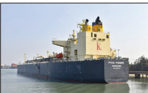
ਟੈਂਕਰ ਗੈਸ ਲੈ ਕੇ, 16 ਅਤੇ 17 ਮਾਰਚ ਨੂੰ ਭਾਰਤ ਪਹੁੰਚੇ ਸਨ। ਇਸ ਦੌਰਾਨ, ਪਾਈਕੋਸਿਸ ਪਾਇਨੀਅਰ ਨਾਮ ਦਾ ਇੱਕ ਜਹਾਜ਼ ਐਤਵਾਰ (22 ਮਾਰਚ) ਨੂੰ ਐਲ.ਪੀ.ਜੀ. ਲੈ ਕੇ ਭਾਰਤ ਪਹੁੰਚਿਆ। ਇੱਕ ਰਿਪੋਰਟ ਦੇ ਅਨੁਸਾਰ, ਅਗਲੇ ਹਫ਼ਤੇ ਨਿਊ ਮੰਗਲੂਰੂ ਬੰਦਰਗਾਹ 'ਤੇ ਵੱਡੀ ਮਾਤਰਾ ਵਿੱਚ ਐਲ.ਪੀ.ਜੀ. ਪਹੁੰਚਣ ਦੀ ਉਮੀਦ ਹੈ। (ਬਾਕੀ ਸਫਾ 2 'ਤੇ)

ਚੜ੍ਹਦੀਕਲਾ ਬਿਊਰੋ ਬੋਗਲੂ, 22 ਮਾਰਚ : ਮੱਧ ਪੂਰਬ ਵਿੱਚ ਚੱਲ ਰਹੀ ਜੰਗ ਕਾਰਨ ਏਸ਼ੀਆਈ ਦੇਸ਼ ਗੈਸ ਅਤੇ ਤੇਲ ਦੀ ਭਾਰੀ ਕਮੀ ਦਾ ਸਾਹਮਣਾ ਕਰ ਰਹੇ ਹਨ। ਇਸ ਦੌਰਾਨ, ਭਾਰਤ ਵੀ ਐਲ.ਪੀ.ਜੀ. ਸੈਕਟ ਦਾ ਸਾਹਮਣਾ ਕਰ ਰਿਹਾ ਹੈ। ਹਾਲਾਂਕਿ, ਕੁਝ ਰਾਹਤ ਦੀਆਂ ਖ਼ਬਰਾਂ ਸ਼ਾਹਮਣੇ ਆਈਆਂ ਹਨ। ਅਮਰੀਕਾ ਦੇ ਟੈਕਸਾਸ ਤੋਂ ਐਲ.ਪੀ.ਜੀ. ਲੈ ਕੇ ਜਾਣ ਵਾਲਾ ਇੱਕ ਕਾਰਗੋ ਜਹਾਜ਼ ਐਤਵਾਰ ਨੂੰ ਮੰਗਲੂਰੂ ਬੰਦਰਗਾਹ 'ਤੇ ਪਹੁੰਚਿਆ। ਇਸ ਦੇ ਨਾਲ ਹੀ ਰੂਸ ਤੋਂ ਕੱਚਾ ਤੇਲ ਲੈ ਕੇ ਜਾਣ ਵਾਲੇ ਇੱਕ ਜਹਾਜ਼ ਭਾਰਤ ਪਹੁੰਚ ਗਿਆ। ਪਿਛਲੇ ਸੱਤ ਦਿਨਾਂ ਵਿੱਚ ਗੈਸ ਅਤੇ ਕੱਚਾ ਤੇਲ ਲੈ ਕੇ ਜਾਣ ਵਾਲੇ ਲਗਭਗ ਪੰਜ ਜਹਾਜ਼ ਸਮੁੰਦਰ ਰਾਹੀਂ ਭਾਰਤ ਪਹੁੰਚੇ ਹਨ। ਇਸ ਤੋਂ ਪਹਿਲਾਂ 18 ਮਾਰਚ ਨੂੰ ਕੱਚੇ ਤੇਲ ਦਾ ਟੈਂਕਰ ਜਗ ਲਾਡਕੀ ਗੁਜਰਾਤ ਦੇ ਅਡਾਨੀ ਬੰਦਰਗਾਹ 'ਤੇ ਪਹੁੰਚਿਆ ਸੀ। ਦੋ ਹੋਰ ਐਲ.ਪੀ.ਜੀ. ਕੈਰੀਅਰ, ਐਮ.ਟੀ. ਸਿਵਾਲਿਕ ਅਤੇ ਐਮ.ਟੀ. ਨੰਦਾ ਦੇਵੀ, ਲਗਭਗ 92,712 ਮੀਟ੍ਰਿਕ