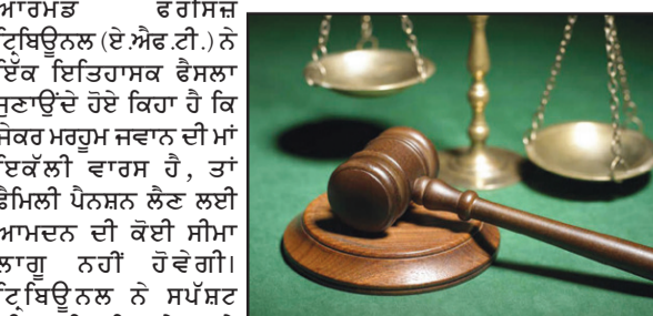
ਕਿਹਾ ਕਿ ਜੇਕਰ ਵਿਧਵਾ ਪਤਨੀ ਲਈ (ਬਾਕੀ ਸਫਾ 2 'ਤੇ)

ਚੜ੍ਹਦੀਕਲਾ ਬਿਊਰੋ ਚੰਡੀਗੜ੍ਹ, 22 ਮਾਰਚ : ਫੈਮਿਲੀ ਪੈਨਸ਼ਨ (ਏ.ਐਫ.ਟੀ.) ਨੂੰ ਇੱਕ ਇਤਿਹਾਸਕ ਫੈਸਲਾ ਸੁਣਾਉਂਦੇ ਹੋਏ ਕਿਹਾ ਹੈ ਕਿ ਜੇਕਰ ਮਰਹੂਮ ਜਵਾਨ ਦੀ ਮਾਂ ਇਕੱਲੀ ਵਾਰਸ ਹੈ, ਤਾਂ ਫੈਮਿਲੀ ਪੈਨਸ਼ਨ ਲੈਣ ਲਈ ਆਮਦਨ ਦੀ ਕੋਈ ਸੀਮਾ ਲਾਗੂ ਨਹੀਂ ਹੋਵੇਗੀ। ਟ੍ਰਿਬਿਊਨਲ ਨੇ ਸਪੱਸ਼ਟ ਕੀਤਾ ਕਿ ਜਿਹੜੇ ਮਾਪੇ ਆਪਣੇ ਪੁੱਤ 'ਤੇ ਪੂਰੀ ਤਰ੍ਹਾਂ ਨਿਰਭਰ ਸਨ, ਉਹ ਉਮਰ ਭਰ ਲਈ ਫੈਮਿਲੀ