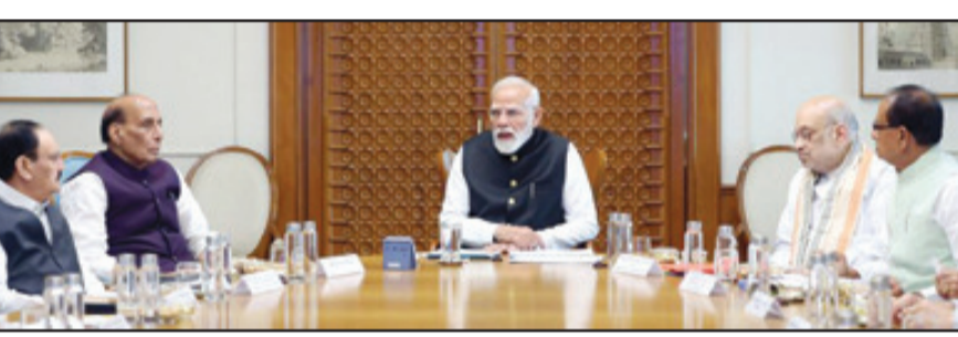
ਨਰਿੰਦਰ ਮੋਦੀ ਨੇ ਐਤਵਾਰ ਨੂੰ ਸੀਨੀਅਰ ਮੰਤਰੀਆਂ ਨਾਲ ਇੱਕ ਉੱਚ ਪੱਧਰੀ ਮੀਟਿੰਗ ਕੀਤੀ। ਇਸ ਮੀਟਿੰਗ ਵਿੱਚ ਪੱਛਮੀ ਏਸ਼ੀਆ ਦੇ ਹਾਲਾਤ ਨੂੰ ਦੇਖਦੇ ਹੋਏ ਕੱਚੇ ਤੇਲ, ਗੈਸ, ਪੈਟਰੋਲੀਅਮ ਉਤਪਾਦਾਂ, ਬਿਜਲੀ ਅਤੇ ਖਾਦ ਖੇਤਰ ਦੀ ਸਥਿਤੀ ਦੀ ਸਮੀਖਿਆ ਕੀਤੀ ਗਈ। ਸਰਕਾਰੀ

ਚੜ੍ਹਦੀਕਲਾ ਬਿਊਰੋ ਨਵੀਂ ਦਿੱਲੀ, 22 ਮਾਰਚ : ਪ੍ਰਧਾਨ ਮੰਤਰੀ ਨਰਿੰਦਰ ਮੋਦੀ ਨੇ ਐਤਵਾਰ ਨੂੰ ਸੀਨੀਅਰ ਮੰਤਰੀਆਂ ਨਾਲ ਇੱਕ ਉੱਚ ਪੱਧਰੀ ਮੀਟਿੰਗ ਕੀਤੀ। ਇਸ ਮੀਟਿੰਗ ਵਿੱਚ ਪੱਛਮੀ ਏਸ਼ੀਆ ਦੇ ਹਾਲਾਤ ਨੂੰ ਦੇਖਦੇ ਹੋਏ ਕੱਚੇ ਤੇਲ, ਗੈਸ, ਪੈਟਰੋਲੀਅਮ ਉਤਪਾਦਾਂ, ਬਿਜਲੀ ਅਤੇ ਖਾਦ ਖੇਤਰ ਦੀ ਸਥਿਤੀ ਦੀ ਸਮੀਖਿਆ ਕੀਤੀ ਗਈ। ਸਰਕਾਰੀ