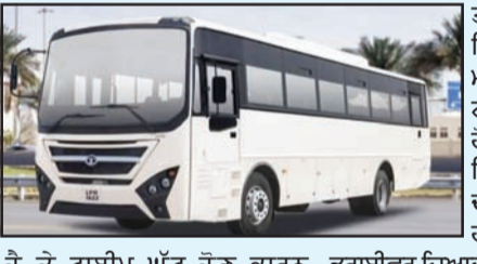
ਮੋਗਾ, 2 ਮਾਰਚ (ਨਿਸ਼ੀ ਮਨਚੰਦਾ/ਗੁਰਦੇਵ ਖੁਰਾਣਾ): ਮੋਗਾ ਦੇ ਅੰਮ੍ਰਿਤਸਰ ਰੋਡ ਉੱਤੇ ਬੱਸ ਸਟੋਪ ਹੋਣ ਕਰਕੇ ਬੱਸਾਂ ਦਾ ਆਉਣ-ਜਾਣਾ ਬਣਿਆ ਰਹਿੰਦਾ ਹੈ। ਹਰ ਦੋ ਮਿੰਟ ਬਾਅਦ ਬੱਸ ਆਉਣੀ-ਜਾਣੀ ਰਹਿੰਦੀ ਹੈ ਤੇ ਟਾਈਮ ਘੱਟ ਹੋਣ ਕਾਰਨ ਡਰਾਈਵਰ ਹਾਰਨ ਦੀ ਜ਼ਿਆਦਾ ਵਰਤੋਂ ਕਰਦੇ ਹਨ, ਤੇਜ਼ ਹਾਰਨ ਕਾਰਨ ਦੁਕਾਨਦਾਰ ਬਹੁਤ ਪ੍ਰੇਸ਼ਾਨ ਹੋਏ ਹਨ, ਟਾਈਮ ਘੱਟ ਹੋਣ ਕਾਰਨ ਡਰਾਈਵਰ