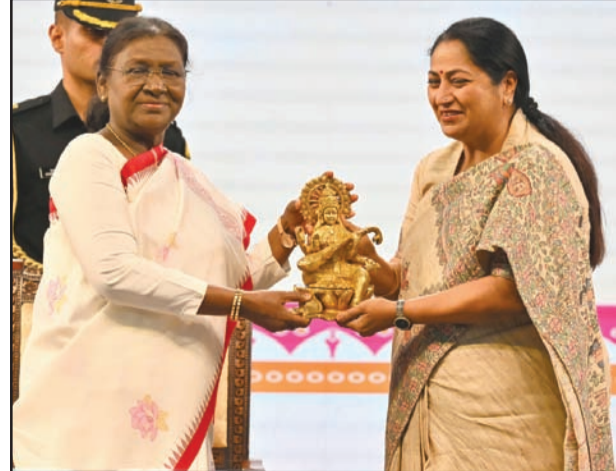
ਇੱਕ ਅਨਿੱਖੜਵਾਂ ਅੰਗ ਹਨ। ਉਨ੍ਹਾਂ ਦਾ ਸਤਿਕਾਰ ਅਤੇ ਸ਼ਕਤੀਕਰਨ ਇੱਕ ਸੱਭਿਅਕ ਸਮਾਜ ਦੇ ਚਿੰਨ੍ਹ ਹਨ। ਅਸੀਂ ਅੰਗਰਾਂ ਨੂੰ ਦੁਰਗਾ, ਸਰਸਵਤੀ ਅਤੇ ਲਕਸ਼ਮੀ ਵਜੋਂ ਪੂਜਦੇ ਹਾਂ, ਸ਼ਕਤੀ, ਗਿਆਨ ਅਤੇ ਖੁਸ਼ਹਾਲੀ ਦੇ ਪ੍ਰਤੀਕ। ਭਾਰਤ ਦਾ ਇਤਿਹਾਸ ਅੰਗਰਾਂ ਦੀ ਹਿੰਮਤ, ਬਹਾਦਰੀ, ਕੁਰਬਾਨੀ ਅਤੇ ਆਤਮ-ਤਿਆਗ ਦੀਆਂ ਅਣਗਿਣਤ ਕਹਾਣੀਆਂ ਨਾਲ ਭਰਿਆ ਹੋਇਆ ਹੈ।