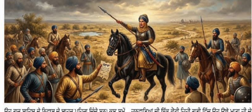
ਉਹ ਗੁਰੂ ਸਾਹਿਬ ਦੇ ਨਿਵਾਸ ਦੇ ਬਹੁਤ ਪਹਿਰੇ ਵਿੱਚ ਸਨ। ਕੁਝ ਸਮੇਂ ਮਗਰੋਂ ਮਾਈ ਭਾਗੋ ਕੋਰ ਜੀ ਨਾਂਦੇੜ ਛੱਡ ਕੇ 'ਖਿਰਾਣੇ' ਸਾਹਿਬ ਵਿੱਚ ਗੁਰੂ ਨਾਨਕ ਸਾਹਿਬ ਜੀ ਵੱਲੋਂ ਸਨ, ਉਥੇ ਰਹਿਣ ਲੱਗੇ।

ਸਿੱਖ ਇਤਿਹਾਸ ਵਿੱਚ ਸਿੱਖ ਬੀਬੀਆਂ ਦਾ ਵਿਸ਼ੇਸ਼ ਯੋਗਦਾਨ ਦਿਖਾਉਂਦੀਆਂ ਹਨ। ਅਜਿਹੇ ਹੀ ਇੱਕ ਇਤਿਹਾਸਕ ਪੱਠਰ ਹਨ ਮਾਤਾ ਭਾਗੋ, ਜਿਨ੍ਹਾਂ ਨੇ ਸਿੱਖ ਇਤਿਹਾਸ ਨੂੰ ਨਵਾਂ ਮੋੜ ਦਿੱਤਾ ਹੈ। ਜਨਮ ਵੇਲੇ ਮਾਈ ਭਾਗੋ ਦਾ ਨਾਮ ਭਾਗੋਰੀ ਰੱਖਿਆ ਗਿਆ ਸੀ। ਜਦੋਂ ਗੁਰੂ ਗੋਬਿੰਦ ਸਿੰਘ ਜੀ ਨੇ 1699 ਈਸਵੀ ਦੀ ਵਿਸਾਖੀ ਨੂੰ ਖਾਲਸਾ ਸਾਜਿਆ ਤਾਂ ਇਨ੍ਹਾਂ ਦੇ ਪਰਿਵਾਰ ਦੇ ਕਈ ਮੈਂਬਰ ਵੀ ਅੰਮ੍ਰਿਤ ਛਕ ਕੇ ਗਏ ਸਨ। ਗੁਰੂ ਕੀਆਂ ਸਾਖੀਆਂ ਮੁਤਾਬਕ ਮਾਈ ਭਾਗੋ ਮੁਕਤਸਰ ਸਾਹਿਬ ਦੀ ਜੰਗ ਵਿੱਚ ਜ਼ਖਮੀ ਹੋਏ ਸਨ। ਜੰਗ ਤੋਂ ਬਾਅਦ ਉਹ ਗੁਰੂ ਸਾਹਿਬ ਦੇ ਸਿੱਖਾਂ ਵਿੱਚ ਸ਼ਾਮਲ ਹੋ ਗਏ ਸਨ ਅਤੇ ਅਜੋਕੇ ਮਹਾਰਾਸ਼ਟਰ ਵਿਚਲੇ ਨਾਂਦੇੜ ਆ ਗਏ ਸਨ। ਇਹ ਇਤਿਹਾਸਕ ਗੱਲ ਹੈ ਕਿ 'ਖਿਰਾਣੇ ਦੀ ਝਾੜ' ਮੌਜੂਦਾ ਮੁਕਤਸਰ ਸਾਹਿਬ, ਪੰਜਾਬ ਦਾ ਉਹ ਇਲਾਕਾ ਹੈ, ਜਿੱਥੇ ਸਿੱਖਾਂ ਦੇ ਦਸਵੇਂ ਗੁਰੂ ਗੋਬਿੰਦ ਸਿੰਘ ਨੇ ਆਪਣੇ ਜੀਵਨ ਦੇ ਸੰਘਰਸ਼ ਦੀ ਆਖਰੀ ਲੜਾਈ ਲੜੀ ਸੀ।