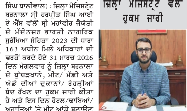
ਜ਼ਿਲ੍ਹਾ ਮੈਜਿਸਟ੍ਰੇਟ ਵੱਲੋਂ ਹੁਕਮ ਜਾਰੀ