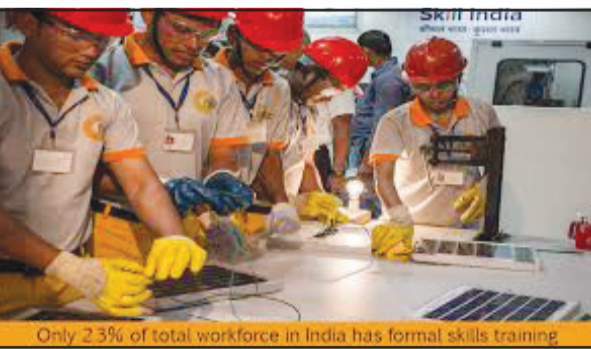
Only 2.3% of total workforce in India has formal skills training

एशियाई देशों में सत्ता परिवर्तन अक्सर हिंसा और अराजकता का कारण बनते हैं। इसके विपरीत भारत ने अपने लोकतांत्रिक ढांचे से स्थिरता का माहौल तैयार किया है। यही कारण है कि विश्व की बड़ी कंपनियाँ भारत को सफ़ हैबन के रूप में देखती हैं। चीन या रूस जैसे देशों में निवेश करने पर राजनीतिक जोखिम अधिक होता है, जबकि भारत में लोकतंत्र यह सुनिश्चित करता है कि नीतियाँ स्थिर रहें और निवेश सुरक्षित रहे। यह लोकतंत्र की वही शक्ति है जो भारत को अलग पहचान दिलाती है। साथियों बात अगर हम भारत की दूसरी सबसे बड़ी ताकत की करें तो वह है उसकी जनसांख्यिकी वर्तमान समय में भारत की आबादी लगभग 1.43 अरब है और इसमें से 65 पैसेट से अधिक लोग 35 वर्ष से कम आयु वर्ग में आते हैं। यह स्थिति भारत को दुनिया की सबसे युवा आबादी वाला देश बनाती है। युवा आबादी किसी भी राष्ट्र के लिए ऊर्जा, नवाचार और विकास का प्रतीक होती है। जब यूरोप और जापान जैसे विकसित देश बूढ़ी होती आबादी की समस्या से जूझ रहे हैं, तब भारत के पास एक