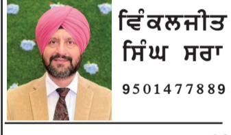
ਉੱਘੇ ਲੇਖਕ ਤੇ ਮੀਡੀਆ ਵਿਸ਼ਲੇਸ਼ਕ