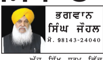
ਉੱਘੇ ਲੇਖਕ ਤੇ ਮੀਡੀਆ ਵਿਸ਼ਲੇਸ਼ਕ

ਪਹਿਨਣ ਵਾਲੇ ਬਸਤਰਾਂ ਵਿੱਚ ਅਹਿਮ ਸਥਾਨ ਰੱਖਦੀ ਹੈ। ਇਸ ਦਸਤਾਰ ਤੋਂ ਬਿਨਾਂ ਸਿੱਖ ਦਾ ਸਰੂਪ ਕਿਆਸਿਆ ਵੀ ਨਹੀਂ ਜਾ ਸਕਦਾ। ਸੱਟ ਸਮੇਂ ਜਾਂ ਅਰਾਮ ਕਰਨ ਸਮੇਂ ਫੋਟੋ ਦਸਤਾਰ ਸਜਾਉਣਾ ਸਿੱਖ ਲਈ ਲਾਜ਼ਮੀ ਹੈ, ਜਿਸ ਨੂੰ ਕੇਸਰੀ ਦਾ ਨਾਂਅ ਦਿੱਤਾ ਗਿਆ ਹੈ। ਆਮ ਤੌਰ 'ਤੇ ਅੰਮ੍ਰਿਤਧਾਰੀ ਸਿੱਖ ਦਸਤਾਰ ਦੇ ਰੋਨਾਂ ਕੇਸਰੀ ਸਜਾਉਂਦੇ ਹਨ। ਭਾਵੇਂ ਇਸ ਖਿੱਤੇ ਦੇ ਕੁਝ ਦੇਸ਼ਾਂ ਵਿੱਚ ਸਿਰ ਨੂੰ ਢੱਕਣ ਲਈ ਮੁੱਢ-ਕਦੀਮ ਪੱਗਾਂ ਦੀ ਵਰਤੋਂ ਹੁੰਦੀ ਆਈ ਹੈ। ਪਰ ਆਰੀਆ ਸੱਭਿਅਤਾ ਦੇ ਲੋਕਾਂ ਵਿੱਚ ਪਗੜੀ ਬੰਨਣ ਦਾ ਰਿਵਾਜ ਬਹੁਤ ਪੁਰਾਣਾ ਹੈ। ਪੰਜਾਬ ਦੀ ਸੱਭਿਅਤਾ ਵਿੱਚ ਦਸਤਾਰ ਧਾਰਨ ਕਰਨੀ ਸਾਡੇ ਸਮਾਜ ਅਤੇ ਸੱਭਿਆਚਾਰ ਦਾ ਹਿੱਸਾ ਰਿਹਾ ਹੈ। ਹਰ ਧਰਮ ਤੇ ਜਾਤ ਦੇ ਲੋਕ ਦਸਤਾਰ ਸਜਾਉਂਦੇ ਰਹੇ ਹਨ।