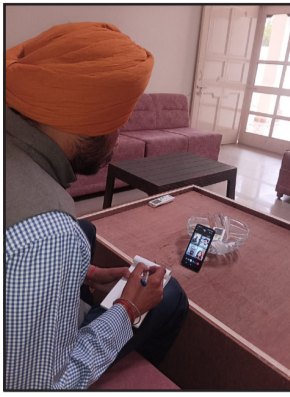
ਪ੍ਰੋਗਰਾਮ ਬਾਰੇ ਦਿਸ਼ਾ-ਨਿਰਦੇਸ਼ ਜਾਰੀ ਕੀਤੇ ਗਏ। ਮੀਟਿੰਗ ਵਿੱਚ ਲੋਕ ਸਭਾ ਮੈਂਬਰ ਬਾਂਸੁਰੀ ਸਵਰਾਜ ਦਿੱਲੀ ਵੀ ਸ਼ਾਮਲ ਹੋਏ। ਇਸ ਮੌਕੇ ਸ਼੍ਰੀਮਤੀ ਬਾਂਸੁਰੀ ਸਵਰਾਜ ਨੇ 16,17,18 ਨੂੰ