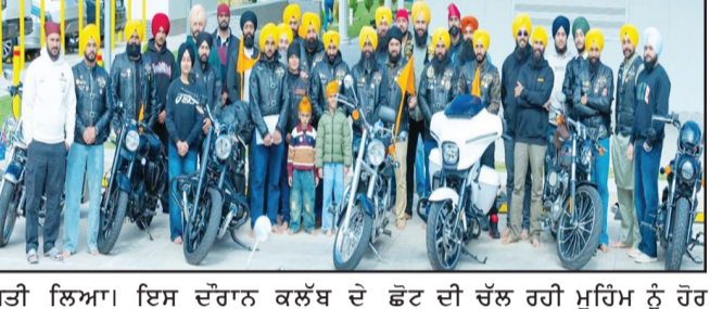
ਮੇਲਬੌਰਨ ਵਿੱਚ ਆਜ਼ਾਦ ਸਿੱਖ ਸੋਸ਼ਲ ਮੋਟਰਸਾਈਕਲ ਕਲੱਬ ਵੱਲੋਂ ਵਿਸ਼ੇਸ਼ ਮੋਟਰਸਾਈਕਲ ਰੈਲੀ ਦਾ ਆਯੋਜਨ ਕੀਤਾ ਗਿਆ। ਇਸ ਰੈਲੀ ਦੀ ਖਾਸ ਵਿਲੱਖਣਤਾ ਇਹ ਰਹੀ ਕਿ ਸਾਰੇ ਮੋਟਰਸਾਈਕਲ ਸਵਾਰਾਂ ਨੇ ਹੇਲਮਟ ਦੀ ਥਾਂ 'ਤੇ ਦਸਤਾਰਾਂ ਸਜਾ ਕੇ ਨਗਰ ਕੀਰਤਨ ਵਿੱਚ ਸ਼ਿਰਕਤ ਕੀਤੀ ਤੇ ਦਸਤਾਰਧਾਰੀ ਸਵਾਰਾਂ ਲਈ ਹੇਲਮਟ ਤੇ ਛੋਟ ਦੀ ਮੰਗ ਨੂੰ ਮਜ਼ਬੂਤੀ ਨਾਲ ਉਭਾਰਿਆ।

ਦਸਤਾਰਧਾਰੀ ਮੋਟਰਸਾਈਕਲ ਸਵਾਰਾਂ ਲਈ ਹੇਲਮਟ ਛੋਟ ਦੀ ਚੱਲ ਰਹੀ ਮੁਹਿੰਮ ਨੂੰ ਹੋਰ ਨੁਮਾਇੰਦਿਆਂ ਨੇ ਦੱਸਿਆ ਕਿ ਪਿਛਲੇ 3 ਸਾਲਾਂ ਤੋਂ ਵਿਸ਼ਾਖੀ ਮੌਕੇ ਇਸ ਤਰ੍ਹਾਂ ਦੀ ਰਾਈਡ ਵੱਖ-ਵੱਖ ਗੁਰਦੁਆਰਿਆਂ ਵਿੱਚ ਕਰਵਾਈ ਜਾ ਰਹੀ ਹੈ, ਜਿਸ ਦਾ ਮਕਸਦ ਸਿੱਖ ਪਛਾਣ, ਏਕਤਾ ਤੇ ਭਾਈਚਾਰੇ ਦੀ ਭਾਵਨਾ ਨੂੰ ਉਜਾਗਰ ਕਰਨਾ ਹੈ। ਇਹ ਉਪਹਾਲਾ