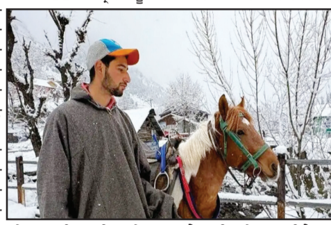
ਅਤਿਵਾਦੀ ਹਮਲੇ 'ਚ 25 ਸੈਲਾਨੀ ਮਾਰੇ ਗਏ ਸਨ। ਅਧਿਕਾਰੀ ਨੇ ਦੱਸਿਆ ਕਿ ਹਰ ਸੇਵਾ ਦੇਣ ਵਾਲੇ ਦੀ ਪੁਲਿਸ ਨੇ ਸਹੀ ਤਰ੍ਹਾਂ ਜਾਂਚ ਕੀਤੀ ਹੈ, ਪ੍ਰਭਾਸਨ

ਪਹਿਲਗਾਮ ਆਉਣ ਵਾਲੇ ਲੋਕਾਂ ਦਾ ਭਰੋਸਾ ਬਹਾਲ ਕਰਨ ਲਈ ਵੱਡਾ ਕਦਮ ਮੰਨੀ ਜਾ ਰਹੀ ਹੈ, ਜਿੱਥੇ ਪਿਛਲੇ ਸਾਲ 22 ਅਪ੍ਰੈਲ ਨੂੰ ਹਫ਼ਤੇ ਭਿਆਨਕ ਕੌਲ ਰਜਿਸਟ੍ਰੇਸ਼ਨ ਕੀਤੀ ਗਈ ਹੈ ਤੇ ਉਨ੍ਹਾਂ ਨੂੰ ਵਿਲੱਖਣ ਕਿਊਆਰ ਕੋਡ ਦਿੱਤਾ ਗਿਆ ਹੈ, ਜਿਸ ਵਿੱਚ ਉਸ ਵਿਅਕਤੀ ਦੀ ਨਿੱਜੀ ਜਾਣਕਾਰੀ ਤੇ ਹਰ ਵੇਰਵੇ ਸ਼ਾਮਲ ਹਨ। ਅਧਿਕਾਰੀਆਂ ਅਨੁਸਾਰ ਜਦੋਂ ਸੈਲਾਨੀ ਆਪਣੇ ਮੌਖ਼ਈ ਫੌਨ ਨਾਲ ਇਹ ਕੋਡ ਸਕੈਨ ਕਰਨਗੇ ਤਾਂ ਉਹ ਸਬੰਧਤ ਵਿਅਕਤੀ ਬਾਰੇ ਪੂਰੀ ਜਾਣਕਾਰੀ ਦੇਖ ਸਕਣਗੇ। ਇਹ ਪਹਿਲ ਚੁੱਕਵੀਂ ਤੇ ਰਜਿਸਟਰਡ ਪਛਾਣ ਪ੍ਰਣਾਲੀ ਵਜੋਂ ਕੰਮ ਕਰਦੀ ਹੈ ਜੋ ਖੋਲ੍ਹਣ ਵਾਲੀਆਂ ਤੇ ਯਕੀਨੀ ਬਣਾਏਗੀ ਕਿ ਕੋਈ ਵੀ ਅਣਅਧਿਕਾਰਤ ਵਿਅਕਤੀ ਸੈਰ-ਸਪਾਟੇ ਨਾਲ ਜੁੜੇ ਹੋਣ ਦਾ ਦਾਅਵਾ ਨਾ ਕਰ ਸਕੇ।