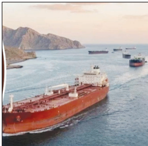
ਜੇਕਰ ਈਰਾਨ ਨੇ 48 ਘੰਟਿਆਂ ਦੇ ਅੰਦਰ ਹੋਰਮੁਜ਼ ਦਾ ਰਸਤਾ

ਤਹਿਰਾਨ, 12 ਅਪ੍ਰੈਲ (ਪ੍ਰਤੀਨਿਧੀ) : ਪੱਛਮੀ ਏਸ਼ੀਆ ਵਿੱਚ ਤਣਾਅ ਇੱਕ ਵਾਰ ਫਿਰ ਗੰਭੀਰ ਰੂਪ ਧਾਰਨ ਕਰ ਗਿਆ ਹੈ। ਇਰਾਨ ਅਤੇ ਅਮਰੀਕਾ-ਇਜ਼ਰਾਇਲ ਵਿੱਚਾਲੇ ਚੱਲ ਰਹੀ ਖਿੱਚੋਤਾਣ ਹੁਣ ਇੱਕ ਨਵੇਂ ਮੌੜ 'ਤੇ ਆ ਗਈ ਹੈ। ਇਰਾਨ ਨੇ ਰਣਨੀਤਕ ਤੌਰ 'ਤੇ ਮਹੱਤਵਪੂਰਨ ਸਟਰੇਟ ਅੰਡ ਹੋਰਮੁਜ਼ ਨੂੰ ਬੰਦ ਕਰ ਦਿੱਤਾ ਹੈ, ਜਿਸ ਕਾਰਨ ਦੁਨੀਆਂ ਭਰ ਦੇ ਵਪਾਰਕ ਬਾਜ਼ਾਰਾਂ ਵਿੱਚ ਹਲਚਲ ਮੱਚ ਗਈ ਹੈ।