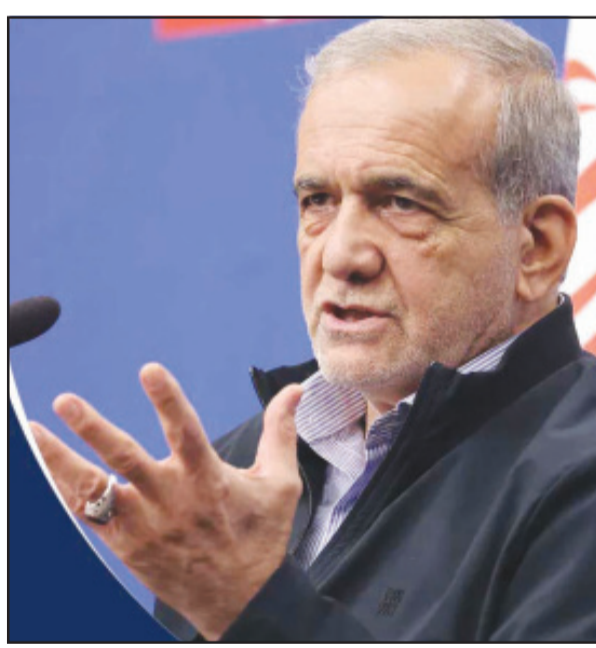
ਰਾਹੀਂ ਵੱਧ ਤੋਂ ਵੱਧ ਲੋਕਾਂ ਨੂੰ ਇਸ ਮੁਹਿੰਮ ਤੋਂ ਜੋ ਅਮਰੀਕੀ ਧਮਕੀਆਂ ਦਾ ਮੂੰਹ-ਨਾਲ ਜੁੜਨ ਦੀ ਅਪੀਲ ਕਰ ਰਹੀ ਹੈ ਤੋੜ ਜਵਾਬ ਦਿੱਤਾ ਜਾ ਸਕੇ।

ਇਸਲਾਮਾਬਾਦ, 12 ਅਪ੍ਰੈਲ (ਪ੍ਰਤੀਨਿਧੀ) : ਅਮਰੀਕਾ ਅਤੇ ਇਰਾਨ ਵਿੱਚਾਲੇ ਵਧਦੇ ਤਣਾਅ ਦਰਮਿਆਨ ਇਰਾਨ ਦੇ ਰਾਸ਼ਟਰਪਤੀ ਮਸੂਦ ਪੇਜ਼ੇਸ਼ਕੀਅਨ ਨੇ ਇੱਕ ਬਹੁਤ ਹੀ ਭਾਵੁਕ ਤੇ ਵੱਡਾ ਬਿਆਨ ਜਾਰੀ ਕੀਤਾ ਹੈ। ਸੋਸ਼ਲ ਮੀਡੀਆ ਪਲੇਟਫਾਰਮ 'ਐਕਸ' 'ਤੇ ਰਾਸ਼ਟਰਪਤੀ ਨੇ ਕਿਹਾ ਹੈ ਕਿ ਉਹ ਖੁਦ ਅਤੇ 1.4 ਕਰੋੜ ਇਰਾਨੀ ਵਾਲੇ ਟੀਅਰ ਦੇਸ਼ ਲਈ ਜੰਗ ਦੇ ਮੈਦਾਨ ਵਿੱਚ ਆਪਣੀ ਜਾਨ ਕੁਰਬਾਨ ਕਰਨ ਲਈ ਪੂਰੀ ਤਰ੍ਹਾਂ ਤਿਆਰ ਹਨ।