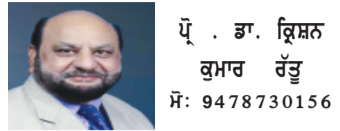
ਉੱਘੇ ਲੇਖਕ ਤੇ ਮੀਡੀਆ ਵਿਸ਼ਲੇਸ਼ਕ

ਅੱਜ ਪੰਜਾਬ ਲਾਵਾਰਿਸ ਹੋ ਕੇ ਆਪਣੀ ਉਦਾਸੀ ਤੇ ਨਿਰਾਸ਼ਾ 'ਤੇ ਝੂਰ ਰਿਹਾ ਹੈ। ਪੰਜਾਬ ਸਿਰਫ਼ ਇੱਕ ਭੂਗੋਲਿਕ ਇਕਾਈ ਨਹੀਂ, ਇਹ ਇੱਕ ਜਜ਼ਬਾ ਹੈ, ਇੱਕ ਰੂਹ ਹੈ, ਇੱਕ ਇਤਿਹਾਸ ਹੈ। ਇਹ ਉਹ ਧਰਤੀ ਹੈ, ਜਿਸ ਨੇ ਸਾਚੇ ਸਦੀ ਸੰਘਰਸ਼ ਕੀਤਾ, ਜ਼ੁਲਮ ਦੇ ਸਾਹਮਣੇ ਸੀਨਾ ਤਾਣ ਕੇ ਖੜ੍ਹੀ ਰਹੀ, ਆਪਣੀ ਮਿੱਟੀ ਲਈ ਕੁਰਬਾਨੀਆਂ ਦਿੱਤੀਆਂ ਅਤੇ ਦੁਨੀਆ ਨੂੰ ਦੱਸਿਆ ਕਿ ਹੱਸਲਾ ਕੀ ਹੁੰਦਾ ਹੈ। ਇਹ ਉਹ ਧਰਤੀ ਹੈ, ਜਿੱਥੇ ਪੇਂਡਾਂ ਦੀ ਹਰਿਆਦੀ ਵਿੱਚ ਮਿਹਨਤ ਦੀ ਮਹਿਰ ਹੁੰਦੀ ਹੈ, ਜਿੱਥੇ ਲੋਕ ਸਿਰਫ਼ ਜਿਉਂਦੇ ਨਹੀਂ—ਸਨਾਨ ਨਾਲ ਜਾਗਦੇ ਹਨ। ਪਰ ਅੱਜ ਇਹੀ ਪੰਜਾਬ ਇੱਕ ਵਾਰ ਫਿਰ ਚਿੰਤਾ, ਅਸਥਿਰਤਾ ਅਤੇ ਅੰਦਰੂਨੀ ਟੁੱਟ ਦੇ ਦੌਰ ਵਿੱਚ ਵੱਲ ਰੁਝਾਨ ਅਤੇ ਰਾਜਨੀਤਿਕ ਪੱਖਾਂ ਦੀ ਖੁਦਗਰਜ਼ੀ—ਇਹ ਸਭ ਮਿਲ ਕੇ ਪੰਜਾਬ ਦੀ ਰੂਹ ਨੂੰ ਝੰਜੜ ਰਹੇ ਹਨ। ਅੱਜ ਲੋਕਾਂ ਦੀਆਂ ਆਵਾਜ਼ਾਂ ਵਿੱਚ ਇੱਕ ਵਾਰ ਗੁੱਸਾ ਵੀ ਹੈ ਅਤੇ ਬੇਸ਼ਕੀ ਵੀ। ਲੋਕ ਪੁੱਛ ਰਹੇ ਹਨ—ਇਹ ਉਹ ਪੰਜਾਬ ਤਾਂ ਨਹੀਂ ਸੀ ਜਿਸਦਾ ਅਸੀਂ ਸੁਨਾਨ ਦੁੱਖਿਆ ਸੀ। ਇਹ ਉਹ ਧਰਤੀ ਨਹੀਂ ਸੀ, ਜਿਸਨੂੰ ਅਸੀਂ ਨਵੀਂ ਸਦੀ ਦਾ ਮਿਸਾਲ ਬਣਾਉਣਾ ਚਾਹੁੰਦੇ ਹਨ। ਅੱਜ ਸਵਾਲ ਇਹ ਨਹੀਂ ਕਿ ਪੰਜਾਬ ਮੁਸ਼ਕਲ ਵਿੱਚ ਹੈ; ਸਵਾਲ ਇਹ ਹੈ ਕਿ ਪੰਜਾਬ ਨੂੰ ਇਸ ਹਾਲਤ ਵਿੱਚ ਲਿਆਇਆ ਕੌਣ ਅਤੇ ਇਸ ਨੂੰ ਬਚਾਏਗਾ ਕੌਣ?