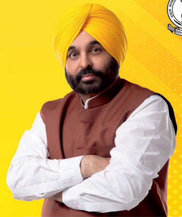
ਸ. ਭਗਵੰਤ ਸਿੰਘ ਮਾਨ ਮੁੱਖ ਮੰਤਰੀ, ਪੰਜਾਬ