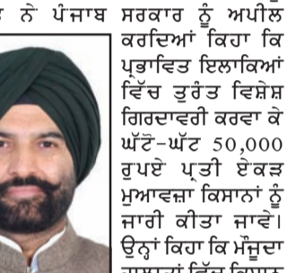
ਪਹਿਲਾਂ ਹੀ ਕਰਜ਼ੇ ਅਤੇ ਵਧ ਰਹੀ ਲਾਗਤਾਂ ਨਾਲ ਜੂਝ ਰਹੇ ਹਨ, ਅਤੇ

ਮੁਆਵਜ਼ੇ ਦੀ ਮੰਗ : ਪੰਜੂ ਇਸ ਤਰ੍ਹਾਂ ਦੀ ਕੁਚਰਤੀ ਆਫ਼ਤ ਨੂੰ ਉਨ੍ਹਾਂ ਦੀ ਹਾਲਤ ਹੋਰ ਵੀ ਨਾਜ਼ੁਕ ਬਣਾ ਦਿੱਤੀ ਹੈ। ਉਨ੍ਹਾਂ ਕੇਂਦਰ ਸਰਕਾਰ ਨੂੰ ਵੀ ਅਪੀਲ ਕੀਤੀ ਕਿ ਪੰਜਾਬ ਦੇ ਕਿਸਾਨਾਂ ਦੀ ਮਦਦ ਲਈ ਵਿਸ਼ੇਸ਼ ਪ੍ਰੋਜੈਕਟ ਦਾ ਐਲਾਨ ਕੀਤਾ ਜਾਵੇ, ਤਾਂ ਜੋ ਇਸ ਅੱਧੇ ਸਮੇਂ ਵਿੱਚ ਕਿਸਾਨਾਂ ਨੂੰ ਰਾਹਤ ਮਿਲ ਸਕੇ। ਉਨ੍ਹਾਂ ਕਿਹਾ ਕਿ ਤਹਿ ਕੀਤੀ ਰਕਮ ਨਾਲ ਤਾਂ ਕਿਸਾਨਾਂ ਦੀ ਫ਼ਸਲ ਦੀ ਲਾਗਤ ਵੀ ਪੂਰੀ ਨਹੀਂ ਹੁੰਦੀ। ਉਨ੍ਹਾਂ ਇਹ ਵੀ ਮੁੱਖ ਕੀਤੀ ਕਿ ਜਿਨ੍ਹਾਂ ਕਿਸਾਨਾਂ ਨੇ ਜ਼ਮੀਨ ਨੌਕੇ 'ਤੇ ਲੈ ਕੇ ਖੇਤੀ ਕੀਤੀ ਹੈ, ਉਨ੍ਹਾਂ ਦੇ ਨੁਕਸਾਨ ਦੀ ਰਕਮ ਵੀ ਲਈ ਸਰਕਾਰ ਨੂੰ ਗੰਭੀਰਤਾ ਨਾਲ ਸੋਚਣਾ ਚਾਹੀਦਾ ਹੈ।