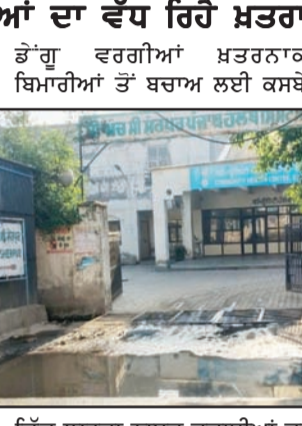
ਸ਼ੇਰਪੁਰ ਵਰਗੀਆਂ ਖ਼ਤਰਨਾਕ ਬਿਮਾਰੀਆਂ ਤੋਂ ਬਚਾਅ ਲਈ ਕਸਬੇ

ਪ੍ਰਸ਼ਾਸਨ ਸ਼ੁੱਠਾ-ਬਿਮਾਰੀਆਂ ਦਾ ਵੱਧ ਰਿਹੇ ਖ਼ਤਰਾ ਸ਼ੇਰਪੁਰ, 9 ਅਪ੍ਰੈਲ (ਬਲਜੀਤ ਸਿੰਘ ਟਿੱਬਾ) : ਸਥਾਨਕ ਕਸਬਾ ਸ਼ੇਰਪੁਰ ਦਾ ਕਮਿਊਨਿਟੀ ਹੈਲਥ ਸੈਂਟਰ ਪਿਛਲੇ ਕਈ ਮਹੀਨਿਆਂ ਤੋਂ ਗੰਦੇ ਪਾਣੀ ਦੀ ਗੰਭੀਰ ਸਮੱਸਿਆ ਨਾਲ ਜੂਝ ਰਿਹਾ ਹੈ, ਜਿਸ ਕਾਰਨ ਇਲਾਕਾ ਵਾਸੀਆਂ ਵਿੱਚ ਚਿੰਤਾ ਦਾ ਮਾਹੌਲਾ ਬਣਿਆ ਹੋਇਆ ਹੈ। ਹਸਪਤਾਲ ਦਾ ਮੁੱਖ ਦਰਵਾਜ਼ਾ ਪਿਛਲੇ ਲਗਭਗ ਦੋ ਮਹੀਨਿਆਂ ਤੋਂ ਗੰਦੇ ਪਾਣੀ ਨਾਲ ਭਰਿਆ ਪਿਆ ਹੈ ਅਤੇ ਨਾਲ ਲੱਗਦੇ ਨਾਲੇ