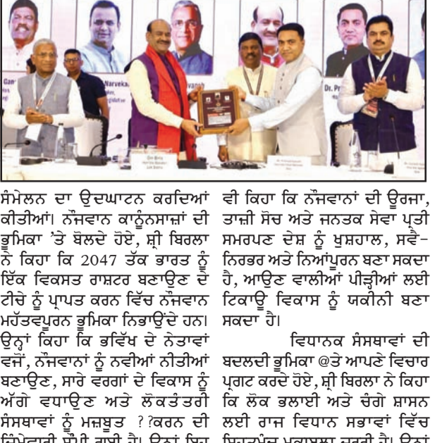
ਸੰਮੇਲਨ ਦਾ ਉਦਘਾਟਨ ਕਰਦਿਆਂ ਕੀਤੀਆਂ। ਨੌਜਵਾਨ ਕਾਨੂੰਨਸਾਜ਼ਾਂ ਦੀ ਭੂਮਿਕਾ 'ਤੇ ਬੋਲਦੇ ਹੋਏ, ਸ਼੍ਰੀ ਬਿਰਲਾ ਨੇ ਕਿਹਾ ਕਿ 2047 ਤੱਕ ਭਾਰਤ ਨੂੰ ਇੱਕ ਵਿਕਸਤ ਰਾਸ਼ਟਰ ਬਣਾਉਣ ਦੇ ਤੀਰੇ ਨੂੰ ਪ੍ਰਾਪਤ ਕਰਨ ਵਿੱਚ ਨੌਜਵਾਨ ਮਹੱਤਵਪੂਰਨ ਭੂਮਿਕਾ ਨਿਭਾਉਂਦੇ ਹਨ। ਉਨ੍ਹਾਂ ਕਿਹਾ ਕਿ ਭਵਿੱਖ ਦੇ ਨੌਤਾਵਾਂ ਵਜੋਂ, ਨੌਜਵਾਨਾਂ ਨੂੰ ਨਵੀਆਂ ਨੀਤੀਆਂ ਬਣਾਉਣ, ਸਾਰੇ ਵਰਗਾਂ ਦੇ ਵਿਕਾਸ ਨੂੰ ਅੱਗੇ ਵਧਾਉਣ ਅਤੇ ਲੋਕਤੰਤਰੀ ਸੰਸਥਾਵਾਂ ਨੂੰ ਮਜ਼ਬੂਤ 'ਕਰਨ ਦੀ ਜ਼ਿੰਮੇਵਾਰੀ ਸੌਂਪੀ ਗਈ ਹੈ। ਉਨ੍ਹਾਂ ਇਹ

ਪਣਜੀ, 9 ਅਪ੍ਰੈਲ (ਚ.ਨ.ਸ.): ਲੋਕ ਸਭਾ ਸਪੀਕਰ ਸ਼੍ਰੀ ਓਮ ਬਿਰਲਾ ਨੇ ਅੱਜ ਕਾਨੂੰਨਸਾਜ਼ਾਂ ਨੂੰ ਆਪਣੇ ਨਿੱਜੀ ਅਤੇ ਰਾਜਨੀਤਿਕ ਚਿੱਤਾਂ ਤੋਂ ਉਪਰ ਉੱਠਣ ਅਤੇ ਪੂਰੀ ਇਮਾਨਦਾਰੀ ਨਾਲ ਲੋਕਾਂ ਦੀਆਂ ਉਮੀਦਾਂ ਅਤੇ ਇੱਛਾਵਾਂ ਨੂੰ ਪੂਰਾ ਕਰਨ ਦੀ ਅਪੀਲ ਕੀਤੀ। ਉਨ੍ਹਾਂ ਕਿਹਾ ਕਿ ਚੁਣੇ ਹੋਏ ਪ੍ਰਤੀਨਿਧੀਆਂ ਦੀ ਜ਼ਿੰਮੇਵਾਰੀ ਹੈ ਕਿ ਉਹ ਜਨਤਕ ਉਮੀਦਾਂ ਨੂੰ ਪੂਰਾ ਕਰਨ, ਲੋਕਤੰਤਰੀ ਸੰਸਥਾਵਾਂ ਨੂੰ ਮਜ਼ਬੂਤ ਕਰਨ ਅਤੇ ਪਾਰਦਰਸ਼ੀ, ਸਮਾਵੇਸ਼ੀ ਅਤੇ ਜਵਾਬਦੇਹ ਸ਼ਾਸਨ ਨੂੰ ਯਕੀਨੀ ਬਣਾਉਣ। ਉਨ੍ਹਾਂ ਇਸ ਗੱਲ 'ਤੇ ਵੀ ਜ਼ੋਰ ਦਿੱਤਾ ਕਿ ਜਨਤਾ ਦੇ ਵਿਸ਼ਵਾਸ ਨੂੰ ਬਣਾਈ ਰੱਖਣ ਲਈ ਦ੍ਰਿਸ਼ਟੀ, ਸਮਰਪਣ ਅਤੇ ਜਨਤਕ ਭਲਾਈ ਪ੍ਰਤੀ ਮਜ਼ਬੂਤ ਵਚਨਬੱਧਤਾ ਜ਼ਰੂਰੀ ਹੈ। ਇਹ ਗੁਣ ਇੱਕ ਉਤਸਾਹ, ਨਿਆਪੂਰਨ ਅਤੇ ਸਵੈ-ਨਿਰਭਰ ਭਾਰਤ ਬਣਾਉਣ ਲਈ ਜ਼ਰੂਰੀ ਹਨ। ਸ਼੍ਰੀ ਬਿਰਲਾ ਨੇ ਇਹ ਦਿੱਖਾਇਆ ਕਿ ਰਾਸ਼ਟਰਮੰਡਲ ਸੰਸਦੀ ਐਸੋਸੀਏਸ਼ਨ, ਭਾਰਤ ਖੇਤਰ, ਜ਼ੋਨ VII ਦੇ ਪਹਿਲੇ