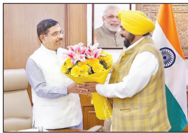
ਇਸ ਦਖਲ ਦੇ ਨਾਲ-ਨਾਲ ਮੁੱਖ ਮੰਤਰੀ ਭਗਵੰਤ ਸਿੰਘ ਮਾਨ ਨੇ ਪੰਜਾਬ 'ਤੇ ਬੋਝ ਬਣੇ ਵਾਚਾਰਾ ਮੁੱਦਿਆਂ ਦੇ ਹੱਲ 'ਤੇ ਜ਼ੋਰ ਦਿੱਤਾ, ਜਿਸ ਵਿੱਚ ਉੱਚ ਨਕਦ ਕਰਜ਼ਾ ਵਿਆਜ ਦਰਾਂ, ਪੇਂਡੂ ਵਿਕਾਸ ਫੰਡ ਅਧੀਨ ਲੰਬਿਤ 9,000 ਪੰਜਾਬ ਨਾਲ (ਬਾਕੀ ਸਫ਼ਾ 2 'ਤੇ)

ਚੰਡੀਗੜ੍ਹ, 10 ਅਪ੍ਰੈਲ : ਪੰਜਾਬ ਦੇ ਮੁੱਖ ਮੰਤਰੀ ਭਗਵੰਤ ਸਿੰਘ ਮਾਨ ਨੇ ਅੱਜ ਨਵੀਂ ਦਿੱਲੀ ਵਿਖੇ ਕੇਂਦਰੀ ਖ਼ਰਾਬੇ ਅਤੇ ਜਨਤਕ ਵੱਡੇ ਮੰਤਰੀ ਪ੍ਰਹਿਲਾਦ ਜੋਸ਼ੀ ਨਾਲ ਮੁਲਾਕਾਤ ਕੀਤੀ। ਮੁਲਾਕਾਤ ਦੌਰਾਨ ਉਨ੍ਹਾਂ ਨੇ ਸੂਬੇ ਦੇ ਕਿਸਾਨਾਂ ਅਤੇ ਮੰਡੀਆਂ ਲਈ ਕਈ ਅਹਿਮ ਰਾਹਤ ਉਪਾਅ ਯੋਜਨਾ ਬਣਾਏ। ਇਸ ਦੌਰਾਨ ਕੇਂਦਰ ਨੇ ਪੰਜਾਬ ਵਿੱਚ ਪਏ 155 ਲੱਖ ਮੀਟ੍ਰਿਕ ਟਨ ਅਨਾਜ ਦੀ ਲਿਫਟਿੰਗ ਲਈ ਵਿਸ਼ੇਸ਼ ਰੇਲ ਗੱਡੀਆਂ ਚਲਾਉਣ ਲਈ ਸਹਿਮਤੀ ਦਿੱਤੀ ਜਿਸ ਨਾਲ ਹਾੜੀ ਮੰਡੀਕਰਨ ਸੀਜ਼ਨ ਤੋਂ ਪਹਿਲਾਂ ਸੂਬੇ ਵਿੱਚ ਅਨਾਜ ਦੇ ਭੰਡਾਰਨ ਸਬੰਧੀ ਗੰਭੀਰ ਸੰਕਟ ਨਾਲ ਨਜਿੱਠਣ ਵਿੱਚ ਮਦਦ ਮਿਲੇਗੀ।