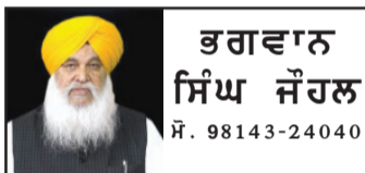
ਉਘ ਲੇਖਕ ਤੇ ਮੀਡੀਆ ਵਿਸ਼ਲੇਸ਼ਕ

ਪਹਿਨਣ ਵਾਲੇ ਬਸਤਰਾਂ ਵਿੱਚ ਅਹਿਮ ਸਥਾਨ ਰੱਖਦੀ ਹੈ। ਇਸ ਦਸਤਾਰ ਤੋਂ ਬਿਨਾਂ ਸਿੱਖ ਦਾ ਸਰੂਪ ਕਿਆਸਿਆ ਵੀ ਨਹੀਂ ਜਾ ਸਕਦਾ। ਸੱਟ ਸਮੇਂ ਜਾਂ ਅਰਾਮ ਕਰਨ ਸਮੇਂ ਫੋਟੋ ਦਸਤਾਰ ਸਜਾਉਣਾ ਸਿੱਖ ਲਈ ਲਾਜ਼ਮੀ ਹੈ, ਜਿਸ ਨੂੰ ਕੇਸਰੀ ਦਾ ਨਾਂਅ ਦਿੱਤਾ ਗਿਆ ਹੈ। ਆਮ ਤੌਰ 'ਤੇ ਅੰਮ੍ਰਿਤਧਾਰੀ ਸਿੱਖ ਦਸਤਾਰ ਦੇ ਹੇਠਾਂ ਕੇਸਰੀ ਸਜਾਉਂਦੇ ਹਨ। ਭਾਵੇਂ ਇਸ ਖਿੱਤੇ ਦੇ ਕੁਝ ਦੇਸ਼ਾਂ ਵਿੱਚ ਸਿਰ ਨੂੰ ਢੱਕਣ ਲਈ ਮੁੱਢ-ਕਦੀਮ ਤੋਂ ਪਗੜੀ ਦੀ ਵਰਤੋਂ ਹੁੰਦੀ ਆਈ ਹੈ। ਪਰ ਆਰੀਆ ਸੱਭਿਅਤਾ ਦੇ ਲੋਕਾਂ ਵਿੱਚ ਪਗੜੀ ਬੰਨਣ ਦਾ ਰਿਵਾਜ ਬਹੁਤ ਪੁਰਾਣਾ ਹੈ। ਪੰਜਾਬ ਦੀ ਸੱਭਿਅਤਾ ਵਿੱਚ ਦਸਤਾਰ ਧਾਰਨ ਕਰਨੀ ਸਾਡੇ ਸਮਾਜ ਅਤੇ ਸੱਭਿਆਚਾਰ ਦਾ ਹਿੱਸਾ ਰਿਹਾ ਹੈ। ਹਰ ਧਰਮ ਤੇ ਜਾਤ ਦੇ ਲੋਕ ਦਸਤਾਰ ਸਜਾਉਂਦੇ ਰਹੇ ਹਨ।