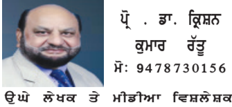
ਉਘ ਲੇਖਕ ਤੇ ਮੀਡੀਆ ਵਿਸ਼ਲੇਸ਼ਕ

ਅੱਜ ਨਵੀਂ ਪੰਜਾਬੀ ਚੇਤਨਾ ਦੀ ਲੋੜ-ਜੋ ਧਰਮ, ਖੇਤੀ ਅਤੇ ਆਧੁਨਿਕਤਾ ਨੂੰ ਇੱਕਠਾ ਲੈ ਕੇ ਚੱਲੇ