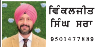
ਉਘ ਲੇਖਕ ਤੇ ਮੀਡੀਆ ਵਿਸ਼ਲੇਸ਼ਕ

ਅੱਜ ਵਿਦੇਸ਼ਾਂ ਵਿੱਚ ਵੱਸਦੇ ਪੰਜਾਬੀ ਵੀ ਵੱਡੀ ਗਿਣਤੀ ਵਿੱਚ ਵਿਸਾਖੀ ਮਨਾਉਂਦੇ ਹਨ - ਟੋਰਾਂਟੋ, ਵੈਨਕੂਵਰ, ਲੰਡਨ ਅਤੇ ਨਿਊਯਾਰਕ ਵਿੱਚ ਵੱਡੀਆਂ ਪਛਾਣ ਨੂੰ ਵਿਸ਼ਵ ਪੱਧਰ ਤੱਕ ਲੈ ਕੇ ਜਾਂਦੇ ਹੋ। ਬਦਲਦਾ ਪੰਜਾਬ ਅਤੇ ਵਿਸਾਖੀ ਦੀ ਨਵੀਂ ਪਹਿਚਾਣਸਮੇਂ ਨਾਲ ਪੰਜਾਬ ਬਦਲਿਆ ਹੈ ਅਤੇ ਵਿਸਾਖੀ ਵੀ ਬਦਲੀ ਹੈ।