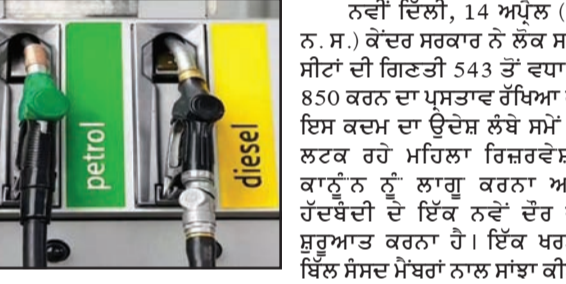
ਦੇਸ਼ 'ਚ ਪੈਟਰੋਲ 18 ਰੁ. ਤੇ ਡੀਜ਼ਲ 35 ਰੁਪਏ ਤੱਕ ਹੋਵੇਗਾ ਮਹਿੰਗਾ ! (ਬਾਕੀ ਸਫ਼ਾ 2 'ਤੇ)

ਨਵੀਂ ਦਿੱਲੀ, 14 ਅਪ੍ਰੈਲ (ਚ. ਨ. ਸ.) : ਅਮਰੀਕਾ-ਈਰਾਨ ਵਿੱਚ ਚੱਲ ਰਿਹਾ ਵਿਵਾਦ ਭਾਰਤੀ ਤੇਲ ਕੰਪਨੀਆਂ ਨੂੰ ਪ੍ਰਭਾਵਿਤ ਕਰ ਰਿਹਾ ਹੈ। ਸਰਕਾਰੀ ਤੇਲ ਕੰਪਨੀਆਂ ਲਈ ਪੈਟਰੋਲ ਅਤੇ ਡੀਜ਼ਲ ਵੇਚਣਾ ਘਾਟੇ ਵਾਲਾ ਸੌਦਾ ਬਣਦਾ ਜਾ ਰਿਹਾ ਹੈ। ਇਸ ਵੇਲੇ ਉਹ ਪੈਟਰੋਲ 'ਤੇ ਲਗਭਗ 18 ਰੁਪਏ ਪ੍ਰਤੀ ਲੀਟਰ ਅਤੇ ਡੀਜ਼ਲ 'ਤੇ ਲਗਭਗ 35 ਰੁਪਏ ਪ੍ਰਤੀ ਲੀਟਰ ਦਾ ਨੁਕਸਾਨ ਕਰ ਰਹੇ ਹਨ। ਵਪਾਰੀਆਂ ਕੀਮਤਾਂ ਦੇ ਬਾਵਜੂਦ ਪ੍ਰਚੁਰ ਕੀਮਤਾਂ ਵਿੱਚ ਕੋਈ ਬਦਲਾਅ ਨਹੀਂ ਆਇਆ ਹੈ। ਇਸ ਨਾਲ ਕੰਪਨੀਆਂ ਲਈ ਵਧਦਾ ਘਾਟਾ ਹੋ ਰਿਹਾ ਹੈ, ਜਿਸ ਨਾਲ ਕੀਮਤਾਂ ਵਿੱਚ ਵਾਧੇ ਦੀ ਸੰਭਾਵਨਾ ਵੱਧ ਰਹੀ ਹੈ। ਵਿਦੇਸ਼ੀ ਖ਼ਰੋਚਕ ਫਰਮ ਮੈਕਵੇਰੀ ਦੀ ਇੱਕ ਰਿਪੋਰਟ ਵਿੱਚ ਕਿਹਾ ਗਿਆ ਹੈ ਕਿ ਕੱਚੇ ਤੇਲ ਦੀਆਂ ਉੱਚੀਆਂ ਕੀਮਤਾਂ ਦੇ ਬਾਵਜੂਦ ਦੇਸ਼ ਵਿੱਚ ਪੈਟਰੋਲ ਅਤੇ ਡੀਜ਼ਲ ਦੀਆਂ ਕੀਮਤਾਂ ਸਥਿਰ ਹਨ।