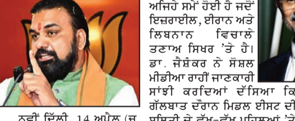
ਸਮਰਾਟ ਚੌਧਰੀ ਹੋਣਗੇ ਬਿਹਾਰ ਦੇ ਨਵੇਂ ਮੁੱਖ ਮੰਤਰੀ (ਬਾਕੀ ਸਫ਼ਾ 2 'ਤੇ)

ਨਵੀਂ ਦਿੱਲੀ, 14 ਅਪ੍ਰੈਲ (ਚ. ਨ. ਸ.) : ਸਮਰਾਟ ਚੌਧਰੀ ਨੂੰ ਬਿਹਾਰ ਦਾ ਨਵਾਂ ਮੁੱਖ ਮੰਤਰੀ ਚੁਣੇ ਜਾਣ 'ਤੇ ਮੋਹ ਲੱਗ ਗਈ ਹੈ। (ਬਾਕੀ ਸਫ਼ਾ 2 'ਤੇ)