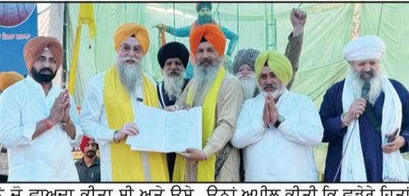
ਮੋਰਚੇ ਨੇ ਪੰਜਾਬ ਸਰਕਾਰ ਵੱਲੋਂ ਬਿੱਲ ਪਾਸ ਕਰਨ ਨੂੰ ਸ਼ਲਾਘਾਯੋਗ ਤੇ ਸਵਾਗਤਯੋਗ ਕਦਮ ਦੱਸਿਆ। (ਬਾਕੀ ਸਫ਼ਾ 2 'ਤੇ)