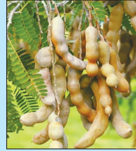
ਸਿਰਫ਼ ਚਟਨੀ ਦਾ ਸਵਾਦ ਵਧਾਉਣ ਲਈ ਹੀ ਨਹੀਂ,

ਜਦੋਂ ਵੀ ਇਮਲੀ ਦਾ ਨਾਮ ਲਿਆ ਜਾਂਦਾ ਹੈ, ਤਾਂ ਸਭ ਦੇ ਮੂੰਹ ਠਹਿਕਾਣੀਆਂ ਆ ਜਾਂਦੀਆਂ ਹਨ ਪਰ ਕੀ ਤੁਸੀਂ ਜਾਣਦੇ ਹੋ ਕਿ ਇਹ ਖੱਟੀ-ਮਿੱਠੀ ਇਮਲੀ