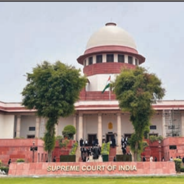
ਕਿ ਆਲ ਇੰਡੀਆ ਸੇਵਾਵਾਂ ਦੀ ਸਿਰਜਣਾ ਦੇ ਪਿੱਛੇ ਦਾ ਉਦੇਸ਼ ਹੀ ਫੇਲ੍ਹ ਹੋ ਰਿਹਾ ਹੈ। ਚੀਫ਼ ਜਸਟਿਸ ਨੇ ਨੋਟ ਕੀਤਾ ਕਿ ਪੱਛਮੀ ਬੰਗਾਲ ਵਿੱਚ ਵੋਟ ਸੂਚੀਆਂ ਦੀ ਵਿਸ਼ੇਸ਼ ਸੋਧ ਦੀ ਵਰਤੋਂ ਦੌਰਾਨ, ਅਦਾਲਤ ਨੂੰ ਸਬੰਧਤ ਧਿਰਾਂ ਵਿਚਕਾਰ ਵਿਸ਼ਵਾਸ ਦੀ ਘਾਟ ਕਾਰਨ ਨਿਆਂਇਕ ਅਧਿਕਾਰੀਆਂ ਦੀ ਨਿਯੁਕਤੀ ਕਰਨੀ ਪਈ। ਬੈਂਚ ਨੇ ਟਿੱਪਣੀ ਕੀਤੀ ਕਿ ਉਹ ਚੋਣ

ਨਵੀਂ ਦਿੱਲੀ, 16 ਅਪ੍ਰੈਲ : ਪੱਛਮੀ ਬੰਗਾਲ ਸਰਕਾਰ ਅਤੇ ਚੋਣ ਕਮਿਸ਼ਨ ਵਿਚਕਾਰ ਅਵਿਸ਼ਵਾਸ ਨੂੰ ਉਜਾਗਰ ਕਰਦੇ ਹੋਏ, ਸੁਪਰੀਮ ਕੋਰਟ ਨੇ ਵੀਰਵਾਰ ਨੂੰ ਚੋਣ ਸੰਸਥਾ ਵੱਲੋਂ ਸੂਬੇ ਵਿੱਚ 1,00,00 ਤੋਂ ਵੱਧ ਪ੍ਰਸ਼ਾਸਨਿਕ ਅਤੇ ਪੁਲਿਸ ਅਧਿਕਾਰੀਆਂ ਦੇ ਤਬਦੀਲੀ ਨੂੰ ਚੁਣੌਤੀ ਦੇਣ ਵਾਲੀ ਇੱਕ ਪਟੀਸ਼ਨ ਖਾਰਜ ਕਰ ਦਿੱਤੀ। ਜਦਕਿ ਸੁਪਰੀਮ ਕੋਰਟ ਨੇ ਇਸ ਵਿਵਾਦਪੂਰਨ ਕਾਨੂੰਨੀ ਸਵਾਲ ਨੂੰ ਭੜਿੱਕ ਵਿੱਚ ਵਿਚਾਰ ਲਈ ਖੁੱਲ੍ਹਾ ਡੱਬ ਦਿੱਤਾ ਕਿ ਕੀ ਚੋਣ ਕਮਿਸ਼ਨ ਨੂੰ ਚੋਣਾਂ ਵਾਲੇ ਰਾਜਾਂ ਵਿੱਚ ਪ੍ਰਸ਼ਾਸਕੀ ਤਬਦੀਲੀਆਂ ਲਾਗੂ ਕਰਨ ਤੋਂ ਪਹਿਲਾਂ