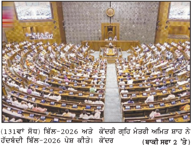
(131ਵਾਂ ਸੋਧ) ਬਿੱਲ-2026 ਅਤੇ ਹੱਦਬੰਦੀ ਬਿੱਲ-2026 ਪੇਸ਼ ਕੀਤੇ।

ਨਵੀਂ ਦਿੱਲੀ, 16 ਅਪ੍ਰੈਲ : ਲੋਕ ਸਭਾ ਵਿਚ ਮਹਿਲਾ ਰਾਖਵਾਂਕਰਨ ਸੋਧ ਬਿੱਲ, ਹੱਦਬੰਦੀ ਬਿੱਲ-2026 ਤੇ ਸੰਵਿਧਾਨ (ਇੱਕ ਸੌ ਇਕੱਤੀਵਾਂ ਸੋਧ) ਬਿੱਲ-2026 ਪੇਸ਼ ਕਰ ਦਿੱਤੇ ਗਏ। ਭੇਦ ਘੱਟੋ ਘੱਟ ਆਦਿ ਵੇਟਿੰਗ ਹੋਈ ਕਿ ਬਿੱਲਾਂ 'ਤੇ ਚਰਚਾ ਕੀਤੀ ਜਾਵੇ ਕਿ ਨਹੀਂ। ਪੱਖ ਵਿਚ 251 ਵੋਟਾਂ ਪਈਆਂ ਤੇ 185 ਸਾਂਸਦਾਂ ਨੇ ਵਿਰੋਧ ਕੀਤਾ। ਸੰਸਦ ਦੇ ਇਕ ਵਿਸ਼ੇਸ਼ ਸੈਸ਼ਨ ਦੌਰਾਨ ਸਰਕਾਰ ਨੇ ਲੋਕ ਸਭਾ ਵਿਚ ਤਿੰਨ ਮਹੱਤਵਪੂਰਨ ਬਿੱਲ ਪੇਸ਼ ਕਰਨ ਦੀ ਪ੍ਰਕਿਰਿਆ ਸ਼ੁਰੂ ਕੀਤੀ। ਕਾਨੂੰਨ ਮੰਤਰੀ ਅਰਜੁਨ ਰਾਮ ਮੇਘਵਾਲ ਨੇ ਸੰਵਿਧਾਨ