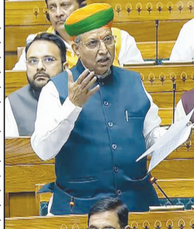
ਅੰਕੜਾ ਸਿੱਧੇ ਤੌਰ 'ਤੇ ਔਰਤਾਂ ਲਈ 33 ਫੀਸਦੀ ਰਾਖਵਾਂਕਰਨ ਦੇ ਫਾਰਮੂਲੇ ਦੁਆਰਾ ਦਿੱਤਾ ਹੈ। ਉਨ੍ਹਾਂ ਕਿਹਾ ਕਿ ਮੌਜੂਦਾ ਸੀਟਾਂ ਦੀ ਗਿਣਤੀ ਵਿੱਚ ਲਗਭਗ 50 ਫੀਸਦੀ ਦਾ ਵਾਧਾ ਕੀਤਾ

ਨਵੀਂ ਦਿੱਲੀ, 16 ਅਪ੍ਰੈਲ : ਕੇਂਦਰੀ ਕਾਨੂੰਨ ਮੰਤਰੀ ਅਰਜੁਨ ਰਾਮ ਮੇਘਵਾਲ ਨੇ ਅੱਜ ਲੋਕ ਸਭਾ ਵਿੱਚ ਸਪੱਸ਼ਟ ਕੀਤਾ ਕਿ ਨਵੇਂ ਪ੍ਰਸਤਾਵਿਤ ਕਾਨੂੰਨ ਤਹਿਤ ਹੋਣੇ ਵਾਲੇ ਲੋਕ ਸਮਰੱਥਾ ਵਧਾ ਕੇ 815 ਕੀਤੀ ਜਾਵੇਗੀ। ਇਨ੍ਹਾਂ ਵਿੱਚੋਂ 272 ਸੀਟਾਂ ਔਰਤਾਂ ਲਈ ਰਾਖਵੀਆਂ ਹੋਣਗੀਆਂ। ਮਹਿਲਾ ਰਾਖਵਾਂਕਰਨ ਕਾਨੂੰਨ ਅਤੇ ਹੱਦਬੰਦੀ ਸਬੰਧੀ ਬਿੱਲਾਂ 'ਤੇ ਚਰਚਾ ਦੀ ਸ਼ੁਰੂਆਤ ਕਰਦਿਆਂ ਮੰਤਰੀ ਨੇ ਭਰੋਸਾ ਦਿੱਤਾ ਕਿ ਇਸ ਨੂੰ ਵਿਵਸਥਾ ਨਾਲ ਨਾ ਤਾਂ ਪੂਰਜ ਮੋਬਰਾ ਦੇ ਹਿੱਤ ਪ੍ਰਭਾਵਿਤ ਹੋਣਗੇ ਅਤੇ ਨਾ ਹੀ ਕਿਸੇ ਸੂਬੇ ਦੀ ਨੁਮਾਇੰਦਗੀ ਵਿੱਚ ਕੋਈ ਕਮੀ ਆਵੇਗੀ।