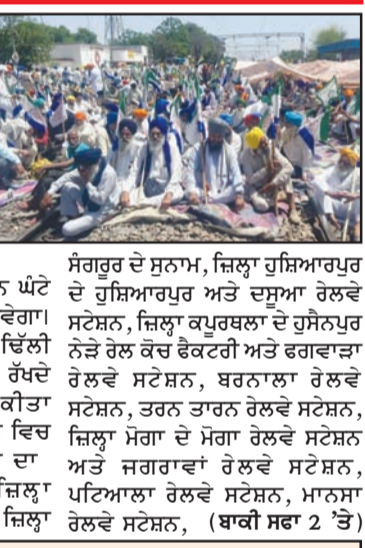
ਸੰਗਰੂਰ ਦੇ ਸੁਨਾਮ, ਜ਼ਿਲ੍ਹਾ ਗੁਜ਼ਿਆਰਪੁਰ ਦੇ ਗੁਜ਼ਿਆਰਪੁਰ ਅਤੇ ਦੁਆਬਾ ਰੇਲਵੇ ਸਟੇਸ਼ਨ, ਜ਼ਿਲ੍ਹਾ ਕਪੂਰਥਲਾ ਦੇ ਹੁਸੈਨਪੁਰ ਨੇੜੇ ਰੇਲ ਰੋਕੋ ਫੈਕਟਰੀ ਅਤੇ ਫਗਵਾੜਾ ਰੇਲਵੇ ਸਟੇਸ਼ਨ, ਬਰਨਾਲਾ ਰੇਲਵੇ ਸਟੇਸ਼ਨ, ਤਰਨ ਤਾਰਨ ਰੇਲਵੇ ਸਟੇਸ਼ਨ, ਜ਼ਿਲ੍ਹਾ ਮੋਗਾ ਦੇ ਮੋਗਾ ਰੇਲਵੇ ਸਟੇਸ਼ਨ ਅਤੇ ਜਗਵਾੜਾ ਰੇਲਵੇ ਸਟੇਸ਼ਨ, ਪਟਿਆਲਾ ਰੇਲਵੇ ਸਟੇਸ਼ਨ, ਮਾਨਸਾ ਅੰਮ੍ਰਿਤਸਰ ਦੇ ਦੇਵੀਦਾਪੁਰਾ, ਜ਼ਿਲ੍ਹਾ

ਚੰਡੀਗੜ੍ਹ, 16 ਅਪ੍ਰੈਲ : ਭਲਕੇ 17 ਮਾਰਚ ਨੂੰ ਕਿਸਾਨ ਮਜ਼ਦੂਰ ਮੋਰਚਾ ਚੋਪਟਰ ਪੰਜਾਬ ਦੀਆਂ ਜਥੇਬੰਦੀਆਂ ਅਤੇ ਐੱਸ.ਕੇ.ਐਮ. ਚੋਪਟਰ ਪੰਜਾਬ ਦੀਆਂ ਪੰਜ ਜਥੇਬੰਦੀਆਂ ਅਤੇ ਏ.ਕੇ.ਐਮ. ਪੰਜਾਬ ਦੇ ਸਭਿਯੋਗ ਨਾਲ ਸਮੁੱਚੇ ਪੰਜਾਬ ਵਿਚ ਤਿੰਨ ਘੰਟੇ ਰੇਲਾਂ ਦਾ ਚੱਕਾ ਜਾਮ ਕੀਤਾ ਜਾਵੇਗਾ। ਇਹ ਚੱਕਾ ਜਾਮ ਕਣਕ ਦੀ ਵਿੱਲੀ ਖਰੀਦਦਾਰੀ ਨੂੰ ਧਿਆਨ ਵਿਚ ਰੱਖਦੇ ਹੋਏ 12 ਤੋਂ 3 ਵਜੇ ਤੱਕ ਕੀਤਾ ਜਾਵੇਗਾ। ਭਲਕੇ ਸਮੁੱਚੇ ਪੰਜਾਬ ਵਿਚ ਹੋਣ ਵਾਲੇ ਰੇਲ ਰੋਕੋ ਪ੍ਰੋਗਰਾਮ ਦਾ ਵੇਰਵਾ ਇਸ ਪ੍ਰਕਾਰ ਹੈ: ਜ਼ਿਲ੍ਹਾ ਅੰਮ੍ਰਿਤਸਰ ਦੇ ਦੇਵੀਦਾਪੁਰਾ, ਜ਼ਿਲ੍ਹਾ