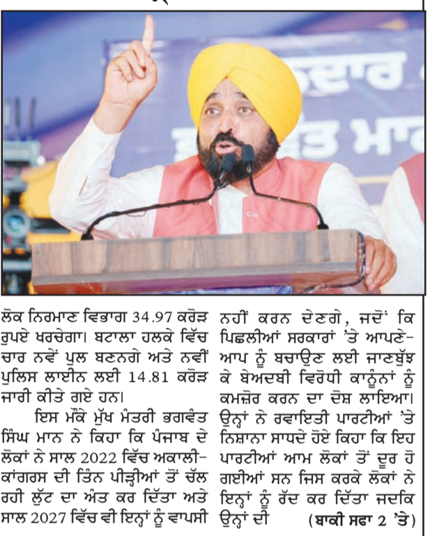
ਲੋਕ ਨਿਗਮਾਂ ਵਿਭਾਗ 34.97 ਕਰੋੜ ਰੁਪਏ ਖਰਚੇਗਾ। ਬਟਾਲਾ ਹਲਕੇ ਵਿੱਚ ਚਾਰ ਨਵੇਂ ਪੁਲ ਬਣਾਏ ਅਤੇ ਨਵੀਂ ਪੁਲਿਸ ਲਾਈਨ ਲਈ 14.81 ਕਰੋੜ ਜਾਰੀ ਕੀਤੇ ਗਏ ਹਨ।

ਬਟਾਲਾ, 16 ਅਪ੍ਰੈਲ : ਪੰਜਾਬ ਦੇ ਇਤਿਹਾਸਕ ਨਗਰਾਂ ਵਿੱਚ ਸ਼ਾਮਲ ਬਟਾਲਾ ਦੀ ਕਾਇਮਕਾਰੀ ਕਰਨ ਲਈ ਮੁੱਖ ਮੰਤਰੀ ਭਗਵੰਤ ਸਿੰਘ ਮਾਨ ਨੇ ਅੱਜ 177 ਕਰੋੜ ਰੁਪਏ ਦੇ ਵਿਕਾਸ ਪ੍ਰਾਜੈਕਟਾਂ ਦਾ ਐਲਾਨ ਕੀਤਾ। ਇਤਿਹਾਸਕ ਨਗਰ ਦੇ ਬੁਨਿਆਦੀ ਢਾਂਚੇ ਦਾ ਵੱਡਾ ਪੱਧਰ 'ਤੇ ਵਿਸਥਾਰ ਕਰਨ ਲਈ ਵੱਖ-ਵੱਖ ਪ੍ਰਾਜੈਕਟਾਂ ਦਾ ਐਲਾਨ ਕਰਕੇ ਮੁੱਖ ਮੰਤਰੀ ਨੇ ਸੱਤਾ ਦਾ ਸੂਚਕ ਭਰਾ ਚੁੱਕੀਆਂ ਪਿਛਲੀਆਂ ਸਰਕਾਰਾਂ ਨੂੰ ਸਖ਼ਤ ਸਿਆਸੀ ਸੰਦੇਸ਼ ਦਿੱਤਾ ਹੈ। ਇੱਥੋਂ ਦੀ ਨਗਰ ਨਿਗਮ ਵੱਲੋਂ 95.72 ਕਰੋੜ ਰੁਪਏ ਦੇ ਵਿਕਾਸ ਕਾਰਜ ਕੀਤੇ ਜਾਣਗੇ, ਮੰਡੀ ਬੋਰਡ ਵੱਲੋਂ 16.05 ਕਰੋੜ ਰੁਪਏ ਦੇ ਵਿਕਾਸ ਕੰਮ ਕੀਤੇ ਜਾਣਗੇ ਅਤੇ ਲੋਕ ਨਿਗਮਾਂ ਵਿਭਾਗ ਵੱਲੋਂ ਸੜਕਾਂ ਦੇ ਨਿਰਮਾਣ 'ਤੇ 65.09 ਕਰੋੜ ਰੁਪਏ ਖਰਚੇ ਜਾਣਗੇ। ਇਸ ਤੋਂ ਇਲਾਵਾ ਸੜਕਾਂ ਦੇ ਨਵੀਨੀਕਰਨ 'ਤੇ ਮੰਡੀ ਬੋਰਡ 42.56 ਕਰੋੜ ਰੁਪਏ ਜਦਕਿ