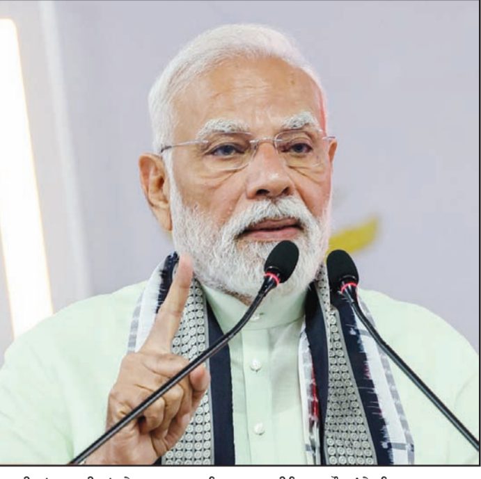
ਵਰਗੀਆਂ ਪਾਰਟੀਆਂ ਨੇ ਵਾਰ-ਵਾਰ ਇਸ ਤਿੰਨ ਬਿੱਲਾਂ (ਸੰਵਿਧਾਨਕ ਸੋਧ, ਡੀਲੀਮੀਟੇਸ਼ਨ ਅਤੇ ਯੂਟੀਜ਼ ਲਈ ਪ੍ਰਬੰਧ) ਨਾਲ ਲੋਕ ਸਭਾ ਸੀਟਾਂ 543 ਤੋਂ ਵਧਾ ਕੇ 850 ਕਰਨ ਅਤੇ 33 ਫੀਸਦੀ ਰਾਖਵੀਆਂ ਸੀਟਾਂ 2029 ਤੋਂ ਲਾਗੂ ਕਰਨ ਦਾ ਰਾਹ ਖੁੱਲ੍ਹਿਆ ਸੀ। ਪਰ ਵਿਰੋਧੀਆਂ ਨੇ ਇਸ ਨੂੰ ਰੋਕਣ ਲਈ ਉੱਤਰੀ ਰਾਜਾਂ ਵਿੱਚ ਵਧੇਰੇ ਸੀਟਾਂ ਡੀਲੀਮੀਟੇਸ਼ਨ ਨੂੰ ਉੱਤਰ ਵਿਰੋਧੀ ਦੱਸਿਆ। ਅੱਜ ਪ੍ਰਧਾਨ ਮੰਤਰੀ ਨੇ ਸਿੱਧਾ ਇਲਜ਼ਾਮ ਲਾਇਆ ਕਿ ਕਾਂਗਰਸ ਨੇ ਇੱਕ ਵਾਰ ਫਿਰ ਮਹਿਲਾਵਾਂ ਨਾਲ ਧੱਕਾ ਕੀਤਾ ਹੈ। ਉਨ੍ਹਾਂ ਕਿਹਾ ਕਿ ਜਦੋਂ ਬਿੱਲ ਭਵਿੱਖ ਵਿੱਚ ਲਾਗੂ ਹੋਣ ਵਾਲਾ ਸੀ ਤਾਂ ਵਿਰੋਧੀ ਧਿਰਾਂ ਨੇ ਇਸ ਦਾ ਸਮਰਥਨ ਕੀਤਾ, ਪਰ ਜਦੋਂ ਇਹ 2029 ਤੋਂ ਲਾਗੂ ਹੋਣ ਵਾਲਾ ਬਣ ਗਿਆ ਤਾਂ ਉਨ੍ਹਾਂ ਨੇ ਇਸ ਨੂੰ ਰੋਕਣ ਲਈ ਸਭ ਕੁਝ ਕੀਤਾ। ਇਸ ਨੂੰ ਪਾਪ ਦੱਸਦਿਆਂ ਪ੍ਰਧਾਨ ਮੰਤਰੀ ਨੇ ਚੇਤਾਵਨੀ ਦਿੱਤੀ ਕਿ ਦੇਸ਼ ਦੀਆਂ ਮਹਿਲਾਵਾਂ ਲਿਆਂਦਾ ਗਿਆ ਸੀ, ਪਰ ਕਾਂਗਰਸ