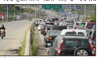
ਜੰਗਬੰਦੀ ਲਾਗੂ ਹੋ ਗਈ ਹੈ, ਪਰ ਲਿਬਨਾਨੀ ਅਧਿਕਾਰੀਆਂ ਨੇ ਲੋਕਾਂ ਨੂੰ ਤੁਰੰਤ ਖ਼ਤਰਨਾਕ ਖੇਤਰਾਂ ਵਿੱਚ ਨਾ ਜਾਣ ਦੀ ਸਲਾਹ ਦਿੱਤੀ ਹੈ। ਜੰਗ ਦੇ ਮੈਦਾਨ ਬਣੇ ਦੱਖਣੀ ਪਿੰਡਾਂ ਵਿੱਚ ਜਦੋਂ ਲੋਕ ਪਹੁੰਚੇ ਤਾਂ ਉਥੇ ਸਿਰਫ਼ ਮਲਬੇ ਦੇ ਢੇਰ ਤੋਂ ਸਜ਼ੀਆਂ ਹੋਈਆਂ ਗੱਡੀਆਂ ਹੀ ਨਜ਼ਰ ਆਈਆਂ।

ਬੋਰੂਟ/ਵਾਸ਼ਿੰਗਟਨ, 18 ਅਪ੍ਰੈਲ (ਚ.ਨ.ਸ): ਵਿਚੋਲਗੀ ਤੋਂ ਬਾਅਦ ਜੰਗਬੰਦੀ ਲਾਗੂ ਕਰਕੇ ਲਿਟਾਨੀ ਨਦੀ 'ਤੇ ਬਣੇ ਕਾਸਮੀਏ ਪੁਲ, ਜੋ ਕਿ ਇਜ਼ਰਾਈਲੀ ਹਵਾਈ ਹਮਲੇ ਵਿੱਚ ਨੁਕਸਾਨਿਆ ਗਿਆ ਸੀ, 'ਤੇ ਹਿਜ਼ਬੁੱਲਾ ਦੇ ਝੰਡੇ ਲਹਿਰਾ ਕੇ ਅਪਣੀ ਖੁਸ਼ੀ ਦਾ ਇਜ਼ਹਾਰ ਕੀਤਾ। ਇਸ ਜੰਗ ਕਾਰਨ ਲਿਬਨਾਨ ਵਿੱਚ 10 ਲੱਖ ਤੋਂ ਵੱਧ ਲੋਕ ਬੇਘਰ ਹੋ ਚੁੱਕੇ ਹਨ। ਭਾਵੇਂ ਜੰਗਬੰਦੀ ਲਾਗੂ ਹੋ ਗਈ ਹੈ, ਪਰ ਲਿਬਨਾਨੀ ਅਧਿਕਾਰੀਆਂ ਨੇ ਲੋਕਾਂ ਨੂੰ ਤੁਰੰਤ ਖ਼ਤਰਨਾਕ ਖੇਤਰਾਂ ਵਿੱਚ ਨਾ ਜਾਣ ਦੀ ਸਲਾਹ ਦਿੱਤੀ ਹੈ। ਜੰਗ ਦੇ ਮੈਦਾਨ ਬਣੇ ਦੱਖਣੀ ਪਿੰਡਾਂ ਵਿੱਚ ਜਦੋਂ ਲੋਕ ਪਹੁੰਚੇ ਤਾਂ ਉਥੇ ਸਿਰਫ਼ ਮਲਬੇ ਦੇ ਢੇਰ ਤੋਂ ਸਜ਼ੀਆਂ ਹੋਈਆਂ ਗੱਡੀਆਂ ਹੀ ਨਜ਼ਰ ਆਈਆਂ। ਇਲਾਕਿਆਂ ਵਿੱਚ ਬਹੁ-ਮੰਜ਼ਿਲਾ ਇਮਾਰਤਾਂ ਢਹਿ-ਢੇਰੀ ਹੋ ਚੁੱਕੀਆਂ ਹਨ। ਸਥਾਨਕ ਨਿਵਾਸੀਆਂ ਅਨੁਸਾਰ, ਇਜ਼ਰਾਈਲ ਨੇ ਪਿਛਲੇ ਛੇ ਹਫ਼ਤਿਆਂ ਵਿੱਚ ਸਿਰਫ਼ ਇੱਕ ਮੁਹੱਲੇ 'ਤੇ 62 ਵਾਰ ਹਮਲੇ ਕੀਤੇ ਸਨ।