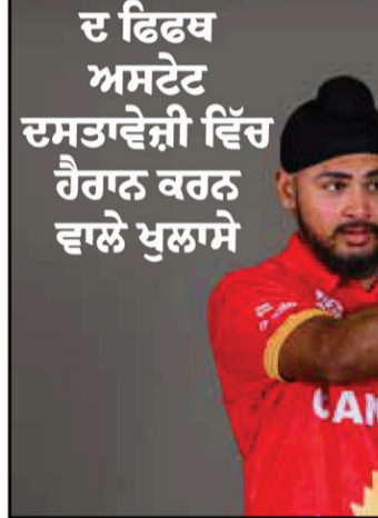
ਦ ਫਿਕਸ ਅਸਟੇਟ ਦਸਤਾਵੇਜ਼ੀ ਵਿੱਚ ਹੈਰਾਨ ਕਰਨ ਵਾਲੇ ਖੁਲਾਸੇ