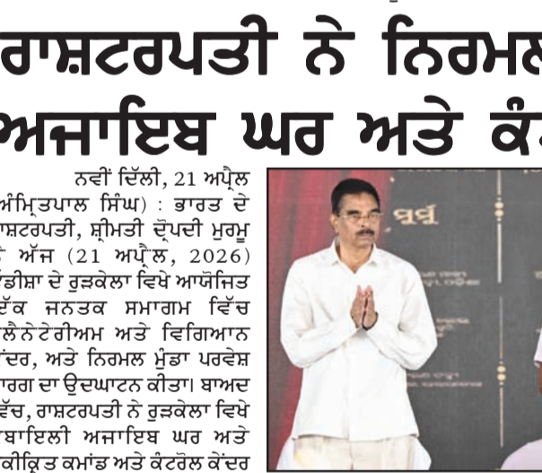
ਸੱਭਿਆਚਾਰਕ ਭਰਪੂਰਤਾ ਨੂੰ ਹੋਰ ਅਮੀਰ ਬਣਾਇਆ। ਉਨ੍ਹਾਂ ਜ਼ੋਰ ਦੇ ਕੇ ਕਿਹਾ ਕਿ ਸੁੰਦਰਗੜ੍ਹ ਬਹਾਦਰ ਵਿਅਕਤੀਆਂ ਅਤੇ ਖੇਡ ਪ੍ਰੇਮੀਆਂ ਦੀ ਧਰਤੀ ਵੀ ਹੈ। ਰਾਸ਼ਟਰਪਤੀ ਨੇ ਕਿਹਾ ਕਿ ਓਡੀਸ਼ਾ ਸਮੇਤ ਭਾਰਤ ਦੇ ਵੱਖ-ਵੱਖ ਖੇਤਰਾਂ ਦੇ ਲੋਕ ਰੁੜਕੋਲਾ ਵਿੱਚ ਰੁਜ਼ਗਾਰ ਅਤੇ ਰੋਜ਼ੀ-ਰੋਟੀ ਦੇ ਉਦੇਸ਼ਾਂ ਲਈ ਰਹਿੰਦੇ ਹਨ। ਇਸ ਵਿਸ਼ਵਵਿਆਪੀ ਸ਼ਹਿਰ ਨੂੰ ਓਡੀਸ਼ਾ ਦੀ ਕਲਾ, ਸਾਹਿਤ,

ਰਾਸ਼ਟਰਪਤੀ ਨੇ ਕਿਹਾ ਕਿ ਸੁੰਦਰਗੜ੍ਹ ਦੀ ਕੁਦਰਤੀ ਸੁੰਦਰਤਾ, ਲੋਕ ਸੱਭਿਆਚਾਰ ਅਤੇ ਵਿਰਾਸਤ ਇੱਕ ਆਕਰਸ਼ਕ ਸੂਚਕ ਰੱਖਦੀ ਹੈ। ਇਸਦੇ ਸੋਧਣੇ ਜਗਲਾਂ, ਪਹਾੜਾਂ, ਝਰਨਿਆਂ ਅਤੇ ਨਦੀਆਂ ਦਾ ਆਕਰਸ਼ਕ ਖੇਤਰ ਹੈ। ਸੁੰਦਰਗੜ੍ਹ ਦੀ ਕਲਾ ਅਤੇ ਸੱਭਿਆਚਾਰ ਨੂੰ ਓਡੀਸ਼ਾ ਦੀ