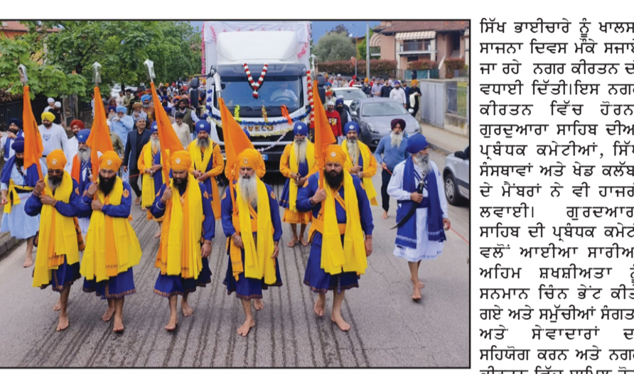
ਲੱਗਾਂ ਦੇ ਸਟਾਲ ਲਗਾਏ ਅਧਿਕਾਰੀਆਂ ਨੇ ਵੀ ਨਗਰ ਕੀਰਤਨ ਗਏ। ਸਥਾਨਕ ਨਗਰ ਕੌਂਸਲ ਦੇ ਵਿੱਚ ਸ਼ਮੂਲੀਅਤ ਕੀਤੀ। ਜਿਹਨਾਂ

ਰਾਹੀਂ ਸਮੇਂ ਸਿਰ ਅਪਡੇਟ ਸਾਂਝੀ ਕਰ ਰਹੀਆਂ ਹਨ। ਕੁਝ ਐਲਪੀਜੀ ਵਿਤਰਕਾਂ ਵੱਲੋਂ ਕੀਤੀ ਜਾ ਰਹੀ ਦੁਰਵਰਤੋਂ ਸਬੰਧੀ ਸ਼ਿਕਾਇਤਾਂ ਨੂੰ ਵੀ ਗੰਭੀਰਤਾ ਨਾਲ ਲਿਆ ਜਾ ਰਿਹਾ ਹੈ। ਕਾਲਾਬਾਜ਼ਾਰੀ ਅਤੇ ਜਮ੍ਹਾਂਬੋਰੀ ਨੂੰ ਰੋਕਣ ਲਈ, ਸੂਬੇ ਭਰ ਵਿੱਚ ਐਲਪੀਜੀ ਵਿਤਰਕਾਂ ਦੀ ਅਚਨਚੇਤ ਚੈਕਿੰਗ ਕਰਨ ਲਈ ਕਈ ਕਰਾਸ-ਫੰਕਸ਼ਨਲ ਟੀਮਾਂ ਬਣਾਈਆਂ ਗਈਆਂ ਹਨ। ਉਲੰਘਣਾ ਕਰਨ ਵਾਲੇ ਵਿਤਰਕਾਂ ਵਿਰੁੱਧ ਸਖ਼ਤ ਕਾਰਵਾਈ ਕੀਤੀ ਜਾ ਰਹੀ ਹੈ। ਗਾਹਕਾਂ ਨੂੰ ਸਲਾਹ ਦਿੱਤੀ ਜਾਂਦੀ ਹੈ ਕਿ ਉਹ ਐਲਪੀਜੀ ਸਿਲੰਡਰਾਂ ਦੀ ਘਬਰਾਹਟ 'ਚ ਬੁਕਿੰਗ ਕਰਨ ਜਾਂ ਜਮ੍ਹਾਂਬੋਰੀ ਤੋਂ ਗੁਰੇਜ਼ ਕਰਨ ਅਤੇ ਅਫਵਾਹਾਂ