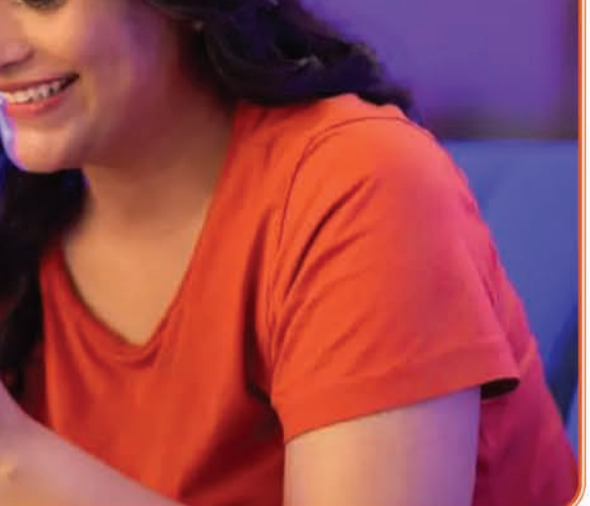
ਫਲਾਂ ਵਰਗੀਆਂ ਹੋਰ ਕੁਦਰਤੀ ਮਿੱਠੀਆਂ ਚੀਜ਼ਾਂ ਸਾਡੇ ਡੋਪਾਮਾਈਨ ਸਿਸਟਮ ਲਈ ਘੱਟ ਦਿਲਚਸਪ ਹੋ ਸਕਦੀਆਂ ਹਨ। ਅਸਲ ਵਿੱਚ ਮਿੱਠੇ ਦੀ ਤਲਬ ਜਿੰਨੀ ਵੱਧ ਹੁੰਦੀ ਹੈ, ਸਾਨੂੰ ਰਿਵਾਜ ਨਾਂ ਖੁੱਬੀ ਦਾ ਅਹਿਸਾਸ ਵੀ ਓਨਾ ਹੀ ਵੱਧ ਹੁੰਦਾ ਹੈ, ਜਿਸ ਨਾਲ ਇਹ ਸਿਲਸਿਲਾ ਹੋਰ ਮਜ਼ਬੂਤ ਹੁੰਦਾ ਜਾਂਦਾ ਹੈ ਅਤੇ ਸਾਡੇ ਦਿਮਾਗ ਦੀ ਵਾਇਰਿੰਗ ਇਸ ਤਰ੍ਹਾਂ ਬਦਲ ਸਕਦੀ ਹੈ ਕਿ ਸਾਨੂੰ ਇਸਦੀ ਹੋਰ ਵੱਧ ਤਲਬ ਹੋਣ ਲੱਗਦੀ ਹੈ। ਉਦਾਹਰਣ ਵਜੋਂ, ਜਿਨ੍ਹਾਂ ਲੋਕਾਂ ਨੇ ਅੰਠ ਹਫ਼ਤਿਆਂ ਤੱਕ ਰੋਜ਼ਾਨਾ ਵੱਧ ਮਿੱਠੇ ਅਤੇ ਵੱਧ ਫੈਟ ਵਾਲੀ ਪੁਛੀ ਖਾਧੀ, ਉਨ੍ਹਾਂ ਦੇ ਦਿਮਾਗ ਮਿੱਠੇ ਖਾਣੇ ਲਈ ਕਾਫ਼ੀ ਵੱਧ ਸੰਵੇਦਨਸ਼ੀਲ ਹੋ ਗਏ। ਡੋਪਾਮਾਈਨ ਦਾ "ਫੀਡਬੈਕ ਲੂਪ" ਇਹ ਸਮਝਣ ਵਿੱਚ ਮਦਦ ਕਰਦਾ ਹੈ ਕਿ ਮਿੱਠਾ ਖਾਣਾ ਇੰਨਾ ਮੁਸ਼ਕਲ ਕਿਉਂ ਲੱਗਦਾ ਹੈ। ਰੋਬਰਟ ਲਸਟਿੰਗ ਕਹਿੰਦੇ ਹਨ, "ਤੁਸੀਂ ਆਪਣੀ ਬਾਇਓਲੋਜੀਕਲ ਕੈਮਿਸਟਰੀ ਦੇ ਗੁਲਾਮ ਬਣ ਜਾਂਦੇ ਹੋ। ਇਹੀ ਤਾਂ ਲਤ ਦੀ ਪਰਿਭਾਸ਼ਾ ਹੈ। ਅਤੇ [ਅਮਰੀਕਾ ਦੀ] 20% ਆਬਾਦੀ ਨੂੰ ਮਿੱਠੇ ਦੀ ਲਤ ਹੈ।" ਇਸ ਲਾਲਚ ਦੇ ਖੇਤਰ ਲਈ, ਮੈਂ ਕੁਝ ਸੰਤੁਸ਼ਟੀ ਦੇਣ ਵਾਲੇ ਬਦਲ ਲੱਭ ਲਏ, ਜਿਵੇਂ ਕਿ ਇੱਕ ਕੋਲੇ ਅਤੇ ਬਲੂਬੇਰੀ ਦਾ ਸੇਕ, ਜਿਸ ਵਿੱਚ ਇੱਕ ਚਮਚ ਕੋਲੇ ਪਾਉਡਰ ਮਿਲਿਆ ਹੋਵੇ। ਅੰਗੂਰ ਖਾਣ ਨਾਲ ਵੀ ਮੈਨੂੰ ਉਹੀ ਅਸਰ ਮਹਿਸੂਸ ਹੋਇਆ। ਇੱਥੇ ਤੱਕ ਕਿ ਸੇਬ ਵੀ ਮੈਨੂੰ ਵੱਧ ਮਿੱਠੇ ਲੱਗਣ ਲੱਗੇ ਸਨ। ਇਸ ਲਈ, ਭਾਰੇ ਮੇਰਾ ਮਨ ਨਹੀਂ ਕਰਦਾ ਸੀ, ਫਿਰ ਵੀ ਮੈਂ ਰੋਜ਼ਾਨਾ ਇੱਕ ਸੇਬ ਖਾਂ ਲੈਂਦੀ ਸੀ, ਜਿਸ ਨਾਲ ਮਿੱਠੇ ਦੀ ਤਲਬ ਨੂੰ ਕਾਬੂ ਰੱਖਣ ਵਿੱਚ ਮਦਦ ਮਿਲੀ। ਸਬੂਤ ਇਹ ਵੀ ਦਿਖਾਉਂਦੇ ਹਨ ਕਿ ਜਦੋਂ ਬਲੈਂਡ ਸੁਗਰ ਦਾ ਪੱਧਰ ਤੇਜ਼ੀ ਨਾਲ ਘੱਟ ਹੁੰਦਾ ਹੈ, ਤਾਂ ਲੋਕਾਂ ਨੂੰ ਵੱਧ ਖੁੱਬੀ ਲੱਗਦੀ ਹੈ ਅਤੇ ਇਹ ਅਕਸਰ ਵੱਧ ਮਿੱਠੇ ਵਾਲਾ ਖਾਣਾ ਖਾਣ ਤੋਂ ਬਾਅਦ ਹੁੰਦਾ ਹੈ। ਇੱਕ ਅਧਿਐਨ ਵਿੱਚ ਪਾਇਆ ਗਿਆ ਕਿ ਜਿਨ੍ਹਾਂ ਲੋਕਾਂ ਨੇ ਵੱਧ ਮਿੱਠਾ ਅਤੇ ਰਿਫਾਈਡ ਸਟਾਰ ਵਾਲਾ ਮਿਲਕਸ਼ੇਕ (ਹਾਈ ਗਲਾਈਸੇਮਿਕ ਇੰਡੈਕਸ ਵਾਲਾ ਸੇਕ) ਪੀਤਾ, ਉਨ੍ਹਾਂ ਨੂੰ ਚਾਰ ਘੰਟਿਆਂ ਬਾਅਦ ਵੱਧ ਖੁੱਬੀ ਲੱਗੀ ਅਤੇ ਉਨ੍ਹਾਂ ਦੇ ਦਿਮਾਗ ਦੇ 'ਰਿਵਾਜ ਸੈਟਰ' ਵਿੱਚ ਵੱਧ ਸਰਗਰਮੀ ਹੋਈ, ਬਜਾਏ ਉਨ੍ਹਾਂ ਲੋਕਾਂ ਦੇ ਜਿਨ੍ਹਾਂ ਨੇ ਘੱਟ ਗਲਾਈਸੇਮਿਕ ਇੰਡੈਕਸ ਵਾਲਾ ਸੇਕ ਪੀਤਾ ਸੀ।

ਨੇ ਕਈ ਹਫ਼ਤਿਆਂ ਤੱਕ ਵੱਧ ਮਿੱਠੇ ਵਾਲੇ ਪੇਸ਼ਾ ਅਤੇ ਪਰਿਵਾਰ ਖੰਡ, ਉਨ੍ਹਾਂ ਦੇ ਲੀਵਰ ਵਿੱਚ ਫੈਟ ਦੀ ਮਾਤਰਾ ਲਗਭਗ ਦੁੱਗਣੀ ਪਾਈ ਗਈ, ਭਾਰੇ ਉਨ੍ਹਾਂ ਨੇ ਕੁੱਲ ਮਿਲਕੇ ਓਨੀ ਹੀ ਕੈਲੋਰੀ ਲਈ ਹੋਵੇ। ਰੋਬਰਟ ਲਸਟਿੰਗ, ਜੋ ਇਸ ਟ੍ਰਾਇਲ ਦੇ ਸਹਿ-ਲੇਖਕ ਅਤੇ ਮਿੱਠੇ ਦੇ ਨੁਕਸਾਨ ਦੇ ਸਰੋਤ ਬਾਰੇ ਇੱਕ ਮਸ਼ਹੂਰ ਮਾਹਿਰ ਹਨ, ਦੱਸਦੇ ਹਨ ਕਿ ਫੁਕਟੋਜ਼ - ਜਿਵੇਂ ਕਿ ਕਾਰਨ (ਮੱਕੀ) ਸਿਰਫ ਮਿਲਦਾ ਹੈ - ਮਾਈਟੋਕੋਂਡਰੀਆ ਲਈ ਜ਼ਹਿਰੀਲਾ ਹੁੰਦਾ ਹੈ। ਮਾਈਟੋਕੋਂਡਰੀਆ ਉਹ ਮਾਈਟੋਕੋਂਡਰੀਆ ਨੂੰ ਨਸ਼ਟ ਕਰ ਦਿੰਦਾ ਹੈ ਅਤੇ ਉਰਜਾ ਦੇ ਖਰਚ ਨੂੰ ਘੱਟ ਕਰ ਦਿੰਦਾ ਹੈ, ਇਸ ਲਈ ਤੁਹਾਨੂੰ ਨਵੇਂ ਮਾਈਟੋਕੋਂਡਰੀਆ ਬਣਾਉਣੇ ਪੈਂਦੇ ਹਨ। ਉਨ੍ਹਾਂ ਮੈਨੂੰ ਦੱਸਿਆ ਕਿ ਇਸ ਕਾਰਨ ਤੁਹਾਨੂੰ ਸਿਹਤ ਠੀਕ ਨਹੀਂ ਲੱਗ ਸਕਦੀ, ਬੌਕੇ ਹੋਏ, ਸੁਸਤ ਅਤੇ ਚਿੜਚਿੜਾ ਮਹਿਸੂਸ ਕਰ ਸਕਦੇ ਹੋ ਅਤੇ ਤੁਹਾਡੇ ਦਿਮਾਗ ਵਿੱਚ ਉਲਝਣ (ਬ੍ਰੇਨ ਫੋਗ) ਵਧ ਸਕਦਾ ਹੈ। ਮੈਂ ਨਿਸ਼ਚਿਤ ਤੌਰ 'ਤੇ ਮਹਿਸੂਸ ਕੀਤਾ ਕਿ ਜਿਵੇਂ-ਜਿਵੇਂ ਮੈਂ ਮਿੱਠੇ ਤੋਂ ਪਰਹੇਜ਼ ਜਾਰੀ ਰੱਖਿਆ, ਇਨ ਫਰ ਮੇਰੀ ਉਰਜਾ ਦਾ ਪੱਧਰ ਹੋਰ ਸਥਿਰ ਬਣਿਆ ਰਿਹਾ। ਨਵੀਂ ਗਿਰਦਾਰ ਤੋਂ ਇਹ ਵੀ ਸੁਝਾਅ ਮਿਲਦਾ ਹੈ ਕਿ ਵੱਧ ਮਿੱਠਾ ਖਾਣ ਵਾਲੀ ਡਾਇਟ ਦਾ ਸਬੰਧ ਵੱਧ ਮਾਨਸਿਕ ਪਰੇਸ਼ਾਨੀ ਨਾਲ ਹੁੰਦਾ ਹੈ, ਜਿਸ ਵਿੱਚ ਐਂਗੀਓਇਟੀ ਅਤੇ ਡਿਪ੍ਰੈਸ਼ਨ (ਘਬਰਾਹਟ ਅਤੇ ਤਣਾਅ) ਦੇ ਲੱਛਣ ਵੀ ਸ਼ਾਮਲ ਹੁੰਦੇ ਹਨ। ਹਾਲਾਂਕਿ ਇਹ ਸਭ ਸੁਣ ਕੇ ਚਿੰਤਾ ਹੋ ਸਕਦੀ ਹੈ, ਪਰ ਇਹ ਸਿਹਤਮੰਦ ਖੁਰਾਕ ਦੇ ਹਿੱਸੇ ਵਜੋਂ ਖੁੱਬੀ ਮਾਤਰਾ ਵਿੱਚ ਮਿੱਠਾ ਖਾਣਾ ਠੀਕ ਹੈ। ਪਰ ਇਹ ਵੀ ਸਪਸ਼ਟ ਹੈ ਕਿ ਉਹ ਲੱਖਾਂ ਲੋਕ ਜੋ ਬਹੁਤ ਜ਼ਿਆਦਾ ਮਿੱਠਾ ਖਾਂਦੇ ਹਨ, ਜਿਸ ਵਿੱਚ ਉਹ ਇਸਨੂੰ ਘੱਟ ਕਰ ਦੇਣ ਤਾਂ ਉਨ੍ਹਾਂ ਦੀ ਸਿਹਤ ਨੂੰ ਬਹੁਤ ਫਾਇਦਾ ਹੋਵੇਗਾ।