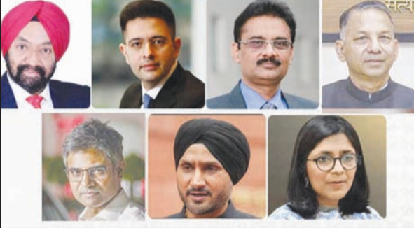
ਦੂਜੇ ਪਾਸੇ, ਆਮ ਆਦਮੀ ਪਾਰਟੀ ਨੇ ਇਸ ਫੈਸਲੇ ਦਾ ਸਖ਼ਤ ਵਿਰੋਧ ਕੀਤਾ ਹੈ। ਪਾਰਟੀ ਨੇ ਚੇਅਰਮੈਨ ਨੂੰ ਪੱਤਰ ਲਿਖ ਕੇ ਇਨ੍ਹਾਂ ਮੈਂਬਰਾਂ ਨੂੰ ਅਯੋਗ ਕਰਾਰ ਦੇਣ ਦੀ ਮੰਗ ਕੀਤੀ ਸੀ। 'ਆਪ' ਨੇ ਕਪਿਲ ਸਿੱਬਲ ਵਰਗੇ ਕਾਨੂੰਨੀ ਮਾਹਰਾਂ ਦਾ ਹਵਾਲਾ ਦਿੰਦਿਆਂ ਤਰਕ ਦਿੱਤਾ ਕਿ ਵਿਧਾਇਕ ਜਾਂ ਸੰਸਦੀ ਦਲ ਦੇ ਰਲਵੇ ਤੋਂ ਪਹਿਲਾਂ ਸੰਬੰਧਤ ਸਿਆਸੀ ਪਾਰਟੀਆਂ ਦਾ ਆਪਸ ਵਿੱਚ ਰਲਵਾ ਹੋਣਾ ਜ਼ਰੂਰੀ ਹੈ। ਹਾਲਾਂਕਿ, ਮਾਹਰ ਮਹਾਰਾਸ਼ਟਰ ਵਿੱਚ ਸ਼ਿਵ ਸੈਨਾ (ਸ਼ਿਵ ਧੜਾ) ਅਤੇ ਐਨਸੀਪੀ (ਅਜੰਤਾ ਪਵਾਰ ਧੜਾ) ਦੀ ਮਿਸਾਲ ਦੇ ਰਹੇ ਹਨ, ਜਿੱਥੇ ਦੋ-ਤਿਹਾਈ ਬਹੁਮਤ ਦੇ ਅਧਾਰ 'ਤੇ ਵੱਖ ਹੋਏ ਧੜਿਆਂ ਨੂੰ ਹੀ ਅਸਲੀ ਪਾਰਟੀ ਦਿੱਤੀ ਜਾਂਦੀ ਹੈ। ਮਾਨਤਾ ਮਿਲੀ ਸੀ। ਇਸ ਘਟਨਾਕ੍ਰਮ ਨੇ ਪੰਜਾਬ ਅਤੇ ਦਿੱਲੀ ਦੀ ਸਿਆਸਤ ਵਿੱਚ ਨਵੀਂ ਚਰਚਾ ਛੱਡ ਦਿੱਤੀ ਹੈ।

ਨਵੀਂ ਦਿੱਲੀ, 27 ਅਪ੍ਰੈਲ : ਅਰਵਿੰਦ ਕੇਜਰੀਵਾਲ ਦੀ ਅਗਵਾਈ ਵਾਲੀ ਆਮ ਆਦਮੀ ਪਾਰਟੀ ਨੂੰ ਅੱਜ ਉਸ ਵੇਲੇ ਵੱਡਾ ਸਿਆਸੀ ਝਟਕਾ ਲੱਗਾ ਜਦੋਂ ਰਾਜ ਸਭਾ ਦੇ ਚੇਅਰਮੈਨ ਸੀ.ਪੀ. ਰਾਧਾਕ੍ਰਿਸ਼ਨਨ ਨੇ ਪਾਰਟੀ ਦੇ ਸੱਤ ਰਾਜ ਸਭਾ ਮੈਂਬਰਾਂ ਦੇ ਭਾਜਪਾ ਵਿੱਚ ਰਲਵੇ ਨੂੰ ਅਧਿਕਾਰਤ ਤੌਰ 'ਤੇ ਪ੍ਰਵਾਨਗੀ ਦੇ ਦਿੱਤੀ। ਇਸ ਫੈਸਲੇ ਨਾਲ ਰਾਜ ਸਭਾ ਵਿੱਚ 'ਆਪ' ਦੀ ਗਿਣਤੀ 10 ਤੋਂ ਘਟ ਕੇ ਸਿਰਫ 3 ਰਹਿ ਗਈ ਹੈ, ਜਦੋਂਕਿ ਭਾਜਪਾ ਦੀ ਤਾਕਤ 106 ਤੋਂ ਵਧ ਕੇ 113 ਹੋ ਗਈ ਹੈ। ਰਾਜ ਸਭਾ ਦੀ ਵੈੱਬਸਾਈਟ ਅਨੁਸਾਰ, ਹੁਣ ਸਦਨ ਵਿੱਚ ਸੱਤਾਧਾਰੀ ਐਨਡੀਏ ਦੀ ਕੁੱਲ ਗਿਣਤੀ 141 ਤੋਂ ਵਧ ਕੇ 148 ਹੋ ਗਈ ਹੈ। ਭਾਜਪਾ ਹੁਣ ਉਪਰਲੇ ਸਦਨ ਵਿੱਚ 123 ਦੇ ਬਹੁਮਤ ਦੇ ਐਕੜੇ ਦੇ ਬਹੁਤ