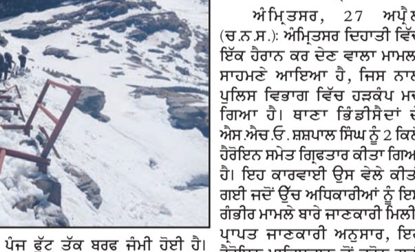
ਪੰਜ ਵੱਟ ਤੱਕ ਬਰਫ ਜੰਮੀ ਹੋਈ ਹੈ। ਉੱਤਰਾਖੰਡ ਵਿਖੇ ਲਗਭਗ 15 ਹਜ਼ਾਰ ਵੱਟ ਦੀ ਉਚਾਈ 'ਤੇ ਸਥਾਪਿਤ ਗੁਰਦੁਆਰਾ ਸ੍ਰੀ ਹੇਮਕੁੰਟ ਸਾਹਿਬ ਦੀ ਸਾਲਾਨਾ ਯਾਤਰਾ 20 ਮਈ ਨੂੰ ਆਰੰਭ ਹੋ ਰਹੀ ਹੈ ਅਤੇ 23 ਮਈ ਨੂੰ ਸੰਗਤ ਵਾਸਤੇ ਕਪਾਟ ਖੋਲ੍ਹੇ ਜਾਣਗੇ। ਇਸ ਸਾਲਾਨਾ ਯਾਤਰਾ ਦੀ ਸ਼ੁਰੂਆਤ ਤੋਂ ਪਹਿਲਾਂ ਰਸਤੇ (ਬਾਕੀ ਸਫਾ 2 'ਤੇ)

ਚੜ੍ਹਦੀਕਲਾ ਬਿਊਰੋ ਗੋਬਿੰਦ ਪਾਸ, 27 ਅਪ੍ਰੈਲ : ਭਾਰਤੀ ਵੱਜ ਦੇ ਜਵਾਨਾਂ ਨੇ ਸ੍ਰੀ ਹੇਮਕੁੰਟ ਸਾਹਿਬ ਦੇ ਰਸਤੇ ਵਿੱਚ ਜੰਮੀ ਬਰਫ ਨੂੰ ਹਟਾਉਣ ਅਤੇ ਰਸਤੇ ਤਿਆਰ ਕਰਨ ਦਾ ਕੰਮ ਸ਼ੁਰੂ ਕਰ ਦਿੱਤਾ ਹੈ। ਇਸ ਵੇਲੇ ਸ੍ਰੀ ਹੇਮਕੁੰਟ ਸਾਹਿਬ ਦੇ ਕੋਲ ਅਟਲਾਕੋਟੀ ਗਲੇਸ਼ੀਅਰ ਨੇੜੇ ਰਸਤੇ ਵਿੱਚ ਤਿੰਨ ਤੋਂ ਵੱਧ (ਬਾਕੀ ਸਫਾ 2 'ਤੇ)