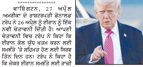
ਵਾਸ਼ਿੰਗਟਨ, 27 ਅਪ੍ਰੈਲ : ਅਮਰੀਕਾ ਦੇ ਰਾਸ਼ਟਰਪਤੀ ਡੋਨਾਲਡ ਟਰੰਪ ਨੇ 26 ਅਪ੍ਰੈਲ ਨੂੰ ਈਰਾਨ ਨੂੰ ਇੱਕ ਨਵੀਂ ਚੇਤਾਵਨੀ ਦਿੱਤੀ ਹੈ। ਆਪਣੀ ਚੇਤਾਵਨੀ ਵਿੱਚ ਟਰੰਪ ਨੇ ਕਿਹਾ ਕਿ ਈਰਾਨ ਕੋਲ ਖੁੱਧ ਖਤਮ ਕਰਨ ਲਈ ਸਮਝੌਤੇ 'ਤੇ ਸਹਿਮਤ ਹੋਣ ਲਈ ਸਿਰਫ ਤਿੰਨ ਦਿਨ ਹਨ। ਟਰੰਪ ਨੇ ਕਿਹਾ ਕਿ ਜੇਕਰ ਈਰਾਨ ਸਮਝੌਤੇ ਲਈ ਰਾਜ਼ੀ ਨਹੀਂ ਹੁੰਦਾ, ਤਾਂ ਉਸ ਦੀਆਂ ਤੇਲ ਪਾਈਪਲਾਈਨਾਂ ਅੰਦਰੋਂ ਫਟ ਜਾਣਗੀਆਂ। ਇੱਕ ਖ਼ਬਰ ਏਜੈਂਸੀ ਨਾਲ ਗੱਲ ਕਰਦੇ ਹੋਏ, ਟਰੰਪ ਨੇ ਕਿਹਾ ਕਿ ਜੇਕਰ ਈਰਾਨ ਤੇਲ ਨਿਰਯਾਤ ਜਾਰੀ ਰੱਖੇਗਾ ਤਾਂ ਉਸਦੀ ਪੁਲਿਸ 50% 'ਤੇ ਕੰਮ ਕਰਨ ਦੇ ਯੋਗ ਹੋਵੇਗਾ। (ਬਾਕੀ ਸਫਾ 2 'ਤੇ)

ਵਿੱਚ ਸੰਤੁਲਨ ਨਹੀਂ ਬਣਿਆ, ਤਾਂ ਪ੍ਰਧਾਨ ਬਦਲਣ ਦੀ ਸੰਭਾਵਨਾ ਨੂੰ ਨਕਾਰਿਆ ਨਹੀਂ ਜਾ ਸਕਦਾ। ਕਾਂਗਰਸ ਅਕਸਰ ਚੋਣਾਂ ਤੋਂ ਪਹਿਲਾਂ ਚਿਹਰਾ ਬਦਲ ਕੇ ਨਵਾਂ ਸੰਦੇਸ਼ ਦੇਣ ਦੀ ਕੋਸ਼ਿਸ਼ ਕਰਦੀ ਰਹੀ ਹੈ। ਪਰ ਹੁਣ ਸਿਰਫ ਪ੍ਰਧਾਨ ਬਦਲਣਾ ਹੱਲ ਨਹੀਂ ਹੋਵੇਗਾ। ਜੇ ਨੀਤੀ ਨਹੀਂ ਬਦਲੀ, ਜੇ ਜ਼ਮੀਨੀ ਵਰਕਰ ਨੂੰ ਸਨਮਾਨ ਨਹੀਂ ਮਿਲਿਆ, ਜੇ ਸਥਾਨਕ ਨੇੜਿਤਵ ਨੂੰ ਖੁਦਮੁਖਤਿਆਰੀ ਨਹੀਂ ਮਿਲੀ, ਤਾਂ ਨਵਾਂ ਚਿਹਰਾ ਵੀ ਪ੍ਰਾਣਤੀ ਨਿਰਾਸ਼ਾ ਹੀ ਸਾਬਤ ਹੋਵੇਗਾ। ਲੋਕ ਹੁਣ ਸਿਰਫ ਨਾਅਰਿਆਂ ਨਾਲ ਨਹੀਂ, ਭਰੋਸੇ ਨਾਲ ਜੁੜਦੇ ਹਨ। ਕਾਉਂਟਰ ਪਾਰਟੀ ਪ੍ਰੋਪੇਗੰਡੇ ਲਈ ਵੀ ਕਾਂਗਰਸ ਨੂੰ ਨਵੀਂ ਰਣਨੀਤੀ ਦੀ ਲੋੜ ਹੈ। ਕੇਵਲ ਆਪ ਦੀ ਮਾਮਲੀਆਂ ਜਾਂ ਭਾਜਪਾ ਦੇ ਡਰ ਦਾ ਸਹਾਰਾ ਲੈ ਕੇ ਚੋਣ ਨਹੀਂ ਜਿੱਤੀ ਜਾ ਸਕਦੀ। ਪੰਜਾਬ ਦੀ ਜਨਤਾ ਹੁਣ ਪੁੱਛਦੀ ਹੈ— ਤੁਹਾਡਾ ਆਪਣਾ ਵਿਸ਼ਨ ਕੀ ਹੈ? ਕਿਸਾਨ, ਨੌਜਵਾਨ, ਵਪਾਰੀ ਅਤੇ ਪੰਜਾਬੀ ਅਸਿਤਾਤ ਲਈ ਤੁਹਾਡਾ ਸਪਸ਼ਟ ਰੋਡਮੈਪ ਕੀ ਹੈ? ਮੇਰੇ ਰਾਜਨੀਤਕ ਅਨੁਮਾਨ ਅਨੁਸਾਰ ਕਾਂਗਰਸ ਦੀ ਪੂਰੀ ਟੁੱਟ ਤੁਰੰਤ ਨਹੀਂ ਹੋਵੇਗੀ, ਪਰ ਅੰਦਰੂਨੀ ਖਿੱਚਤਾ ਜਾਰੀ ਰਹੀ ਤਾਂ ਹੌਲੀ-ਹੌਲੀ ਪ੍ਰਭਾਵਸ਼ਾਲੀ ਚਿਹਰੇ ਹੋਰ ਪਾਰਟੀਆਂ ਵੱਲ ਜਾ ਸਕਦੇ ਹਨ। ਜੇ ਉਹ ਆਪਣੇ ਆਪ ਨੂੰ ਜਿੱਤ ਗਈ, ਤਾਂ ਪੰਜਾਬ ਵਿੱਚ ਵਾਪਸੀ ਸੰਭਵ ਹੈ। ਜੇ ਨਾ ਜਿੱਤੀ, ਤਾਂ ਇਤਿਹਾਸ ਉਸਨੂੰ ਇੱਕ ਹੋਰ ਖੋਹਿਆ ਹੋਇਆ ਮੱਕਾ ਲਿਖੇਗਾ।