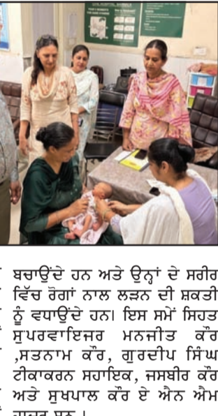
ਟੀਕਾਕਰਨ ਮਾਂ ਅਤੇ ਬੱਚੇ ਦੀ ਸਿਹਤ ਲਈ ਬਹੁਤ ਜ਼ਰੂਰੀ ਹੈ।

ਟੀਕਾਕਰਨ ਮਾਂ ਅਤੇ ਬੱਚੇ ਦੀ ਸਿਹਤ ਲਈ ਬਹੁਤ ਜ਼ਰੂਰੀ ਹੈ। ਉਨ੍ਹਾਂ ਬਰਨਾਲਾ ਵਿੱਚ ਟੀਕਾਕਰਨ ਨੂੰ ਨਿਵਾਸੀਆਂ ਨੂੰ ਅਪੀਲ ਕੀਤੀ ਕਿ ਉਹ ਆਪਣੇ ਬੱਚਿਆਂ ਦੇ ਸਿਹਤਮੰਦ ਭਵਿੱਖ ਲਈ ਇਸ ਮੁਹਿੰਮ ਵਿੱਚ ਵੱਧ ਚੜ੍ਹ ਕੇ ਹਿੱਸਾ ਲੈਣ। ਜੇਕਰ ਕਿਸੇ ਕਾਰਨ ਬੱਚੇ ਦਾ ਕੋਈ ਵੀ ਟੀਕਾਕਰਨ ਨਾ ਹੋਵੇ, ਤਾਂ ਇਸ ਵਿਸ਼ੇਸ਼ ਹਫ਼ਤੇ ਦੌਰਾਨ ਲਗਾਏ ਜਾ ਰਹੇ ਵਿਸ਼ੇਸ਼ ਕੈਂਪਾਂ ਰਾਹੀਂ ਗਰਭਵਤੀ ਔਰਤਾਂ ਅਤੇ 0 ਤੋਂ 5 ਸਾਲ ਤੱਕ ਦੇ ਬੱਚਿਆਂ ਲਈ ਮੁਕੰਮਲ ਟੀਕਾਕਰਨ ਬੇਹੱਦ ਜ਼ਰੂਰੀ ਹੈ। ਇਹ ਟੀਕੇ ਬੱਚਿਆਂ ਨੂੰ ਕਈ ਮਾਰੂ ਬਿਮਾਰੀਆਂ ਅਤੇ ਅਪਹੁੰਚਤਾ ਤੋਂ