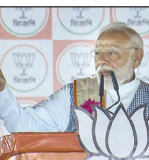
ਆਰਥਿਕ ਪਿਛੜੇਪਣ ਦਾ ਦੋਸ਼ ਲਗਾਇਆ। ਪੀ.ਐੱਮ. ਮੋਦੀ ਨੇ ਕਿਹਾ, 'ਪੱਛਮੀ ਬੰਗਾਲ 'ਚ ਮੈਂ ਜੋ ਮਾਹੌਲ ਮਹਿਸੂਸ ਕੀਤਾ ਹੈ, ਉਸ ਤੋਂ ਮੈਂ ਕਹਿ ਸਕਦਾ ਹਾਂ ਕਿ ਚਾਰ ਮਈ ਤੋਂ ਬਾਅਦ ਭਾਜਪਾ ਸਰਕਾਰ ਦੇ ਸਹੁੰ ਚੁੱਕ ਸਮਾਰੋਹ 'ਚ ਮੈਨੂੰ ਫਿਰ ਤੋਂ ਆਉਣਾ ਹੋਵੇਗਾ।' ਇਸ 'ਤੇ ਭੀੜ ਨੇ ਜ਼ੋਰਦਾਰ ਤਾੜੀਆਂ ਵਜਾਈਆਂ। (ਬਾਕੀ ਸਫਾ 2 'ਤੇ)

ਚੜ੍ਹਦੀਕਲਾ ਬਿਊਰੋ ਕੋਲਕਾਤਾ, 27 ਅਪ੍ਰੈਲ : ਪ੍ਰਧਾਨ ਮੰਤਰੀ ਨਰਿੰਦਰ ਮੋਦੀ ਨੇ ਸੋਮਵਾਰ ਨੂੰ ਵਿਸ਼ਵਾਸ ਜਤਾਇਆ ਕਿ ਵਿਧਾਨ ਸਭਾ ਚੋਣਾਂ ਤੋਂ ਬਾਅਦ ਭਾਜਪਾ ਪੱਛਮੀ ਬੰਗਾਲ 'ਚ ਅਗਲੀ ਸਰਕਾਰ ਬਣਾਏਗੀ ਅਤੇ ਚਾਰ ਮਈ ਨੂੰ ਨਤੀਜੇ ਐਲਾਨ ਹੋਣ ਤੋਂ ਬਾਅਦ ਉਹ ਸਹੁੰ ਚੁੱਕ ਸਮਾਰੋਹ ਲਈ ਮੁੜ ਆਉਣਗੇ। ਪ੍ਰਧਾਨ ਮੰਤਰੀ ਮੋਦੀ ਵਿਧਾਨ ਸਭਾ ਚੋਣਾਂ ਦੇ ਦੂਜੇ ਅਤੇ ਅੰਤਿਮ ਪੜਾਅ ਦੇ ਅਧੀਨ ਪ੍ਰਚਾਰ ਦੇ ਆਖਰੀ ਦਿਨ ਉੱਤਰ 24 ਪਰਗਨਾ ਜ਼ਿਲ੍ਹੇ ਦੇ ਬੋਰਕਪੁਰ 'ਚ ਇੱਕ ਰੈਲੀ ਨੂੰ ਸੰਬੋਧਨ ਕਰ ਰਹੇ ਸਨ। ਉਨ੍ਹਾਂ ਨੇ ਸੱਤਾਧਾਰੀ ਤ੍ਰਿਣਮੂਲ ਕਾਂਗਰਸ 'ਤੇ ਤਿੱਖਾ ਹਮਲਾ ਕਰਦੇ ਹੋਏ ਉਸ 'ਤੇ 'ਸਿੱਭੀਕੋਟ ਰਾਜ' ਚਲਾਉਣ ਦਾ ਰਾਜਨੀਤਕ ਹਿੱਸਾ ਕਰਨ ਅਤੇ (ਬਾਕੀ ਸਫਾ 2 'ਤੇ)