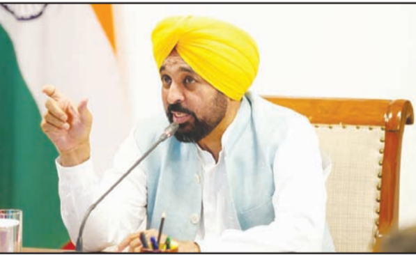
ਰਹਿਤ ਢੰਗ ਨਾਲ ਚਲਾਉਣ ਲਈ ਰੋਕਥਾਮ ਉਪਾਵਾਂ ਅਤੇ ਐਮਰਜੈਂਸੀ ਕਾਰਵਾਈ ਲਈ ਮਹੱਤਵਪੂਰਨ ਬਣਾਉਣਾ ਹੈ। ਉਨ੍ਹਾਂ ਕਿਹਾ ਕਿ ਇਹ ਖਰੋਚ ਮੁੱਖ ਮੰਤਰੀ ਮਸ਼ੀਨਾਂ ਨਾਲ ਸਫ਼ਾਈ ਕਰ ਸਕਦੀਆਂ ਹਨ ਜਿਸ ਲਈ ਸੰਭਾਲਣ ਅਤੇ ਐਮਰਜੈਂਸੀ ਹਾਲਾਤਾਂ ਵਿੱਚ ਹੜ੍ਹ (ਬਾਕੀ ਸਫਾ 2 'ਤੇ)

ਚੜ੍ਹਦੀਕਲਾ ਬਿਊਰੋ ਚੰਡੀਗੜ੍ਹ, 27 ਅਪ੍ਰੈਲ : ਪੰਜਾਬ ਦੇ ਮੁੱਖ ਮੰਤਰੀ ਭਗਵੰਤ ਸਿੰਘ ਮਾਨ ਨੇ ਅੱਜ ਹੜ੍ਹ ਸੁਰੱਖਿਆ ਪ੍ਰਬੰਧਾਂ ਦੀ ਸਮੀਖਿਆ ਕਰਦਿਆਂ ਪੰਜਾਬ ਦੇ ਹੜ੍ਹ ਰੋਕਥਾਮ ਅਤੇ ਰਾਹਤ ਯੁਨਾਇਟਿਡ ਫਾਂਚ 'ਤੇ ਮਜ਼ਬੂਤ ਕਰਨ ਦੇ ਉਦੇਸ਼ ਨਾਲ ਉਨ੍ਹਾਂ ਨੂੰ ਐਂਟੀਬੀਐਸ ਮਸ਼ੀਨਾਂ (ਪਾਣੀ ਵਿੱਚ ਅਤੇ ਧਰਤੀ 'ਤੇ ਚੱਲਣ ਵਾਲੀਆਂ ਮਸ਼ੀਨਾਂ) ਦੀ ਖਰੀਦ ਨੂੰ ਮਨਜ਼ੂਰੀ ਦਿੱਤੀ ਹੈ। ਉਨ੍ਹਾਂ ਜ਼ੋਰ ਦੇ ਕੇ ਕਿਹਾ ਕਿ ਉਨ੍ਹਾਂ ਦੀ ਸਰਕਾਰ ਮਾਨਸੂਨ ਸੀਜ਼ਨ ਤੋਂ ਪਹਿਲਾਂ ਹੜ੍ਹਾਂ ਜਾਂ ਭਾਰੀ ਮੀਂਹ ਕਰਕੇ ਹੋਏ ਨੁਕਸਾਨ ਨੂੰ ਘੱਟ ਤੋਂ ਘੱਟ ਕਰਨ ਅਤੇ ਜਾਨ-ਮਾਲ ਦੀ ਰਾਖੀ ਲਈ ਸਰਗਰਮੀ ਨਾਲ ਕੰਮ ਕਰ ਰਹੀ ਹੈ। ਉਨ੍ਹਾਂ ਨੇ 'ਪੱਧਰੀ ਮੀਟਿੰਗ' ਦੀ ਪ੍ਰਧਾਨਗੀ ਕਰਦਿਆਂ ਮੁੱਖ ਮੰਤਰੀ ਭਗਵੰਤ ਸਿੰਘ ਮਾਨ ਨੇ ਕਿਹਾ ਕਿ ਹੜ੍ਹ ਰਾਹਤ ਕਾਰਜਾਂ ਨੂੰ ਸੁਚਾਰੂ ਅਤੇ ਮੁਸ਼ਕਲ