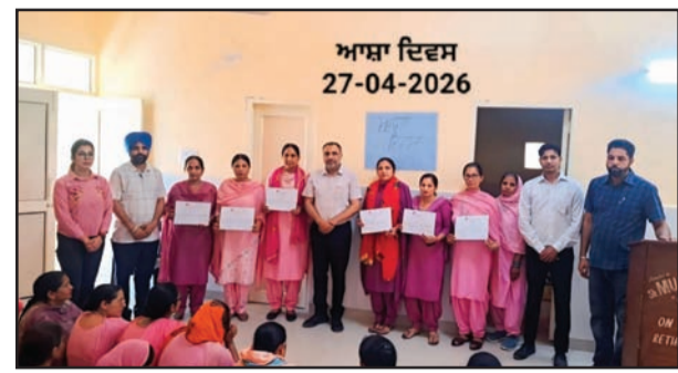
ਆਸ਼ਾ ਦਿਵਸ 27-04-2026

ਇਹ ਸਿਲਸਿਲਾ ਭਵਿੱਖ ਵਿਚ ਵੀ ਜਾਰੀ ਰਹੇਗਾ। ਉਹਨਾਂ ਕਿਹਾ ਕਿ ਦੂਰ ਦਰਾਜ਼ ਦੇ ਇਲਾਕਿਆਂ ਵਿਚ ਜਾ ਕੇ ਲੋਕਾਂ ਦੀ ਸਹਾਇਤਾ ਕਰਨ ਲਈ ਆਸ਼ਾ ਨੂੰ ਕਈ ਵਾਰ ਸਾਧਨਾਂ ਦੀ ਘਾਟ ਅਤੇ ਹੋਰ ਮੁਸ਼ਕਿਲਾਂ ਦਾ ਸਾਹਮਣਾ ਵੀ ਕਰਨਾ ਪੈਂਦਾ ਹੈ ਪਰ ਉਹ ਪੂਰੇ ਸੇਵਾ ਭਾਵ ਨਾਲ ਆਪਣੀ ਜ਼ਿੰਮੇਵਾਰੀ