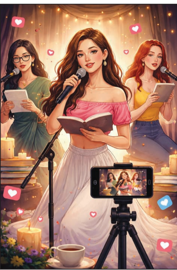
ਦੀ ਗੁਣਵੱਤਾ, ਬੋਲਚਾਲ ਦੀ ਸਪੱਸ਼ਟਤਾ ਅਤੇ ਪੇਸ਼ਕਾਰੀ ਦੇ ਮਾਣ-ਮਹਿਅਦਾ-ਇਹ ਸਾਰੇ ਤੱਤ ਕਿਸੇ ਵੀ ਸਾਹਿਤਕ ਪ੍ਰਗਟਾਵੇ ਦੇ ਮਹੱਤਵਪੂਰਨ ਅੰਗ ਹਨ। ਪਰ ਜਦੋਂ ਇਹਨਾਂ ਨੂੰ ਨਜ਼ਰਅੰਦਾਜ਼ ਕੀਤਾ ਜਾਂਦਾ ਹੈ, ਤਾਂ ਸਾਹਿਤ ਦਾ ਰੂਪ ਵਿਗੜ ਜਾਂਦਾ ਹੈ। ਕਈ ਵਾਰ, ਸਥਿਤੀ ਇੰਨੀ ਗੰਭੀਰ ਹੋ ਜਾਂਦੀ ਹੈ

ਸਾਹਿਤ ਦਾ ਮੁੱਖ ਉਦੇਸ਼ ਸਿਰਫ਼ ਮਨੋਰੰਜਨ ਨਹੀਂ ਹੈ। ਇਹ ਸਮਾਜ ਦਾ ਸ਼ੀਸ਼ਾ ਹੈ, ਜੋ ਇਸਦੀਆਂ ਹਕੀਕਤਾਂ ਨੂੰ ਦਰਸਾਉਂਦਾ ਹੈ ਅਤੇ ਇਸਦੇ ਵਿਰੋਧਾਭਾਸ਼ਾਂ ਨੂੰ ਉਜਾਗਰ ਕਰਦਾ ਹੈ। ਕਬੀਰ ਨੇ ਆਪਣੇ ਦੋਹਰਿਆਂ ਰਾਹੀਂ ਸਮਾਜਿਕ ਬੁਰਾਈਆਂ 'ਤੇ ਗਮਲਾ ਕੀਤਾ, ਤੁਲਸੀਦਾਸ ਨੇ ਵਿਸ਼ਵਾਸ ਅਤੇ ਮਾਣ ਦਾ ਸੰਦੇਸ਼ ਦਿੱਤਾ, ਪ੍ਰੇਮਚੰਦ ਨੇ ਸਮਾਜ ਦੀ ਅਸਲੀਅਤ ਨੂੰ ਉਜਾਗਰ ਕੀਤਾ ਅਤੇ ਮਹਾਦੇਵੀ ਵਰਮਾ ਨੇ ਭਾਵਨਾਵਾਂ ਦੀ ਸੂਖਮਤਾ ਨੂੰ ਸ਼ਬਦਾਂ ਵਿੱਚ ਬਿਆਨ ਕੀਤਾ। ਇਨ੍ਹਾਂ ਸਾਰੇ ਲੇਖਕਾਂ ਦੀਆਂ ਰਚਨਾਵਾਂ ਸਮੇਂ ਦੀ ਪਰੀਖਿਆ 'ਤੇ ਖਰੀਆਂ ਉਤਰੀਆਂ ਹਨ ਕਿਉਂਕਿ ਉਨ੍ਹਾਂ ਵਿੱਚ ਡੂੰਘਾਈ, ਇਮਾਨਦਾਰੀ ਅਤੇ ਸਮਾਜਿਕ ਵਚਨਬੱਧਤਾ ਸੀ। ਇਸ ਦੇ ਉਲਟ ਅੱਜ ਸਮਾਜ ਦਾ ਇੱਕ ਵੱਡਾ ਹਿੱਸਾ ਸਾਹਿਤ ਨੂੰ ਸਿਰਫ਼ ਪੇਸ਼ਕਾਰੀ ਦੇ ਮਾਧਿਅਮ ਵਜੋਂ ਵੇਖਦਾ ਹੈ। ਸ਼ਬਦਾਂ ਦੀ ਸੁੰਦਰਤਾ ਨਾਲੋਂ ਪ੍ਰਦਰਸ਼ਨ ਨੂੰ ਵੱਧ ਤੋਂ ਵੱਧ ਤਰਜੀਹ ਦਿੱਤੀ ਜਾਂ ਰਹੀ ਹੈ। ਗੀਲਾਂ 'ਤੇ ਪੇਸ਼ ਕੀਤੀਆਂ ਗਈਆਂ ਕਵਿਤਾਵਾਂ ਅਕਸਰ ਨਾ ਤਾਂ ਮੌਲਿਕ ਹੁੰਦੀਆਂ ਹਨ ਅਤੇ ਨਾ ਹੀ ਡੂੰਘੇ ਅਰਥਪੂਰਨ ਹੁੰਦੀਆਂ ਹਨ। ਇਹ ਸਿਰਫ਼ ਦਰਸ਼ਕਾਂ ਨੂੰ ਇੱਕ ਪਲ ਲਈ ਮੋਹਿਤ ਕਰਨ ਅਤੇ ਲਾਈਕ ਜਾਂ ਫੋਲੋ ਲਈ ਹੋ ਅਤੇ ਪ੍ਰਦਰਸ਼ਨ ਨੂੰ ਬਣਾਈਆਂ ਜਾਂਦੀਆਂ ਹਨ। ਗੀਲ ਸੱਭਿਆਚਾਰ ਦਾ ਇੱਕ ਹੋਰ ਚਿੰਤਾਜਨਕ ਪਹਿਲੂ ਪ੍ਰਗਟਾਵੇ ਦੀ ਸ਼ਾਨੀਨਤਾ ਵਿੱਚ ਗਿਰਾਵਟ ਹੈ। ਭਾਸ਼ਾ