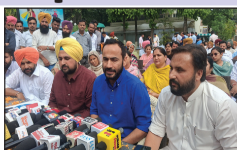
ਬਰਨਾਲਾ ਸ਼ਹਿਰ ਵਿੱਚੋਂ ਕਰੀਬ 46.47 ਡੀਸੀ ਵੋਟਾਂ ਮਿਲੀਆਂ ਹਨ, ਜਦੋਂਕਿ ਦੂਜੇ ਨੰਬਰ 'ਤੇ ਰਹੀ ਕਾਂਗਰਸ ਨੂੰ 16 ਡੀਸੀ, ਭਾਜਪਾ ਨੂੰ 12.48 ਡੀਸੀ ਅਤੇ ਬ੍ਰਹਮਚਾਰੀ ਅਕਾਲੀ ਦਲ (ਬਾਦਲ) ਨੂੰ ਸਿਰਫ਼ 11 ਡੀਸੀ ਵੋਟਾਂ ਹੀ ਮਿਲ