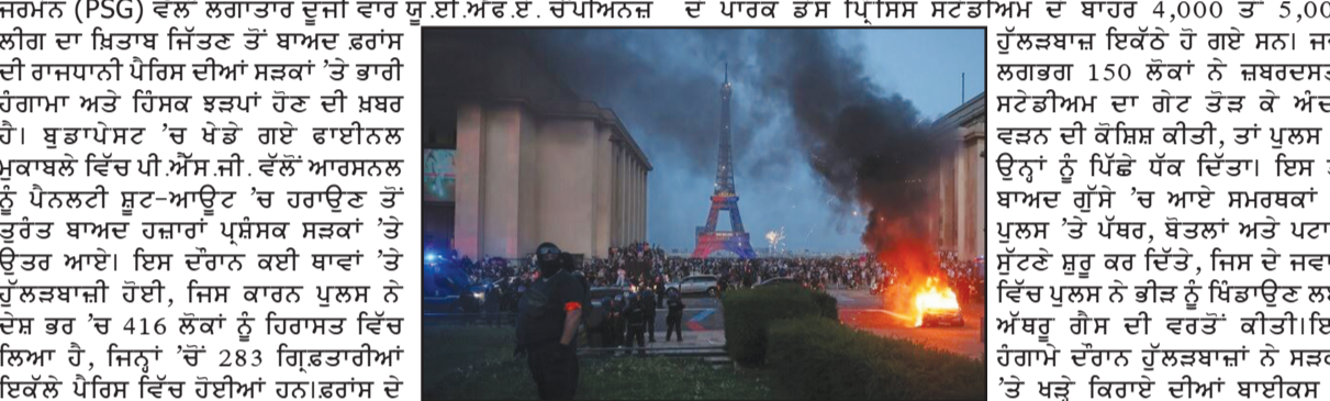
ਪੈਰਿਸ, 31 ਮਈ (ਚ.ਨ.ਸ.): ਫੁੱਟਬਾਲ ਕਲੱਬ ਪੈਰਿਸ ਸੇਂਟ-ਜਰਮੇਨ (PSG) ਵੱਲੋਂ ਲਗਾਤਾਰ ਦੂਜੀ ਵਾਰ ਯੂ.ਈ.ਐੱਫ.ਏ. ਚੈਂਪੀਅਨਜ਼ ਦੀ ਰਾਜਧਾਨੀ ਪੈਰਿਸ ਦੀਆਂ ਸੜਕਾਂ 'ਤੇ ਭਾਰੀ ਹੰਗਾਮਾ ਅਤੇ ਹਿੰਸਕ ਝੜਪਾਂ ਹੋਣ ਦੀ ਖ਼ਬਰ ਹੈ। ਬੁਡਾਪੇਸਟ 'ਚ ਖੇਡੇ ਗਏ ਫਾਈਨਲ ਮੁਕਾਬਲੇ ਵਿੱਚ ਪੀ.ਐੱਸ.ਜੀ. ਵੱਲੋਂ ਆਰਸੇਨਲ ਨੂੰ ਪੈਨਲਟੀ ਸ਼ੂਟ-ਆਊਟ 'ਚ ਹਰਾਉਣ ਤੋਂ ਤੁਰੰਤ ਬਾਅਦ ਹਜ਼ਾਰਾਂ ਪ੍ਰਸ਼ੰਸਕ ਸੜਕਾਂ 'ਤੇ ਉਤਰ ਆਏ। ਇਸ ਦੌਰਾਨ ਕਈ ਥਾਵਾਂ 'ਤੇ ਗੁੱਲਝਾਬੀ ਹੋਈ, ਜਿਸ ਕਾਰਨ ਪੁਲਸ ਨੇ ਦੋਸ਼ ਭਰ 'ਚ 416 ਲੋਕਾਂ ਨੂੰ ਹਿਰਾਸਤ ਵਿੱਚ ਲਿਆ ਹੈ, ਜਿਨ੍ਹਾਂ 'ਚੋਂ 283 ਗ੍ਰਿਫ਼ਤਾਰੀਆਂ ਇਕੱਲੇ ਪੈਰਿਸ ਵਿੱਚ ਹੋਈਆਂ ਹਨ। ਫ਼ਰਾਂਸ ਦੇ ਗਰਿ ਮੰਤਰੀ ਲੋਰੇਂਟ ਨੂਨੇਜ਼ ਨੇ ਇਸ ਹਿੰਸਾ ਨੂੰ ਪੂਰੀ ਤਰ੍ਹਾਂ ਅਸਵੀਕਾਰਯੋਗ ਕਰਾਰ ਦਿੱਤਾ ਹੈ। ਉਨ੍ਹਾਂ ਦੱਸਿਆ ਕਿ ਉਨ੍ਹਾਂ ਝੜਪਾਂ ਵਿੱਚ 7 ਪੁਲਸ ਅਧਿਕਾਰੀ ਵੀ ਜ਼ਖ਼ਮੀ ਹੋਏ ਹਨ। ਸੁਰੱਖਿਆ ਅਧਿਕਾਰੀਆਂ ਮੁਤਾਬਕ, ਪੈਰਿਸ ਦੇ ਪਾਰਕ ਡੇਸ ਪਿੰਸਿਸ ਸਟੇਡੀਅਮ ਦੇ ਬਾਹਰ 4,000 ਤੋਂ 5,000 ਗੁੱਲਝਾਬੀ ਇਕੱਠੇ ਹੋ ਗਏ ਸਨ। ਜਦੋਂ ਲਗਭਗ 150 ਲੋਕਾਂ ਨੇ ਜ਼ਬਰਦਸਤੀ ਸਟੇਡੀਅਮ ਦਾ ਗੇਟ ਤੋੜ ਕੇ ਅੰਦਰ ਵੜਨ ਦੀ ਕੋਸ਼ਿਸ਼ ਕੀਤੀ, ਤਾਂ ਪੁਲਸ ਨੇ ਉਨ੍ਹਾਂ ਨੂੰ ਪਿੱਛੇ ਧੱਕ ਦਿੱਤਾ। ਇਸ ਤੋਂ ਬਾਅਦ ਗੁੱਸੇ 'ਚ ਆਏ ਸਮਰਥਕਾਂ ਨੇ ਪੁਲਸ 'ਤੇ ਪੱਥਰ, ਬੋਤਲਾਂ ਅਤੇ ਪਟਾਕੇ ਸੁੱਟਣੇ ਸ਼ੁਰੂ ਕਰ ਦਿੱਤੇ, ਜਿਸ ਦੇ ਜਵਾਬ ਵਿੱਚ ਪੁਲਸ ਨੇ ਭੀੜ ਨੂੰ ਖਿੱਚਾਉਣ ਲਈ ਅੱਥਰੂ ਗੈਸ ਵੀ ਵਰਤੀ। ਇਸ ਹੰਗਾਮੇ ਦੌਰਾਨ ਗੁੱਲਝਾਬੀ ਨੇ ਸੜਕਾਂ 'ਤੇ ਖੜ੍ਹੇ ਕਿਹਾੜੇ ਦੀਆਂ ਬਾਈਕਸ ਨੂੰ ਵੀ ਅੱਗ ਲਗਾ ਦਿੱਤੀ, ਜਿਸ ਨਾਲ 6 ਗੱਡੀਆਂ ਅਤੇ ਇੱਕ ਬੱਸ ਸ਼ੇਲਟਰ ਪੂਰੀ ਤਰ੍ਹਾਂ ਸੜ ਗਏ।