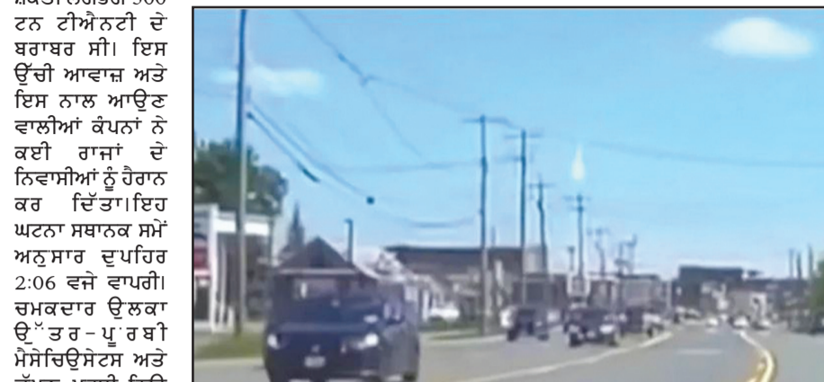
ਦਾ ਹਿੱਸਾ ਨਹੀਂ ਸੀ। ਇਹ ਇੱਕ ਕੁਦਰਤੀ ਆਕਾਸ਼ੀ ਪਿੰਡ ਸੀ - ਪੁਲਾੜ ਮਲਬਾ ਜਾਂ ਧਰਤੀ ਦੇ ਵਾਯੂਮੰਡਲ ਵਿੱਚ ਦੁਬਾਰਾ ਦਾਖਲ ਹੋਣ ਵਾਲਾ ਉਪਗ੍ਰਹਿ ਨਹੀਂ। ਇਸਦੇ ਵਿਵਹਨ ਨੇ ਲਗਭਗ 300 ਟਨ ਟੀਐਨਟੀ ਦੇ ਬਰਾਬਰ ਉਰਜਾ ਛੱਡੀ, ਜਿਸ ਨਾਲ ਇਹ ਜ਼ਬਰਦਸਤ ਆਵਾਜ਼ ਪੈਦਾ ਹੋਈ। ਨਾਸਾ ਦੇ ਅੰਕੜਿਆਂ ਅਨੁਸਾਰ, ਜਦੋਂ ਉਲਕਾ ਧਰਤੀ ਦੇ ਵਾਯੂਮੰਡਲ ਵਿੱਚ ਦਾਖਲ ਹੋਇਆ, ਇਹ ਲਗਭਗ 120,700 ਕਿਲੋਮੀਟਰ ਪ੍ਰਤੀ ਘੰਟਾ ਦੀ ਰਫਤਾਰ ਨਾਲ ਯਾਤਰਾ ਕਰ ਰਿਹਾ ਸੀ। ਜ਼ਮੀਨ ਤੋਂ ਲਗਭਗ 64 ਕਿਲੋਮੀਟਰ ਦੀ ਉਚਾਈ @ਤੇ, ਇਹ ਤੀਬਰ ਵਾਯੂਮੰਡਲ ਦੇ ਦਬਾਅ ਕਾਰਨ ਟੁੱਟ ਗਿਆ।

ਵਾਸ਼ਿੰਗਟਨ, 31 ਮਈ (ਚ.ਨ.ਸ.): ਦੁਪਹਿਰ ਨੂੰ, ਉੱਤਰ-ਪੂਰਬੀ ਸੰਯੁਕਤ ਰਾਜ ਅਮਰੀਕਾ ਦੇ ਅਸਮਾਨ ਵਿੱਚ ਇੱਕ ਵਿਸ਼ਾਲ ਉਲਕਾ ਫਟਿਆ, ਜਿਸ ਨਾਲ ਇੱਕ ਜ਼ਰਦਾਰ ਬੁਰ ਹੋਇਆ। ਨਾਸਾ ਦੇ ਵਿਗਿਆਨੀਆਂ ਦੇ ਅਨੁਸਾਰ, ਇਸ ਧਮਾਕੇ ਤੋਂ ਪੰਦਰਾਂ ਹੋਰ ਸੈਂਕੜੇ ਬੁਰ ਦੀ ਸ਼ਕਤੀ ਲਗਭਗ 300 ਟਨ ਟੀਐਨਟੀ ਦੇ ਬਰਾਬਰ ਸੀ। ਇਸ ਉੱਚੀ ਆਵਾਜ਼ ਅਤੇ ਇਸ ਨਾਲ ਆਉਣ ਵਾਲੀਆਂ ਕੰਪਨਾਂ ਨੇ ਕਈ ਰਾਜਾਂ ਦੇ ਨਿਵਾਸੀਆਂ ਨੂੰ ਹੈਰਾਨ ਕਰ ਦਿੱਤਾ। ਇਹ ਘਟਨਾ ਸਥਾਨਕ ਸਮੇਂ ਅਨੁਸਾਰ ਦੁਪਹਿਰ 2:06 ਵਜੇ ਵਾਪਰੀ। ਚਮਕਦਾਰ ਉਲਕਾ ਉੱਤਰ-ਪੂਰਬੀ ਮੈਸੋਚਿਊਸੇਟਸ ਅਤੇ ਦੱਖਣ-ਪੂਰਬੀ ਨਿਊ ਹੈਂਪਸ਼ਾਇਰ ਦੇ ਉੱਪਰ ਅਸਮਾਨ ਵਿੱਚ ਹੀ ਟੁੱਟ ਗਿਆ। ਇਸ ਦੇ ਧਮਾਕੇ ਨੇ ਇੰਨੀ ਤੀਬਰ ਆਵਾਜ਼ ਪੈਦਾ ਕੀਤੀ ਕਿ ਇਸ ਦੀਆਂ ਗੂੰਜਾਂ ਪੂਰੇ ਨਿਊ ਇੰਗਲੈਂਡ ਖੇਤਰ ਵਿੱਚ ਸੁਣੀਆਂ ਗਈਆਂ, ਅਤੇ ਕਈ ਖੇਤਰਾਂ ਵਿੱਚ ਇਮਾਰਤਾਂ ਹਿੱਲ ਗਈਆਂ। ਨਾਸਾ ਦੇ ਡਿਪਟੀ ਨਿਊਜ਼ ਚੀਫ ਜੈਨੀਫਰ ਡੋਰੇਨ ਨੇ ਕਿਹਾ ਕਿ ਇਹ ਉਲਕਾ ਕਿਸੇ ਵੀ ਮੌਜੂਦਾ ਸਰਗਰਮ ਉਲਕਾ ਸ਼ਾਵਰ ਦਾ ਹਿੱਸਾ ਨਹੀਂ ਸੀ। ਇਹ ਇੱਕ ਕੁਦਰਤੀ ਆਕਾਸ਼ੀ ਪਿੰਡ ਸੀ - ਪੁਲਾੜ ਮਲਬਾ ਜਾਂ ਧਰਤੀ ਦੇ ਵਾਯੂਮੰਡਲ ਵਿੱਚ ਦੁਬਾਰਾ ਦਾਖਲ ਹੋਣ ਵਾਲਾ ਉਪਗ੍ਰਹਿ ਨਹੀਂ। ਇਸਦੇ ਵਿਵਹਨ ਨੇ ਲਗਭਗ 300 ਟਨ ਟੀਐਨਟੀ ਦੇ ਬਰਾਬਰ ਉਰਜਾ ਛੱਡੀ, ਜਿਸ ਨਾਲ ਇਹ ਜ਼ਬਰਦਸਤ ਆਵਾਜ਼