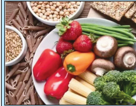
ਤੁਹਾਡੇ ਜੀਵਨ ਦਾ ਪੂਰਾ ਹੈ। ਜੇਕਰ ਤੁਸੀਂ ਨਿਰੋਗ ਹੋ ਤਾਂ ਤੁਹਾਡੇ ਲਈ ਸੰਸਾਰ ਦੀਆਂ ਸਾਰੀਆਂ ਚੀਜ਼ਾਂ ਮੁੱਲਵਾਨ ਹਨ ਨਹੀਂ ਤਾਂ ਸਭ ਕੁਝ ਬੇਅਰਥ ਹੁੰਦਾ ਹੈ। ਰੋਜ਼ਾਨਾ ਕਸਰਤ ਕਰੋ: ਜੇਕਰ ਤੁਸੀਂ ਹਮੇਸ਼ਾ ਜਵਾਨ ਰਹਿਣਾ ਚਾਹੁੰਦੇ ਹੋ ਤਾਂ ਹਰ ਰੋਜ਼ ਕਸਰਤ

ਕਰੋ। ਹਰ ਰੋਜ਼ ਆਪਣੇ ਆਪ ਨੂੰ 30 ਮਿੰਟ ਜ਼ਰੂਰ ਦਿਓ। ਕਸਰਤ ਵਿੱਚ 5 ਕਿਲੋਮੀਟਰ ਤੱਕ ਕਸਰਤ ਕਰੋ ਤੇ ਯੋਗ ਨੂੰ ਜ਼ਰੂਰ ਅਪਣਾਓ। ਕਸਰਤ ਕਰਨ ਨਾਲ ਮਨ ਸੰਤੁਲਨ ਅਵਸਥਾ ਵਿੱਚ ਰਹਿੰਦਾ ਹੈ ਜਿਸ ਨਾਲ ਮਾਨਸਿਕ ਅਵਸਥਾ ਵਿੱਚ ਰਹਿੰਦਾ ਹੈ। ਸਮੱਸਿਆਵਾਂ ਤੋਂ ਦੂਰ ਰਹਿੰਦੇ ਹੋ। ਜ਼ਿਆਦਾਤਰ ਕੱਚੇ ਭੋਜਨ ਨੂੰ ਡਾਈਟ ਵਿੱਚ ਸ਼ਾਮਲ ਕਰੋ: ਜੇਕਰ ਤੁਸੀਂ ਲੰਬੀ ਉਮਰ ਭੋਗਣਾ ਚਾਹੁੰਦੇ ਤਾਂ ਕੱਚੀਆਂ ਸਬਜ਼ੀਆਂ ਦੀ ਵਰਤੋਂ ਵਧੇਰੇ ਕਰੋ। ਆਪਣੀ ਡਾਈਟ ਵਿੱਚ ਜ਼ਿਆਦਾਤਰ ਕੱਚੇ ਭੋਜਨ ਨੂੰ ਸ਼ਾਮਲ ਕਰੋ। ਪੁੰਗਰੇ ਹੋਏ ਫਲ ਅਤੇ ਮੂੰਗੀ ਦੀ ਦਾਲ ਖਾਣ ਨਾਲ ਪ੍ਰੋਟੀਨ ਵਧੇਰੇ ਮਿਲਦਾ ਹੈ ਜੋ ਦੁਹਾਈ ਸਿਹਤ ਲਈ ਵਧੇਰੇ ਚੰਗਾ ਹੈ। ਪਰਿਵਾਰ ਨੂੰ ਸਮਾਂ ਦਿਓ: ਚੰਗੀ ਸਿਹਤ ਲਈ ਆਪਣੇ ਪਰਿਵਾਰ ਨਾਲ ਜ਼ਰੂਰ ਬੈਠੋ ਤਾਂ ਕਿ ਤੁਸੀਂ ਮਾਨਸਿਕ ਤੌਰ ਉੱਤੇ ਵੀ ਮਜ਼ਬੂਤ ਹੁੰਦੇ ਹੋ।