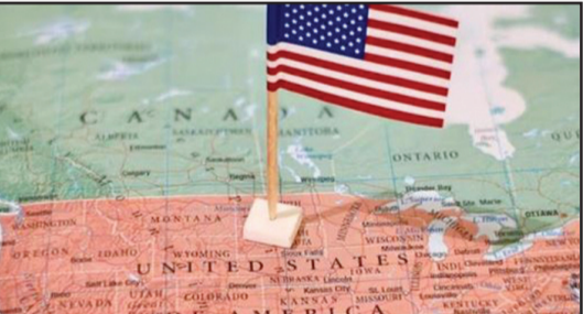
ਵਾਸ਼ਿੰਗਟਨ, 31 ਮਈ (ਚ.ਨ.ਸ.): ਅਮਰੀਕਾ ਵਿਚ ਪੱਕੇ ਹੋਣ ਦੀ ਇੱਛਾ ਰੱਖਣ ਵਾਲੇ ਪ੍ਰਵਾਸੀਆਂ, ਖਾਸ ਕਰ ਕੇ ਭਾਰਤੀਆਂ ਲਈ ਇਕ ਸੁੱਖਦ ਖ਼ਬਰ ਸਾਹਮਣੇ ਆਈ ਹੈ। ਵਿਚ ਭਾਰੀ ਚਿੰਤਾ ਪਾਈ ਜਾ ਰਹੀ ਸੀ, ਯੂ.ਐੱਸ. ਡਿਪਾਰਟਮੈਂਟ ਆਫ ਹੋਮਲੈਂਡ ਸਿਕਿਊਰਿਟੀ (ਡੀ.ਐਚ.ਐੱਸ.) ਨੇ ਸਾਡ ਕੀਤਾ ਹੈ ਕਿ ਗ੍ਰੀਨ ਕਾਰਡ ਦੀ ਅਰਜ਼ੀ ਦੇਣ ਵਾਲੇ ਸਾਰੇ ਪ੍ਰਵਾਸੀਆਂ ਨੂੰ ਅਪਣੇ ਦੇਸ਼ ਵਾਪਸ ਜਾਣ ਦੀ ਲੋੜ ਨਹੀਂ

ਪਵੇਗੀ। ਇਸ ਤੋਂ ਪਹਿਲਾਂ ਯੂ.ਐੱਸ. ਸਿਟੀਜ਼ਨਸ਼ਿਪ ਐਂਡ ਇਮੀਗ੍ਰੇਸ਼ਨ ਸਰਵਿਸਿਜ਼ (ਯੂ.ਐੱਸ.ਸੀ.ਐਈ.ਐੱਸ.) ਦੇ ਇਕ ਨੋਟਿਸ ਕਾਰਨ ਪ੍ਰਵਾਸੀਆਂ ਦੇ ਇਕ ਭਾਰੀ ਚਿੰਤਾ ਪਾਈ ਜਾ ਰਹੀ ਸੀ, ਜਿਸ ਵਿਚ ਕਿਹਾ ਗਿਆ ਸੀ ਕਿ ਪੱਕੀ ਸਿਕਿਊਰਿਟੀ (ਡੀ.ਐਚ.ਐੱਸ.) ਨੇ ਸਾਡ ਕੀਤਾ ਹੈ ਕਿ ਗ੍ਰੀਨ ਕਾਰਡ ਦੀ ਅਰਜ਼ੀ ਦੇਣ ਵਾਲੇ ਸਾਰੇ ਪ੍ਰਵਾਸੀਆਂ ਨੂੰ ਅਪਣੇ ਦੇਸ਼ ਵਾਪਸ ਜਾਣ ਦੀ ਲੋੜ ਨਹੀਂ