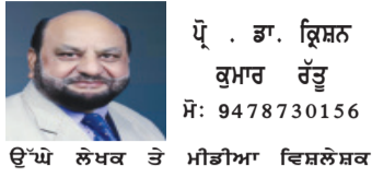
ਉੱਪ ਲੇਖਕ ਤੇ ਮੀਡੀਆ ਵਿਸ਼ਲੇਸ਼ਕ

ਪਿਛਲੇ ਇੱਕ ਦਹਾਕੇ ਵਿੱਚ ਪੰਜਾਬ ਧਰਨਿਆਂ, ਪ੍ਰਦਰਸ਼ਨਾਂ, ਰੋਲ ਰੋਕਾਂ ਅਤੇ ਸੜਕ ਰੋਕਾਂ ਦੀ ਧਰਤੀ ਬਣ ਚੁੱਕਾ ਹੈ। ਅੱਜ ਕਿਸਾਨ ਅੰਦੋਲਨਾਂ ਤੋਂ ਲੈ ਕੇ ਯੂਨੀਵਰਸਿਟੀਆਂ ਵਿੱਚ ਵਿਦਿਆਰਥੀਆਂ ਦੇ ਰੋਸ ਪ੍ਰਦਰਸ਼ਨ ਤੱਕ, ਮੋਹਾਲੀ-ਚੰਡੀਗੜ੍ਹ ਬਾਰਡਰਾਂ 'ਤੇ ਲੰਗੇ ਲੰਮੇ ਧਰਨੇ ਇੱਕ ਆਮ ਲੋਕ-ਪ੍ਰਸ਼ਾਸਨੀ ਤਸਵੀਰ ਬਣ ਚੁੱਕੇ ਹਨ।