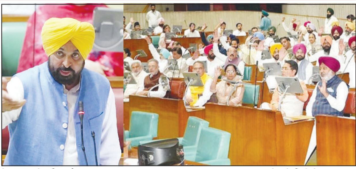
ਵਿਸ਼ਵਾਸ ਮਤਾ ਲਿਆਉਣ ਦਾ ਫੈਸਲਾ ਕੀਤਾ ਹੈ ਤਾਂ ਜੋ ਲੋਕਤੰਤਰੀ ਢੰਗ ਨਾਲ ਆਪਣਾ ਬਹੁਮਤ ਸਾਬਤ ਕੀਤਾ ਜਾ ਸਕੇ। ਵਿੱਤ ਮੰਤਰੀ ਹਰਪਾਲ ਸਿੰਘ ਚੀਮਾ ਨੇ ਮੁੱਖ ਮੰਤਰੀ ਦੇ ਮਤੇ ਦਾ ਸਮਰਥਨ ਇਕੱਠੇ ਕੰਮ ਕਰ ਰਹੇ ਹਨ। ਉਨ੍ਹਾਂ ਵੱਲੋਂ ਕਿਹਾ ਕਿ ਸਰਕਾਰ ਕੋਲ ਵਿਰੋਧੀ ਧਿਰ 'ਤੇ ਨਿਸ਼ਾਨਾ ਸਾਧਦੇ ਹੋਏ ਸਪੱਸ਼ਟ ਬਹੁਮਤ ਹੈ ਅਤੇ ਸਾਰੇ ਵਿਧਾਇਕ ਇਕੱਠੇ ਕੰਮ ਕਰ ਰਹੇ ਹਨ। ਉਨ੍ਹਾਂ ਵਿਰੋਧੀ ਧਿਰ 'ਤੇ ਨਿਸ਼ਾਨਾ ਸਾਧਦੇ ਹੋਏ ਕਿਹਾ ਕਿ ਉਹ ਬੇਬੁਨਿਆਦ ਦੋਸ਼ ਲਗਾ ਕੇ ਰਾਜਨੀਤਿਕ ਮਾਹੌਲੇ ਨੂੰ ਵਿਗਾੜਨ ਦੀ ਕੋਸ਼ਿਸ਼ (ਬਾਕੀ ਸਫ਼ਾ 2 'ਤੇ)