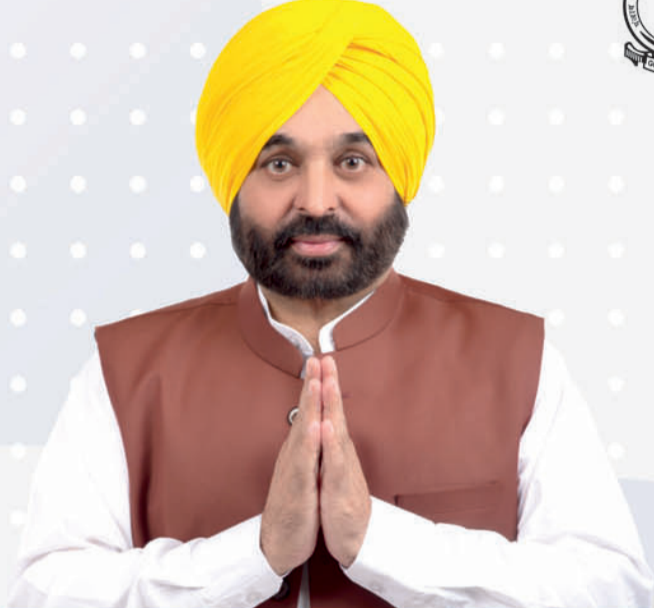
ਸ. ਭਗਵੰਤ ਸਿੰਘ ਮਾਨ ਮੁੱਖ ਮੰਤਰੀ, ਪੰਜਾਬ