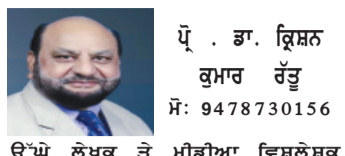
ਉੱਪ ਲੇਖਕ ਤੇ ਮੀਡੀਆ ਵਿਸ਼ਲੇਸ਼ਕ

ਕੀ ਅੱਜ ਪੰਜਾਬ ਦੀ ਰਾਜਨੀਤੀ ਸੱਚਮੁੱਚ ਡੇਰਿਆਂ ਦੀ ਛਾਇਆ, ਲੋਕਾਂ ਦੀ ਭਟਕਣ ਅਤੇ ਭਵਿੱਖ ਦੀ ਤਸਵੀਰ 'ਚ ਉਲਝ ਗਈ ਹੈ? ਅੱਜ ਪੰਜਾਬ ਦੇ ਖੇਤਾਂ ਦਾ ਸਨਾ, ਨਦੀਆਂ ਦੀ ਧਰਤੀ, ਬਹਾਦਰਾਂ ਅਤੇ ਕਿਸਾਨਾਂ ਦਾ ਘਰ, ਗੁਰੂਆਂ ਦੀ ਪਵਿੱਤਰ ਭੂਮੀ ਦਸ਼ਾ ਕਿੱਧਰ ਨੂੰ ਜਾ ਰਹੀ ਹੈ, ਇਹ ਹੁਣ ਚਿੰਤਾ ਦਾ ਵਿਸ਼ਾ ਹੈ। ਅੱਜ ਤੱਕ ਇਸ ਧਰਤੀ ਨੇ ਇਤਿਹਾਸ ਦੀਆਂ ਅਣਗਿਣਤ ਲਹਿਰਾਂ ਵੇਖੀਆਂ ਹਨ ਆਜ਼ਾਦੀ ਦੀ ਲੜਾਈ, ਹਰੀ ਕ੍ਰਾਂਤੀ ਦਾ ਜਸ਼ਨ, ਫਿਰ ਉਥਲ-ਫੂਲ ਵਾਲੇ ਸਾਲ, ਨਸ਼ਿਆਂ ਦੀ ਆਵਾਜ਼ ਅਤੇ ਯੁਵਕਾਂ ਦਾ ਵਿਦੇਸ਼ ਭੱਜਣਾ। ਅੱਜ ਜਦੋਂ ਫਰਵਰੀ 2027 ਦੀਆਂ ਵਿਧਾਨ ਸਭਾ ਚੋਣਾਂ ਸਿਰ ਤੇ ਆ ਰਹੀਆਂ ਹਨ, ਇੱਕ ਡੂੰਘੀ ਉਥਲ-ਫੂਲ ਚੱਲ ਰਹੀ ਹੈ। ਲੋਕ ਪੁੱਛ ਰਹੇ ਹਨ ਕਿ ਅਸੀਂ ਫਿਰ ਉਸ ਪੁਰਾਣੇ ਚੱਕਰ ਵਿੱਚ ਫਸ ਗਏ ਹਾਂ? ਅੱਜ ਡੇਰਿਆਂ, ਧਰਮ ਅਤੇ ਜਾਤ-ਪਾਤ ਦੀਆਂ ਜੰਜੀਰਾਂ ਵਿੱਚ ਫਸ ਕੇ, ਰਾਜਨੀਤਿਕ ਪਾਰਟੀਆਂ ਦੇ ਝੂਠ ਅਤੇ ਖੋਧਲੀਆਂ ਭਾਵਨਾਵਾਂ ਵਿੱਚ ਖੋਜੀਆਂ ਆਸਾਂ ਨਾਲ ਇਸ ਧਰਤੀ ਦੀ ਰੂਹ ਨਾਲ ਗੱਲਬਾਤ, ਉਸ ਦਰਦ ਨਾਲ ਜੋ ਖੇਤਾਂ ਵਿੱਚ ਖੜ੍ਹੇ ਕਿਸਾਨ ਦੀਆਂ ਅੱਖਾਂ ਵਿੱਚ ਵੱਸਦਾ ਹੈ ਅਤੇ ਉਸ ਉਮੀਦ ਨਾਲ ਜੋ ਯੁਵਕ ਦੇ ਸੀਨੇ ਵਿੱਚ ਅਜੇ ਵੀ ਜਿਉਂਦੀ ਹੈ। ਇਹ ਸੱਚ ਹੈ ਕਿ ਪੰਜਾਬ ਦੀ ਰਾਜਨੀਤੀ ਦੀ ਹਮੇਸ਼ਾ ਤੋਂ ਇੱਕ ਵਿਲੱਖਣ ਪਛਾਣ ਰਹੀ ਹੈ। ਇੱਥੇ ਧਰਮ ਅਤੇ ਰਾਜਨੀਤੀ ਇੱਕ ਦੂਜੇ ਵਿੱਚ ਇਸ ਤਰ੍ਹਾਂ ਗੁੱਥੇ ਹੋਏ ਹਨ ਜਿਵੇਂ ਰੁੱਖ ਅਤੇ ਉਸ ਦੀਆਂ ਜੜ੍ਹਾਂ। ਗੁਰੂ