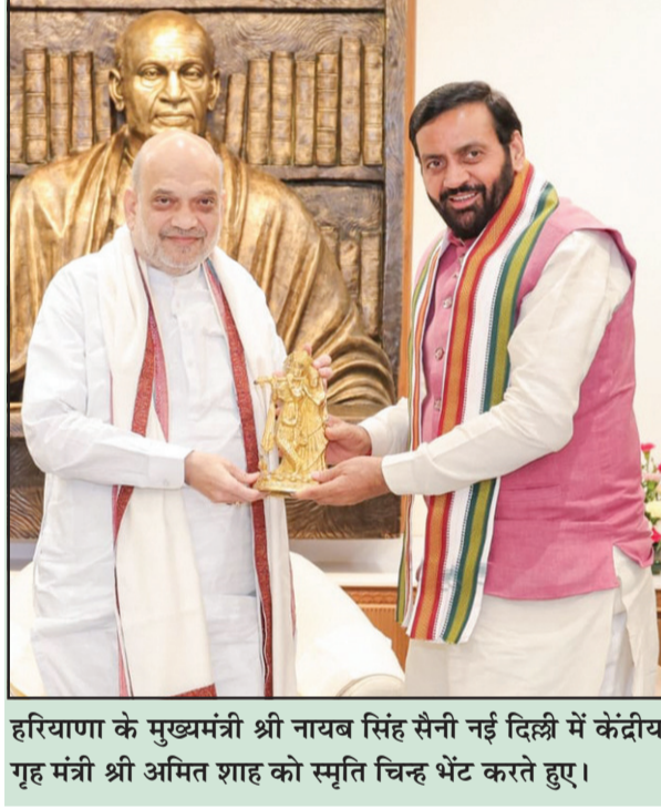
हरियाणा के मुख्यमंत्री श्री नायब सिंह सैनी नई दिल्ली में केंद्रीय गृह मंत्री श्री अमित शाह को स्मृति चिन्ह भेंट करते हुए।

नई दिल्ली, 11 जून (निस): प्रधानमंत्री नरेंद्र मोदी की अध्यक्षता में गुरुवार को नीति आयोग की 11वीं गवर्निंग काउंसिल की बैठक हुई। बैठक में विकसित भारत-2047 के लक्ष्य को हासिल करने के लिए समावेशी मानव विकास की रणनीति और उसके प्रभावी क्रियान्वयन पर व्यापक चर्चा हुई है। इसमें विभिन्न राज्यों के मुख्यमंत्री, केंद्र शासित प्रदेशों के उपराज्यपाल, केंद्रीय मंत्री और नीति आयोग के वरिष्ठ अधिकारी भागलिया। नीति आयोग के अनुसार इस वर्ष की बैठक का विषय 'विकसित भारत 2047 के लिए समावेशी मानव विकास' रखा गया है। इसका उद्देश्य यह सुनिश्चित करना है कि देश के विकास का लाभ उम्र, क्षेत्र, लिंग और सामाजिक-आर्थिक पृष्ठभूमि की परवाह किए बिना प्रत्येक नागरिक तक पहुंचे। बैठक में शिक्षा, स्वास्थ्य, कौशल (शेष पृष्ठ दो पर)