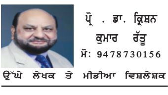
ਉੱਪ ਲੇਖਕ ਤੇ ਮੀਡੀਆ ਵਿਸ਼ਲੇਸ਼ਕ

ਕੀ 2027 ਦਾ ਚੋਣ ਮੈਦਾਨ ਪੰਜਾਬ ਲਈ ਗੇਮ ਚੇਂਜਰ ਹੋਵੇਗਾ, ਇਸ ਬਾਰੇ ਕਿਆਸਾਈਆਂ ਚੱਲ ਰਹੀਆਂ ਹਨ। ਇਸਦਾ ਵਿਸਤਾਰ ਜਾਣਨ ਲਈ ਅਸੀਂ ਪੰਜਾਬ ਦੇ ਮਸਲਿਆਂ ਡੂੰਘਾਈ ਨਾਲ ਵੇਖਾਂ ਜੋ ਅੱਜ ਪੰਜਾਬ ਦੀਆਂ ਚੋਣਾਂ ਨੂੰ ਪ੍ਰਭਾਵਿਤ ਕਰ ਰਹੇ ਹਨ। ਅੱਜ ਇੱਕ ਵਿਸਥਾਰਵਾਦੀ ਵਿਸ਼ਲੇਸ਼ਣ ਵਿੱਚ ਪੰਜਾਬ ਜੋ ਭਾਰਤ ਦਾ ਅੰਨ-ਭੰਡਾਰ ਅਤੇ ਖੇਤੀਬਾੜੀ ਵਿਪਲਵ ਦਾ ਗਵਾਹ, ਰਾਜਨੀਤੀ ਦੇ ਤੂਫਾਨੀ ਸਮੁੰਦਰ ਵਿੱਚ ਲਗਾਤਾਰ ਘੁੰਮ ਰਿਹਾ ਹੈ। ਇਥੇ ਪਲ-ਪਲ ਸਮੀਕਰਨ ਬਦਲਦੇ ਹਨ, ਆਇਆ ਰਾਮ ਗਿਆ ਰਾਮ ਵਾਲੀਆਂ ਤਬਦੀਲੀਆਂ ਆਮ ਹਨ ਅਤੇ ਡੋਰਿਆਂ, ਜਾਤੀਵਾਦ ਤੇ ਆਰਥਿਕ ਮੁੱਦਿਆਂ ਦੀ ਰਾਜਨੀਤੀ ਹਮੇਸ਼ਾ ਚਰਚਾ ਵਿੱਚ ਰਹਿੰਦੀ ਹੈ।