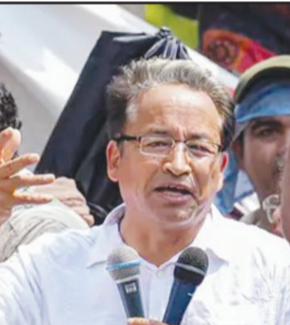
ਨੌਜਵਾਨਾਂ ਨੂੰ ਇਸ ਵਿਰੋਧ ਪ੍ਰਦਰਸ਼ਨ ਵਿੱਚ ਹਿੱਸਾ ਲੈਣਾ ਚਾਹੀਦਾ ਹੈ, ਇੱਕਜੁੱਟ ਹੋਣਾ ਚਾਹੀਦਾ ਹੈ, ਇੱਕ

ਨਵੀਂ ਦਿੱਲੀ, 6 ਜੂਨ (ਪ੍ਰਤੀਨਿਧੀ) : ਕਾਰੋਚ ਜਨਤਾ ਪਾਰਟੀ ਦੇ ਵਿਰੋਧ ਪ੍ਰਦਰਸ਼ਨ 'ਚ ਸ਼ਾਮਲ ਹੋਣ ਲਈ ਦਿੱਲੀ ਦੇ ਜੰਤਰ-ਮੰਤਰ ਵਾਤਾਵਰਣ ਕਾਰਕੁਨ ਸੋਨਮ ਵਾਂਗਚੁਕ ਪਹੁੰਚੇ। ਉਨ੍ਹਾਂ ਹਾਲ ਹੀ ਵਿੱਚ ਇਸ ਐਂਦੋਲਨ ਨੂੰ ਆਪਣਾ ਸਮਰਥਨ ਦੇਣ ਦਾ ਐਲਾਨ ਕੀਤਾ। ਆਪਣੀ ਫੇਰੀ ਦੌਰਾਨ ਉਨ੍ਹਾਂ ਨੌਜਵਾਨਾਂ ਨਾਲ ਇੱਕ ਸੁਨੇਹਾ ਸਾਂਝਾ ਕੀਤਾ। ਇਸ ਦੌਰਾਨ ਸੋਨਮ ਵਾਂਗਚੁਕ ਨੇ ਨੌਜਵਾਨਾਂ ਨੂੰ ਇੱਕ ਸੁਨੇਹਾ ਦਿੱਤਾ। ਉਨ੍ਹਾਂ ਕਿਹਾ