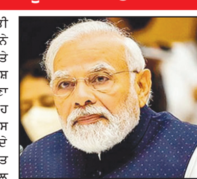
ਮੰਗ, ਸਰਕਾਰੀ ਖਰਚੇ ਅਤੇ ਪੇਂਡੂ ਅਰਥਚਾਰੇ ਵਿੱਚ ਮੁੜ ਸੁਰਜੀਤੀ ਦੇ ਸੰਕੇਤ ਸਨ, ਜਿੱਥੇ ਪਿਛਲੇ ਵਿੱਤੀ ਸਾਲ ਦੇ ਮੁਕਾਬਲੇ ਟਰੇਡਟਰਾਂ ਦੀ ਵਿਕਰੀ ਵਿੱਚ 23% ਦਾ ਵਾਧਾ ਹੋਇਆ ਹੈ।

ਜੀਵਨ ਅਤੇ ਕੰਮ ਨੂੰ ਸੌਖਾ ਬਣਾਉਣ ਲਈ ਹੋਰ ਸੁਧਾਰ ਵਿਚਾਰੇ ਗਏ 'ਤੇ ਵੀ ਚਰਚਾ ਕੀਤੀ ਗਈ। ਕੌਸਲ ਦੇ ਮੈਂਬਰਾਂ ਨੇ ਭਾਰਤ ਅਤੇ ਵਿਸ਼ਵ 'ਤੇ ਪੱਛਮੀ ਏਸ਼ੀਆ ਦੇ ਸੰਘਰਸ਼ ਦੇ ਪ੍ਰਭਾਵ ਬਾਰੇ ਵੀ ਆਪਣਾ ਮੁਲਾਂਕਣ ਦਿੱਤਾ। ਇਹ ਮੀਟਿੰਗ ਭਾਰਤ ਦੇ ਵਿਕਾਸ ਅਨੁਮਾਨਾਂ ਦੇ ਭਵਿੱਖਬਾਣੀਆਂ ਨੂੰ ਮਾਤ ਦੇਣ ਦੇ ਵਿੱਚੀ ਸਾਲ 2026 ਵਿੱਚ 7.7% ਜੀਡੀਪੀ ਵਿਕਾਸ ਦਰ ਦਰਜ ਕਰਨ ਤੋਂ ਇੱਕ ਦਿਨ ਬਾਅਦ ਹੋਈ ਹੈ। ਜਨਵਰੀ ਤੋਂ ਮਾਰਚ ਦੀ ਤਿਮਾਹੀ ਵਿੱਚ ਵਿਕਾਸ ਦਰ 7.8% ਤੱਕ ਵਧ ਗਈ, ਜਿਸਦਾ ਕਾਰਨ ਮਜ਼ਬੂਤ ਘਰੇਲੂ